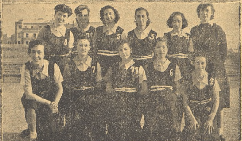
A la izquierda: Arriba, un momento del partido Ciudad Real-Asturias.—Abajo, un tiro de Guadalajara es interceptado por la defensa manchega.- A la derecha Arriba, una jugada del partido Madrid-Ciudad Real. En medio, la delantera ciudadrealense. Abajo, el equipo de Ciudad Real. Guapas chicas, pero Málaga les ganó por 4-0; claro que no en belleza.

MADRID. - Se han desarrollado en Madrid, en el campo municipal de Vallehermoso, durante los días 20, 21, 22 y 23 del mes de Marzo, los campeonatos nacionales de balonmano de la Sección Femenina del primer sector. A este campeonato han concurrido las representaciones de Málaga, Asturias, Madrid, Guadalajara y Ciudad Real, habiéndose clasificado por el orden que hemos enumerado. No somos cronistas muy documentados y menos aún en lo que se refiere al deporte de balonmano, pero, como