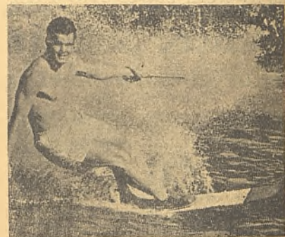
Así se esquia sobre el agua

La mayoría de las personas abrigan la impresión de que esquiando en el agua es tan peligroso como ir montado en la cola de un cohete. En eso se equivocan. El deporte le esquiando en el agua, pleno de gracia, rapidez y emoción, nació hace 19 años, cuando unos soldados franceses pertenecientes a un batallón alpino se decidieron aprobar sus esquís en el agua.