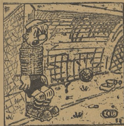
—¡Por eso me fastidia a mí jugar fuera de casa...!

MADRID.—Nada menos que siete negativos llegó a tener el Girod mediada la primera parte de la Liga y ha ido enjugando el déficit hasta terminar dignamente en el centro. ¿Cómo ha sido posible Sencillamente, jugando cada semana con más ardor, con sin igual entusiasmo, porque no creemos que en tan poco tiempo se hayan hecho grandes jugadores.