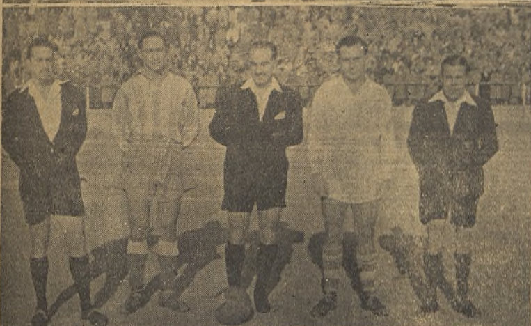
Los momentos del Cuatro Caminos-Rayo. Abajo, capitanes, árbitro y jueces.