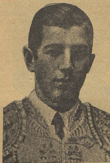
Antonio Ordóñez, el torero que más toros mató en 1952.