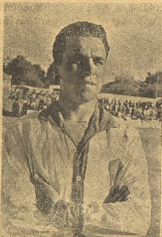
VALCH, EL MEJOR DE LOS 22 EN CUENCA.

ve que estoy nervioso? Gracias por su deferencia.