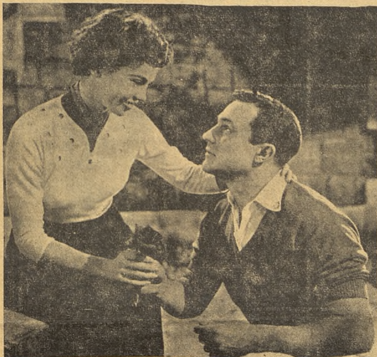
Leslie Caron y Gene Kelly de la M. G. M. en "Un americano en París".

El ritmo de vida actual ha hecho desaparecer la sonrisa de muchos semblantes y sólo se ven ceños fruncidos y expresiones agrias, incluso en aquellos personajes en quienes la sonrisa era obligatoria, como por ejemplo, los camareros y doncellas de hotel, y todos los que prestaban un servicio pagado al público. Era indispensable sonreír, pero ahora los tiempos han cambiado y muchos creen que pueden evitarse este requisito.