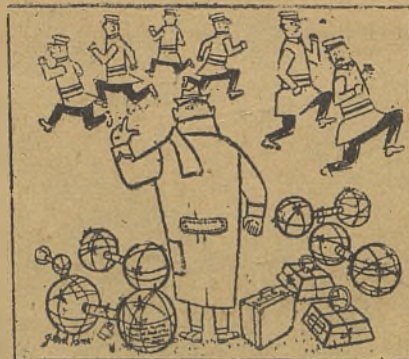
—¡Eh, mozo, mozo!... (De "Paris Match").