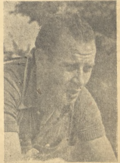
Koblet, que al fracturarse la clavícula, deja libre el puesto de favorito que se le asignaba.

Vicente Iturat, catalán, está realizando