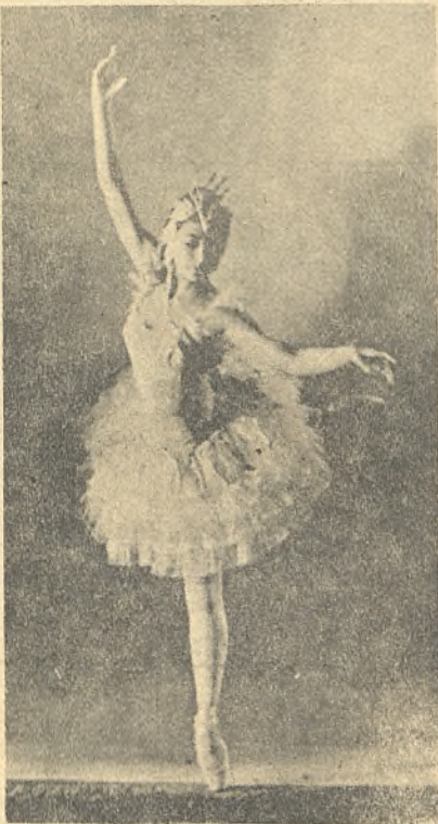
La bailarina Margot Fonteyn, en una actuación.

Gracias a la Dirección General de Bellas Artes ha intervenido en el Festival de Música de Granada, la gran bailarina Margot Fonteyn, a quien la concurrencia tributó una ovación que será memo-