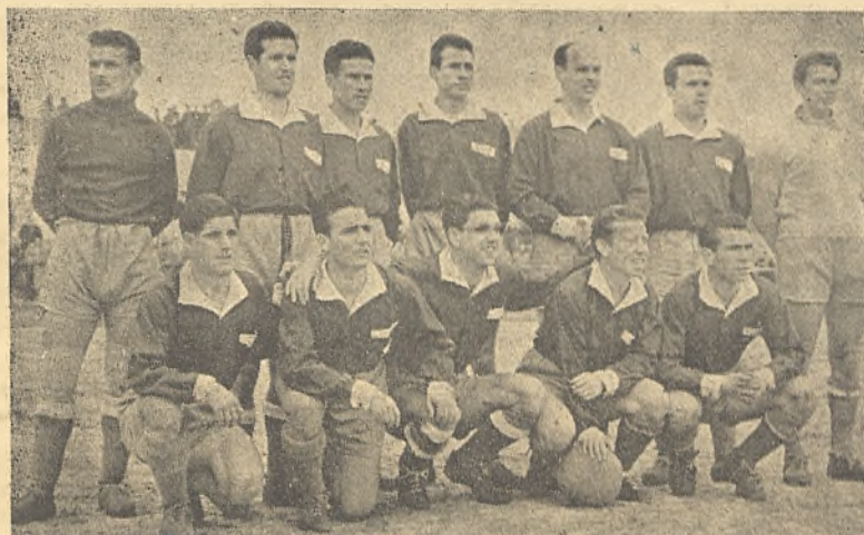
Una de las últimas formaciones del Manchego 1952-53.

les unas palabras. Como el tiempo corre, más deprisa de lo que conviene, estamos alarmados porque nos vemos, a lo largo de la temporada, haciendo un papel... ¿pero qué papel!