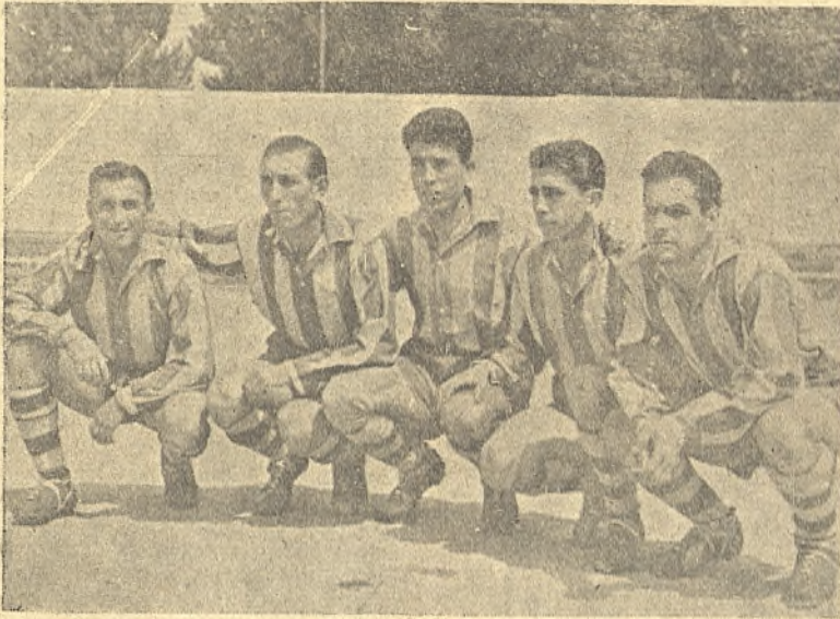
La línea delantera del Ferrocarril que jugó en Madrid.

Durante el descanso del partido celebrado en Madrid, entre el Marconi y el Ferrocarril, tuvimos la ocasión de ha-