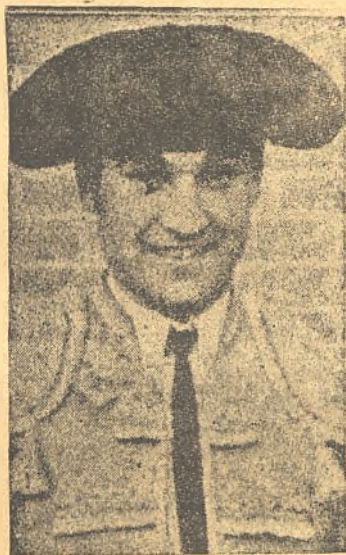
Antonio Bienvenida, pundonoso torero, que fué quien dió la voz de alarma contra el "afeitado" de los toros.

mo con la muleta, excelente banderillero siempre y buen matador cuando decidió arrimarse, el toro "Viajero" se interpuso en su camino y no le permitió ser la primera figura que todos los aficionados advirtieron y deseaban.