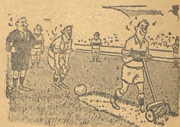
ANTES DEL GOLPE FRANCO.