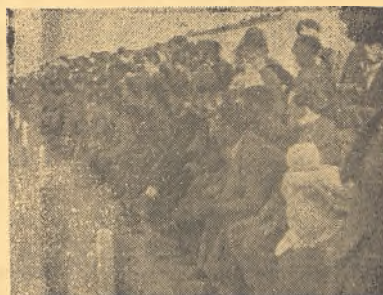
He aquí el numeroso público que en Malagón acude a los partidos y que demuestra la afición que existe al fútbol.