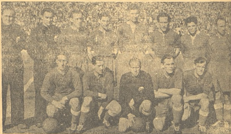
Equipo alemán del Mulhburg que jugó contra los preseleccionados.

De la misma manera que antes Escartín anduvo en la cuerda floja de la Prensa de Madrid, ahora anda en la de Bilbao, pues hemos leído en las columnas de los diarios bilbaínos artículos, editoriales y reportajes que tienden a que el