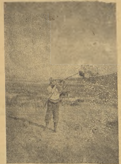
La pieza es atraída como por un imán...