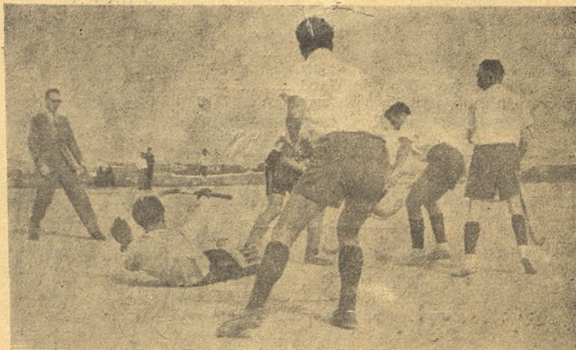
Un ataque español, con salida del guardameta alemán.

ya que hubo prórroga y todo, en que vencieron los madrileños 2-1, ganando, por tanto, este torneo internacional que se nos ha presentado muy halagüeño para los colores hispanos, demostrando con ello nuestra potencialidad y muy dignos