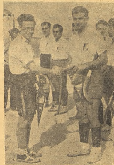
El capitán del equipo alemán, saluda al capitán del equipo español, de tener en cuenta, en futuras competiciones en el deporte del hockey.

El domingo por la mañana, jugóse la final, entre el junior de Madrid (que anteriormente había vencido a Catalanes) y el Wiesbadenez Tennis U. alemán, tras un partido sumamente interesante.