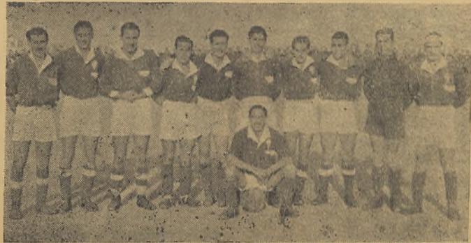
Uno de los equipos del Manchego de la época de Emiliano, al que se ve el tercero de la izquierda, arriba.

—Creo se presta poca atención a los campeonatos locales y que en el Club