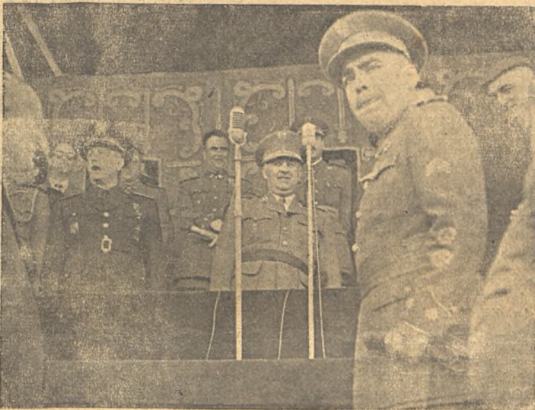
El Jefe del Estado, Generalísimo Franco, en el acto de clausura de los Juegos Escolares. El ministro del Movimiento en el uso de la palabra. En primer término, el teniente coronel Agulla, asesor nacional de Educación Física del Frente de Juventudes.