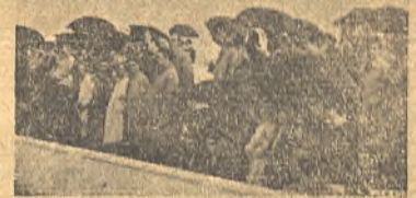
El marcador en dos tiempos y el público aguantando la lluvia durante el partido Manchego-Toledo.