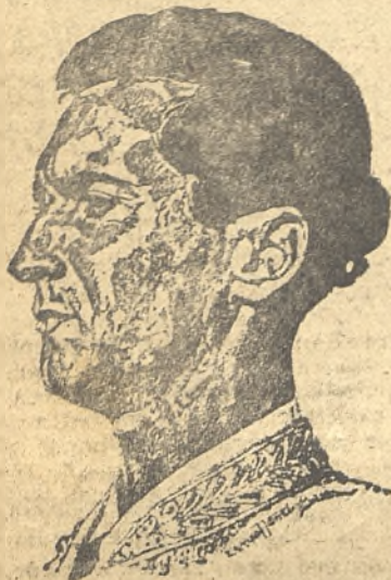
LUIS MIGUEL DOMINGUÍN

"Ayer, estaba Luis Miguel ante mí en un salón a la española hablando de buena gana de sus proyectos cinematográ-