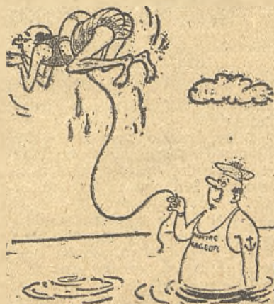
—¿Pero usted quiere aprender a nadar o a volar? (De "France Dimanche").