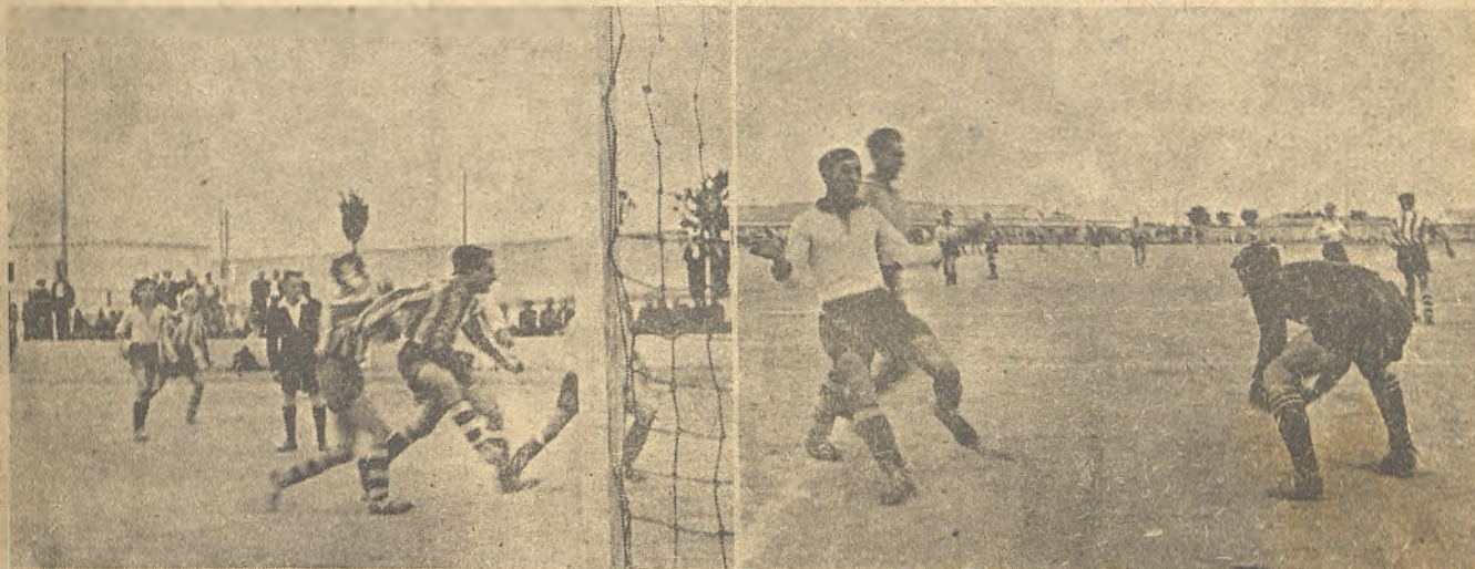
Dos escenas del Ferrocarril-Herencia: A la izquierda, los ferroviarios se llevan las manos a la cabeza al fallar un gol hecho. A la derecha, el portero de Herencia protegido por el ex-manchequista López, recoge un balón.