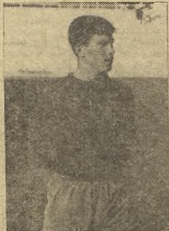
Agüilla volvió a ser el más destacado de los locales

El Aranjuez ha jugado un mal encuentro en general, pues si bien empezó con orden y domi-