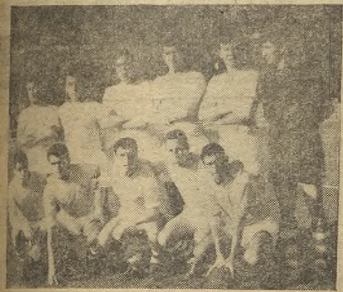
El Celta, de esta temporada, que jugó un buen partido con el Rayo.