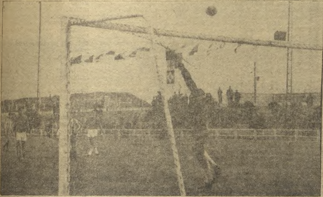
Gracias a Clemente, el Manchego no encajó más goles en Puertollano, en un partido desafortunado, que ganó justamente el Atlético Calvo Sotelo. En la foto de Rueda, vemos una de las magníficas intervenciones del meta mancheguista. (Información en página quinta).