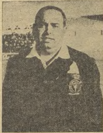
El orondo Sr. Winter "inmovilista", "caserillo" y "actor"

do gala una vez más de su incapacidad física para seguir de cerca el juego, y estuvo «case-rón», «comediante»; pitaba lo que no debía y dejaba de pitar