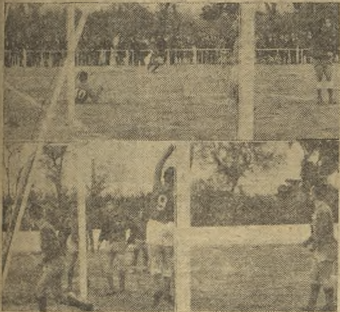
El Soguellamos venció en Aran juez (información en página 6. a ). En las fotos de Talavera, vemos, arriba, el gol local; y abajo, el del triunfo visitante, con claras muestras de júbilo del delantero, Mateo