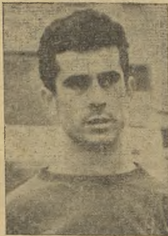
Cabilla sobresalió por el equipo cacereño

El Cacereño, ya queda dicho, nos ha parecido un señor equipo, desentonando un tanto su central, al que, creemos, le falta velocidad y le sobran años. Puede y debe ser uno de los can-