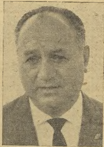
—La misión nuestra es trabajar y preparar a los jugadores tanto en el aspecto físico como

—¿En la reacción del equipo ha influido la labor del entrenador o de los jugadores solamente?