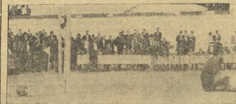
El primer gol del Valdepeñas a los pocos minutos de iniciado el partido.

En el segundo tiempo, todos pensábamos que, el Valdepe-