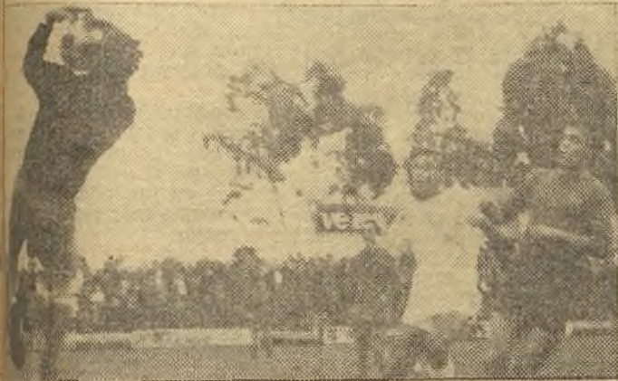
La poblada defensa del Getafe, se estrellaron los ataques locales

Lozano: "Un partido que ha merecido ganar por cuatro goles de diferencia el Mérida Industrial, por el buen juego desarrollado, sobre todo en la primera parte que arrolló materialmente al Getafe, pero la mala