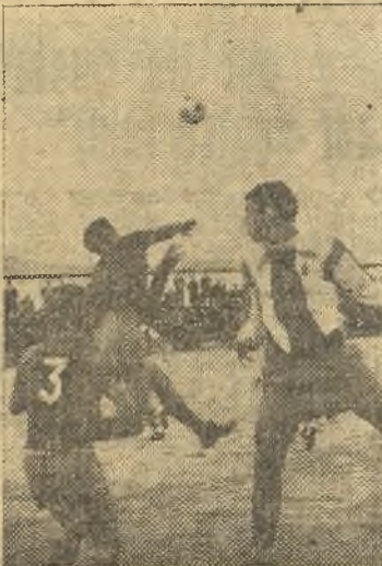
El Plasencia atacó siempre. Aquí le vemos en una de sus acciones. Al final, logró un corto triunfo de 1-0. (Información en página once)