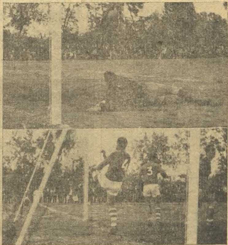
Equitativo reparto de puntos en Aranjuez. Talavera captó así los dos tantos, uno por bando. Arriba, el del Cacereño, sin remisión. Abajo, el del Aranjuez, que no sienta bien al volante derecho visitante. (Información en página ocho)