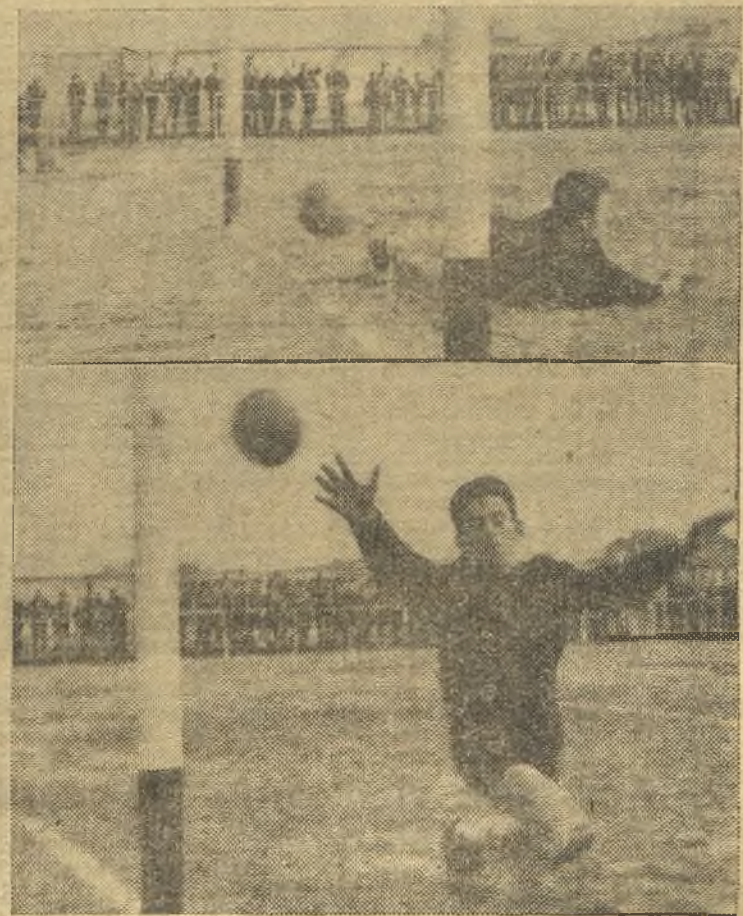
El Moscardó ganó por un solo gol frente al Imperio. En las fotos de Angel, arriba, el solitario tanto; abajo, un vicegol en forma de poste. (Información en la página once)