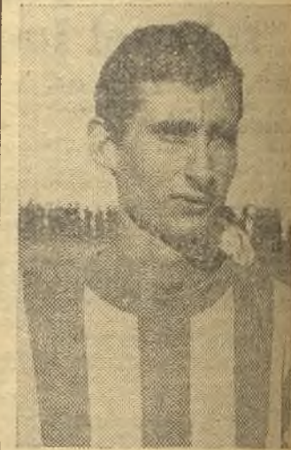
Silva, destacado en el Carabanchel

en litigio se los ha llevado el equipo visitante. El Carabanchel ha sabido aprovechar, co-