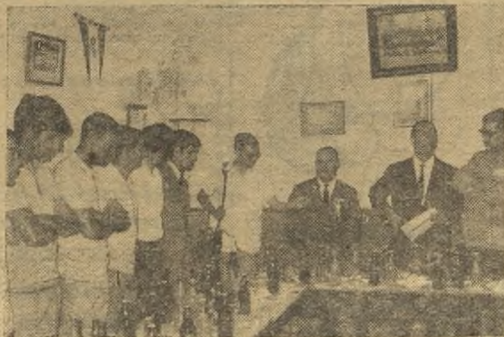
Un momento del acto de presentación de los nuevos jugadores del Cacereño. (Información en página séptima)