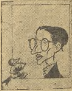
EL CUCO DE ALCAZAR ESTA MOSCA