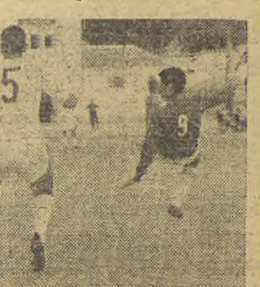
Y con aires de equipo acoplado y ello, a estas alturas, es meritorio.

juego, que no se anda por las ramas a la hora de demostrar que el fútbol es "cosa de hombres" y que en el grupo en el que está encuadrado, muy mal se le tienen que poner las cosas, para no ocupar un lugar de privilegio. Porque sobre tener jugadores que se saben la papeleta, juegan un fútbol de contrataque bastante efectivo.