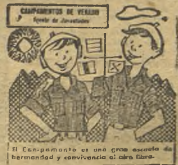
El Campamento es una gran escuela de hermandad y convivencia al aire libre.