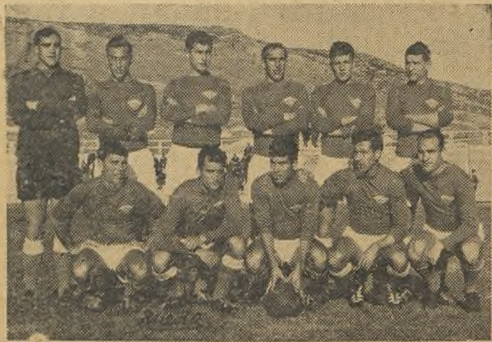
La A. D. P. Ultra de esta temporada

MADRID. (De nuestro co-campo, que el árbitro vio por irresponsal, JOLOMAR).— La estar cerca del jugador y no cosas del fútbol son así y así quisiera señalar; ello fue la causa hay que tomarlas. El Plus Ul- de que nuestro defensa perdie-