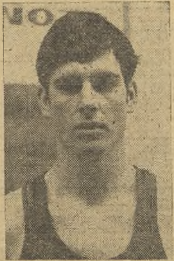
—Posiblemente las palabras del Caudillo, en audiencia especial concedida al equipo.

Arbitraron perfectamente los señores Serrano y Blanco. El partido era muy difícil, pero sinceramente supieron salir airoso de su misión.