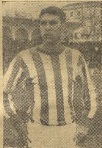
Calle, el mejor del Mérida Industrial

travesaño; 20 minutos después, Macías malogra una clara ocasión de gol; faltando 5 minutos para finalizar la primera parte, en la mejor jugada de la tarde, Soto remata y Valbuena despeja a córner. En la conti-