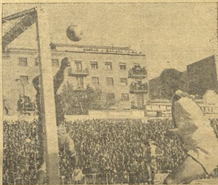
El Rayo no pudo con el Coruña, que es un "Primera" que juega en Segunda. En la foto de Eulaguer, Grande intenta el remate, pero se le anticipa el mita forastero. (Información en la página tercera)