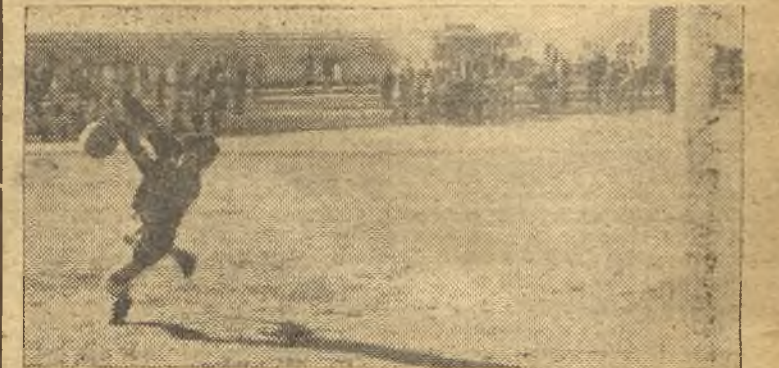
El portero del Juvenil del Calvo Sotelo hace una buena parada.

MADRID. (De nuestro enviado especial, FRAN).—Al mediodía del domingo, se jugó en el campo del Boetticher el partido de juveniles entre el Chamartín y Calvo Sotelo, primero y segundo clasificado, que terminó con victoria de los madrileños por cinco tantos a dos.