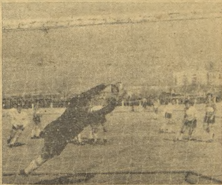
Navas tuvo una buena actuación. Aquí se vemos haciendo una gran parada. Sin embargo, el Carabanchel no pudo con el Boetticher. (Información en la página 12)