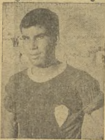
Camargo, el más destacado en las filas placentinas.

30 minutos de juego. Jugada por la banda de Mora, que tira cuando llega a la proximidad