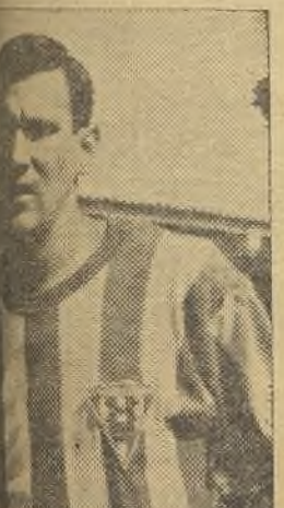
destacó en las filas femsistas.

¡Claro es, que nosotros lo veíamos venir, esperando el milagro, pero no hay milagros en el fútbol! Los billetes son los que hacen los milagros.