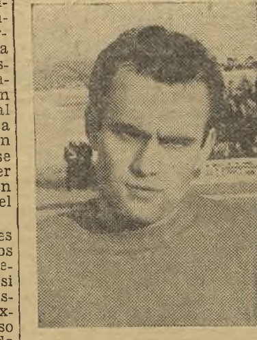
Angelín también fue figura entre los visitantes.

El final fue como siempre. Querer y no poder. El caso es que, en honor a la verdad, el Askar tuvo mala suerte en el chut pero ya cuando el Femsa, con la victoria en el bolsillo, se cerró en puerta. Hubo goles cantados, goles que iban derechos a la red pero, de forma incomprensible, surgía la bota milagrosa y despejaba el peligro. Recordamos un balón medio dentro y medio fuera de la raya de gol con dirección a la red, y miren ustedes la mala suerte, llegó al poste lo besó y se salió.