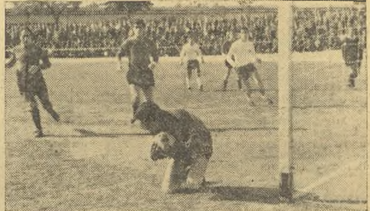
Angel hizo un esfuerzo y estuvo en Carabanchel y Villaverde, el domingo. En esta foto, una buena parada del portero conquense

A pesar de ello, el Boettlicher mereció mayor ventaja en el marcador