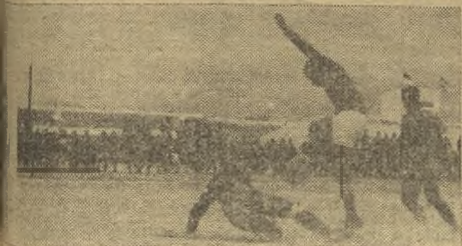
Marcó los tres goles del Socuéllamos. En la foto de Carrión se ve en uno de ellos. (Información en página sexta)