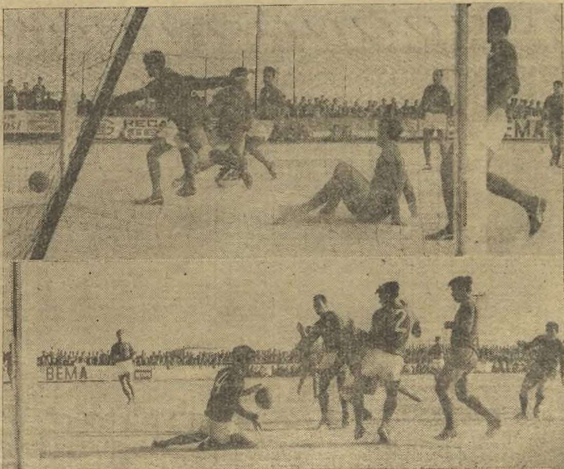
El Valdepeñas sigue imbatido. En Getafe, el partido fue muy bueno. Arriba, Ramón remata y sale lamiendo el poste; abajo, el 4 visitante (Romero) hace esa "parada" que el árbitro no vio. (Información en página once)