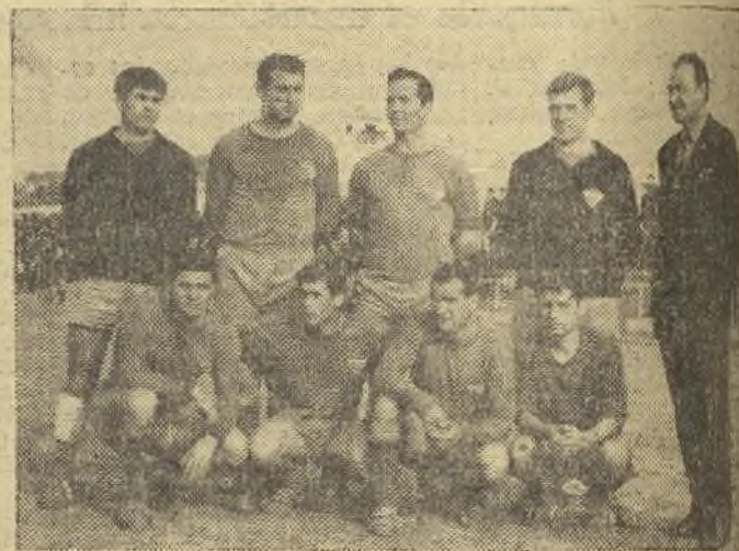
He aquí a los ocho jugadores locales del Aranjuez, en un momento de la sesión del presidente del club.

Si existiera un premio para aquellos clubs de categoría modesta que alinean más jugadores locales en su conjunto, Aranjuez hubiera sido un candidato al mismo. Y consideramos que se mere-