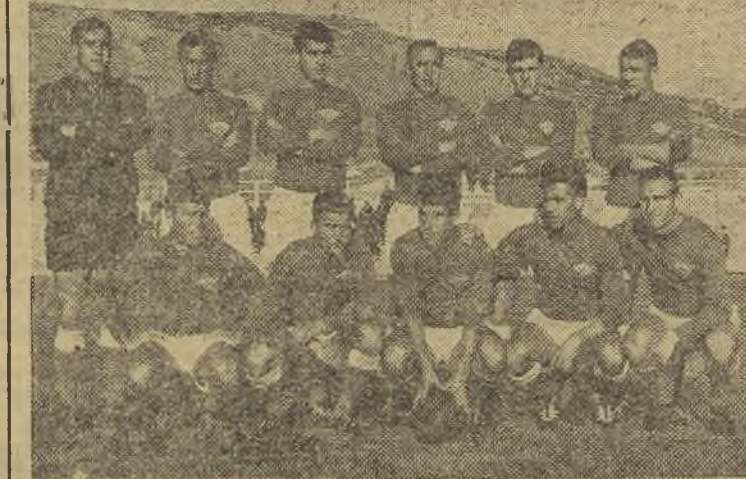
El Plus Ultra, con su triunfo en Gerona, tiene grandes posibilidades de pasar la eliminatoria