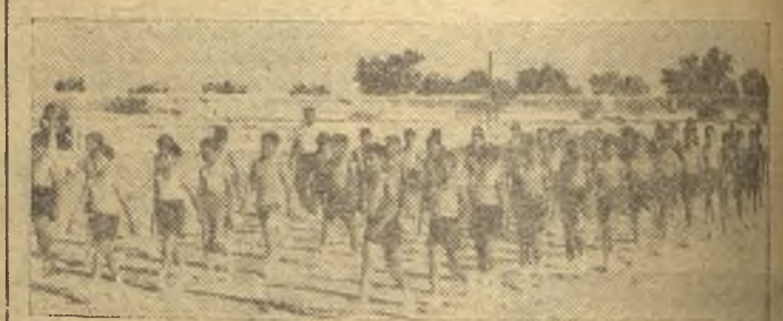
Los jóvenes gimnastas en el momento del desfile.