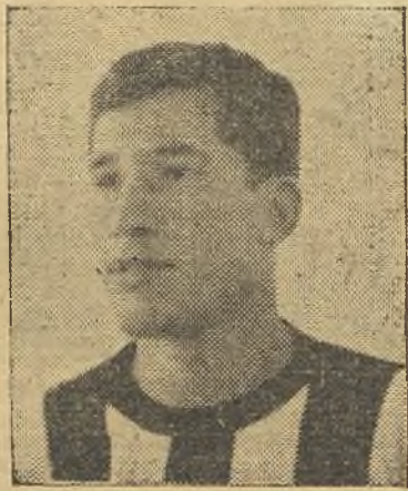
Pachón volvió a ser el coloso del equipo

parte cambiaría la decoración al tener el viento a favor y abierto el marcador, pero no fue así, hubo fallos en las líneas locales que arrastraron al conjunto, hombres triunfadores de otras tardes no supieron