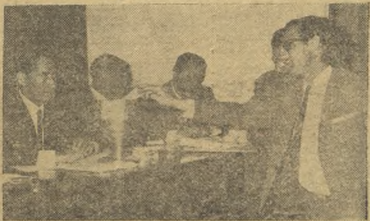
En la Federación Castellana se celebró, días pasados, una reunión de representantes de clubs de categoría regional. En la foto, vemos un momento de la elección de compromisarios que representarán a dichos clubs en la Federación. (Información en página tercera)