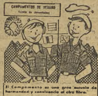
El Compañero es una gran escuela de hermandad y convivencia de otro libro.

AVIACO Simplifica los desplazamientos de los deportistas. Solicite información en su agencia de viajes o en nuestras oficinas.