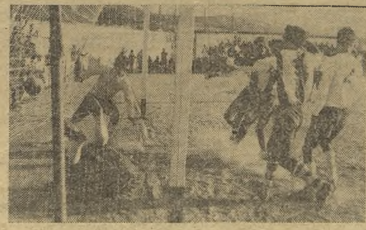
El Plasencia ganó por la mínima ante un duro Boctlicher. Este es el segundo gol local, marcado un poco a trompicones y ayudado por el interior derecho visitante, en una melée. (Información en página doce)

Pedro Muñoz no tuvo sitio en el campo; sus peones andaban descolocados y con péndulo, por lo que solo se limitaron a hacer esporádicos contraataques, en tanto