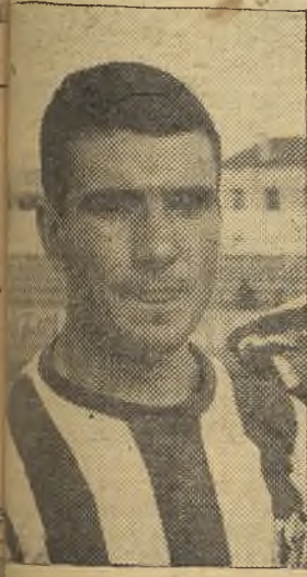
... el único que apuntó alguna cosa

Elices: "Nuestra táctica ha (Pasa a la página décima)