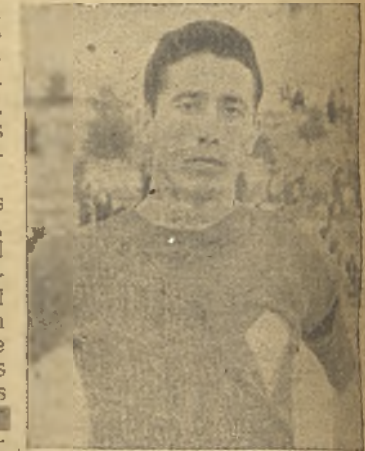
Naranja, uno de los más destacados del Villarrobledo.

juzgar con justeza lo que este encuentro hubiera dado de sí, de jugarse en terreno seco, ya mucho de los que se pudo ver quedó enterrado en el fango, en intentos en flor, que no dieron su fruto. Se puede considerar, dentro de todo, como justa la victoria local, aún a pesar de que el gol conseguido por Camargo —a los 21 minutos— vi-