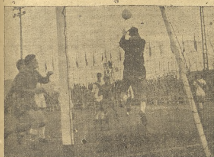
Secito en una buena parada. Basurto al acecho. (F. Rueda).