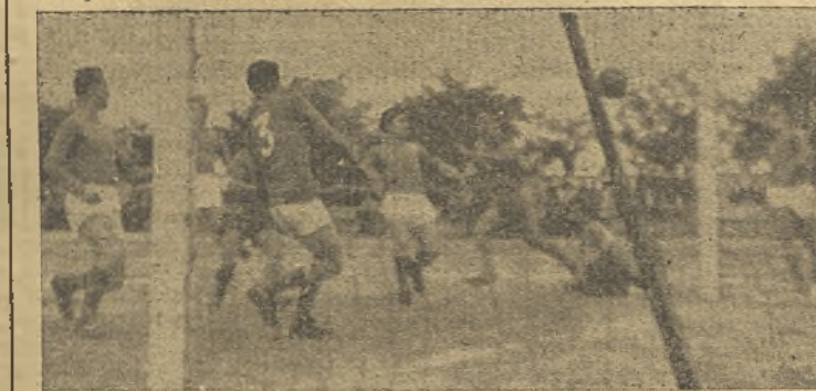
Igualada a tres tantos exactamente en el minuto final conseguida por el central Calderón.

A los 10 minutos de la primera parte, en un corner botado por Tony, Díaz de cabeza