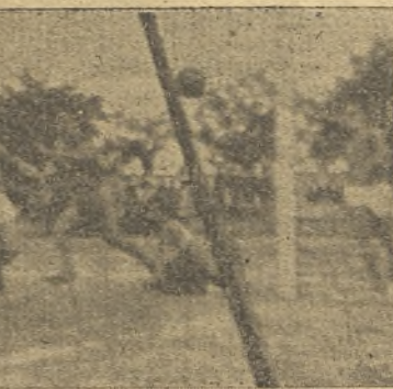
Igualada a tres tantos exactamente en el minuto final conseguida por el central Calderón.

Cuando pasamos finalizado el partido, al recinto de los vestuarios los expedicionarios alca-