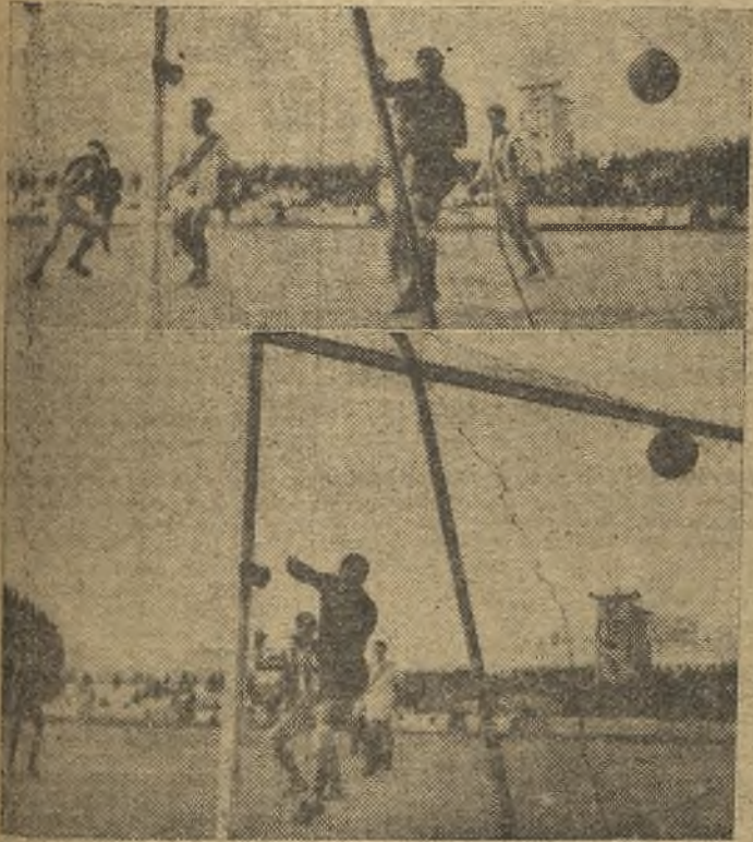
Así fueron el segundo y tercer goles del Talavera, que, en brillante rotación, pudo remontar el tanteo adverso frente al Quintanar. (Información en la página catorce)