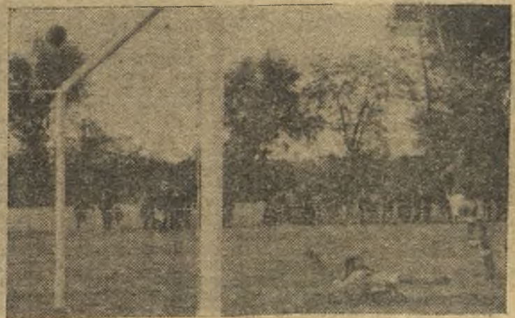
Arriba, uno de los cuatro goles del Aranjuez. Abajo, momento en que el entrenador del Alcalá es expulsado del terreno de juego, cosa que tama a broma, sonriente, porque el partido ya no es decisivo para su equipo. El Aranjuez se impuso netamente al conjunto alcalaíno. (Información en la página quinta).