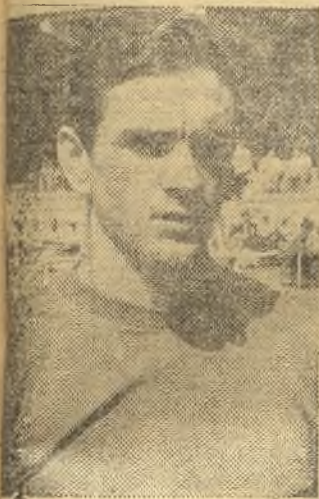
Goyo logró dos goles de los cuatro tantos

PLUS ULTRA: Bermejo; García-Filia, Pascual, Perdiguero; Ajillo, Maroto; Casado, Goyo, Martín, Martín y Javier.