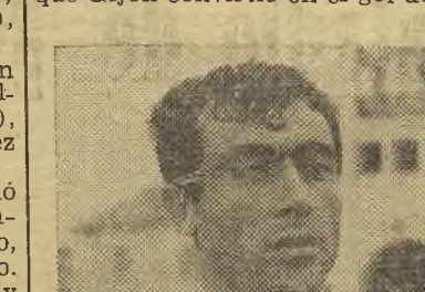
Gijón fue uno de los destacados del equipo local.

favor del aire presionó con insistencia y logró un gol, que el árbitro, que está amal situado no concedió. Poco después compensó con penalty inexistente que Gijón convirtió en el gol del