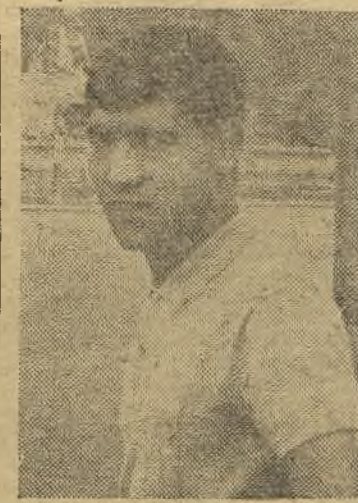
Caballero se distinguió en el Talavera

el minuto doce, el meta Peña le quita un balón a Peiró en la misma boca de gol. El Talavera está haciendo fútbol de calidad y el público aplaude constantemente las jugadas. En el minuto 16, Cacereño recoge un balón