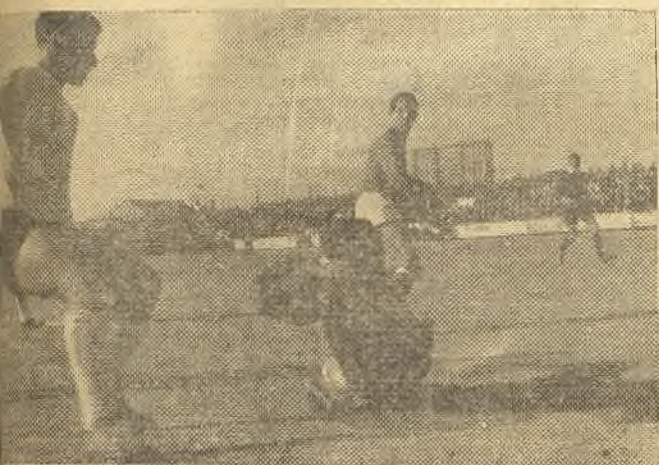
Buena parada del meta del Alcalá, que sin embargo no pu- do evitar los tres goles locales.

(De nuestro corresponsal CONCHITO LOZANO). Alcalá, 3 (Boro, 2 y Mo- Alcalá, 0. Castillo; Tomás, Ca- Castillo; Cabrerana, Sego- mán, Ramón, Brotons, Cha- Ramón).