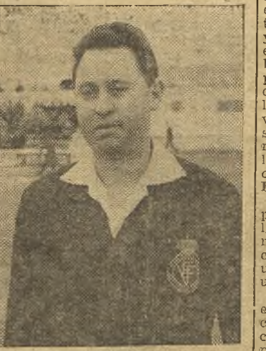
Olmos realizó un pésimo arbitraje en Aranjuez.

Mientras, el Aranjuez sacaba fuerzas de flaqueza y luchaba ante los de Usera con todas sus armas; el deseo, la entrega y su entusiasmo. Se forma la de San Quintín du-