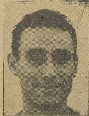
Anta, el único que se salva del naufragio

Esto nos recuerda cierta crónica escrita por nosotros en la anterior estancia del Badajoz en Segunda División, y no que-