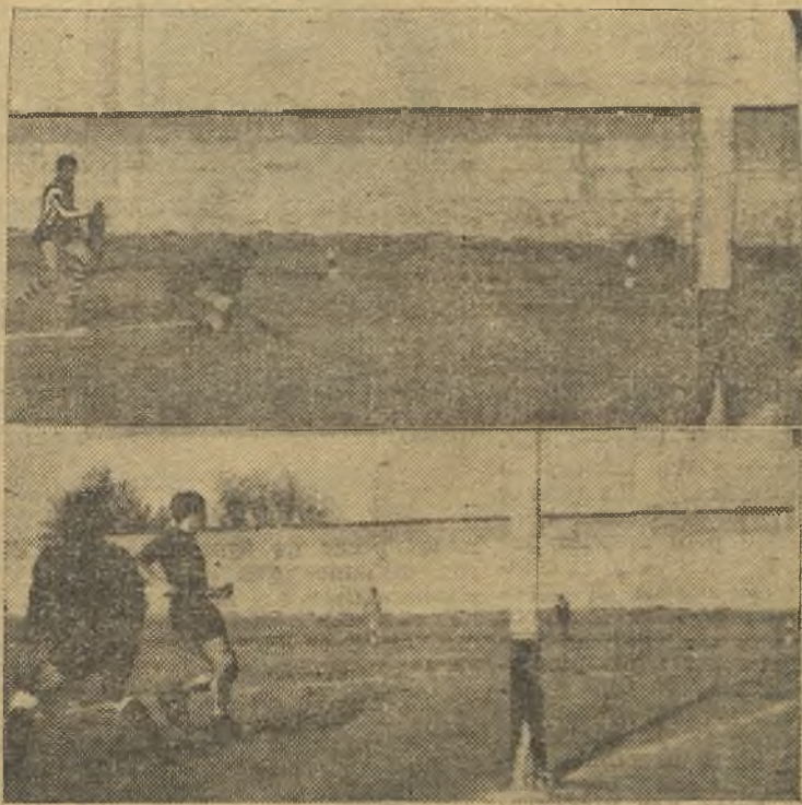
También los de Tercera Regional tienen su corazoncito. Y el Cripitanense goleó al Tarancón. En las fotos de Díaz Hellín, arriba uno de los siete goles locales. Abajo, otro de la serie.