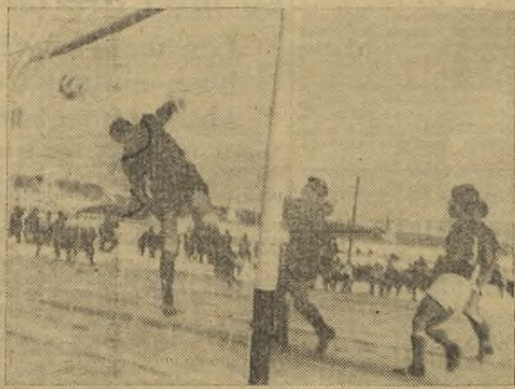
Así se produjo el único gol del Socuellamos.

el Femsa; continuó la presión local, pero siguió, también, la inoperancia e ineficacia de los delanteros azul socuellaminos. El encuentro no tuvo más brillantez que la de la excelente tarde y el consiguiente disgusto. Destacaron por el Femsa, Hernández, Cantalapiedra, Pérez, Serrano. Por el Socuellamos, Palero, sobre todos, siguiéndole en