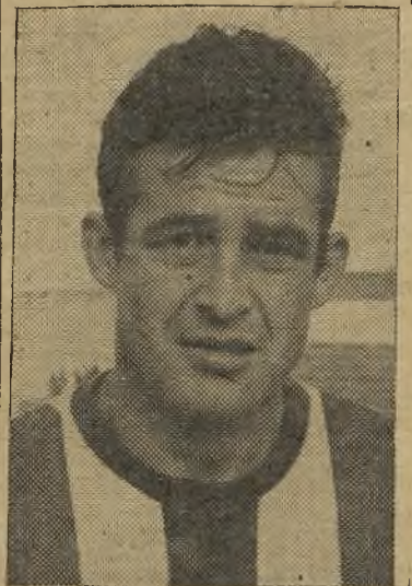
Cacereño, uno de los más distinguidos del Talavera

ma instancia ceden constantemente balones a córner. Cuando tienen ocasión de ello también se lanzan al ataque, con mucha