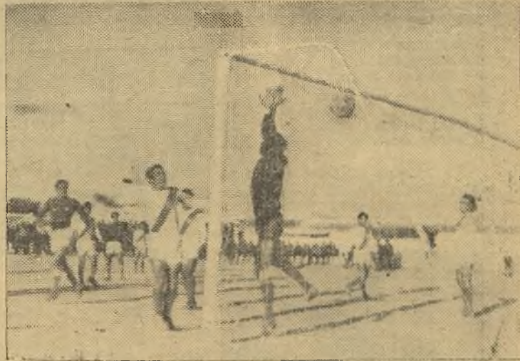
Primer gol local, a tiro de Goyo desde fuera del área.

2-1. Se registra aquí una pequeña reacción del equipo forastero y al producirse una falta botada ésta por Sanz muy bien sobre el punto de penalty,