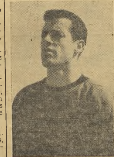
Portillo destacó en las filas alcarreñas

puesto justamente ante un equipo que ha demostrado que, el lugar que ocupa en la clasificación, no es casualidad. Comen-