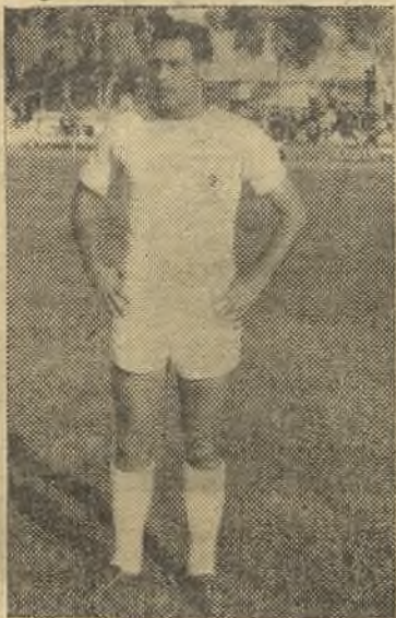
Soto volvió a destacar en el Mérida-Industrial

animación del encuentro fue perdiendo calidad progresivamente hasta hacer que los aficionados que habían recibido a los locales con muchos aplausos y ánimos, como queriendo premiar su victoria en Zaíra, y las extraordinarias jugadas iniciales de este encuentro, comenzaran a impacientarse y tuviera que hacer valer palmas de tango, que se acrecentaron, sobre todo, en el segundo tiempo.