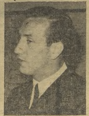
Noya debutó en Los Cármenes, pero aún le falta acoplamiento.

ambos bandos de conseguir resultados positivos. Ha habido una gran dureza, más acusada en la segunda parte en la que