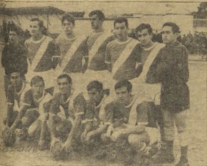
Manzanares de esta temporada. Todos son locales, a excepción uno de los porteros. (En página nueve, información sobre el partido contra el San Fernando).