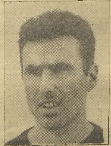
Monóvar, extremo pacense, que destacó

Vallecas. El Badajoz quiso guardar la ventaja, replegó algo más sus hombres, y éste fue su error; el Rayo se volcó, como es habitual en él, y buscó el triunfo con ahínco; volvió la rapidez, y Grande empató en jugada personal, batiendo a Vendrell, que quedó algo abandonado por su defensa. Llegó el gol de la victoria en el minuto cuarenta y dos, marcado por Ortega, a pase de Aparicio, que envió al fondo de la red de centro cabezazo. El Badajoz vino no solo a aguantar el partido, sino que vino a vencer, y a punto estuvo de conseguirlo, pero les diremos