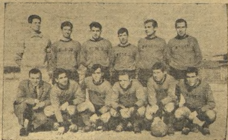
Equipo del FERCU de la actual temporada, en el que figuran muchos de los que actuaron el domingo