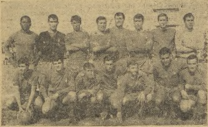
El Calvo Sotelo que jugó el día de la Ascensión en Albacete, entre el que figuran los nuevos jugadores a prueba