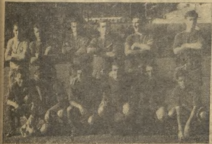
El Calvo Sotelo, que en Pamplona tuvo una destacada actuación, logrando un valioso empate.

PAMPLONA. (Servicio especial para ARCO). Club Atlético Osasuna, 1 (Fanjul); Calvo Sotelo, 1 (Posada). A las órdenes del catalán Tomeu, que estuvo mal, por-