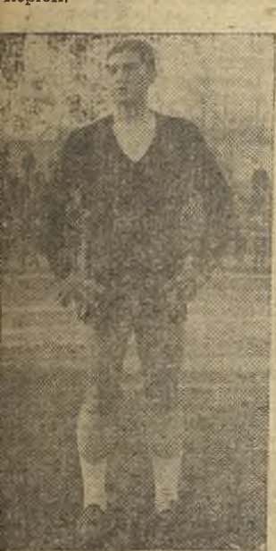
Ballesteros hizo enormes paradas

Alcalá de Henares. (De nuestro corresponsal, Juan Calvo). Alcalá, 5 (Brotons, Uribe, Anglin (2) y Rodríguez); Torrijos, 1 (Paco I).