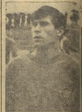
Agüilla, que, esta temporada, ha destapado en el Aranjuez

Aún habría tiempo para que se produjera un penalty al