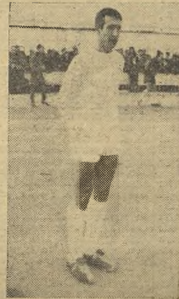
Luna, el mejor del Valdepeñas y sobre el terreno de juego

Boetticher: Intriago; Enrique, Herrero, Fernández; Rafa, Leta; Segundo, Salva, Luis, Miguel y Moreno.