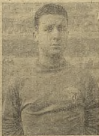
Escobosa hizo los dos tantos del Toledo

Se caldeó el ambiente, las "malas artes" que comenzaron en Amarilla, se extendieron y los cuidadores salieron, por ambos bandos, en varias ocasiones. El Toledo seguía sin funcionar, pero presionaba a ratos y ponía peligro, y así, resolviendo una me-