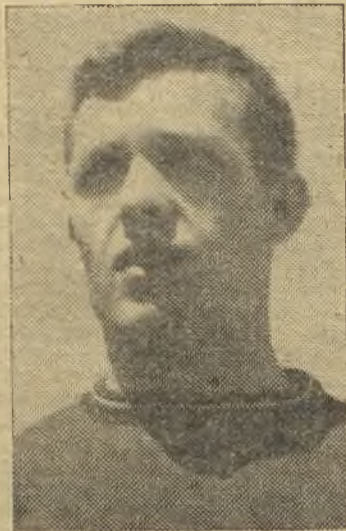
Perea, el portero local, estuvo inmenso

quehacer era siempre peligroso. Pero el Aranjuez respondía con furia y entusiasmo y el dominio en bloque correspondió a los propietarios que en-