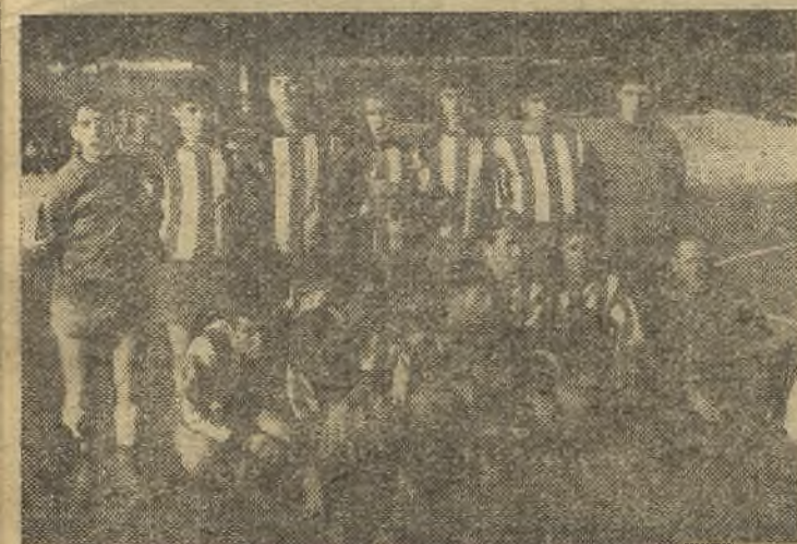
El Juvenil del Santa Bárbara, que fue eliminado, el domingo, en Madrid, en partido de desempate, por el Juvenil del Calvo Sotelo, que sigue en la competición y que ahora jugará una ligülla con los campeones de los tres grupos de Madrid.