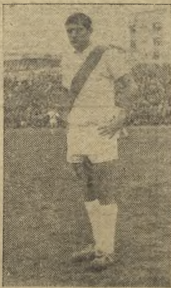
Moya fue uno de los más destacados

hueco, lo mismo que Iznata muy marcado y, cuando ensayó el tiro, lo hizo mal; y en la defensa, buen partido de Benito; hoy nos ha gustado por su serenidad, siguiéndole Chufi y bajando algo más Flores; y en la puerta Samper, bien, superándose en el segundo tiempo; en