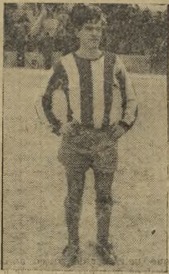
Diego, el otro expulsado

20 minutos del segundo tiempo. En un acoso de la delantera del Avila a la meta del Díter, se producen tiros y rechaces. José recoge el balón de uno de ellos, se interna en el área y lanza un fuerte y co-