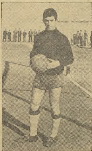
Migueliche resultó lesionado

El partido continuó siendo local, pero no un dominio por juego, sino porque la defensa bolañega era bastante floja y no sujetaba a sus adversarios como debe ser; hacían entradas a lo que salie-