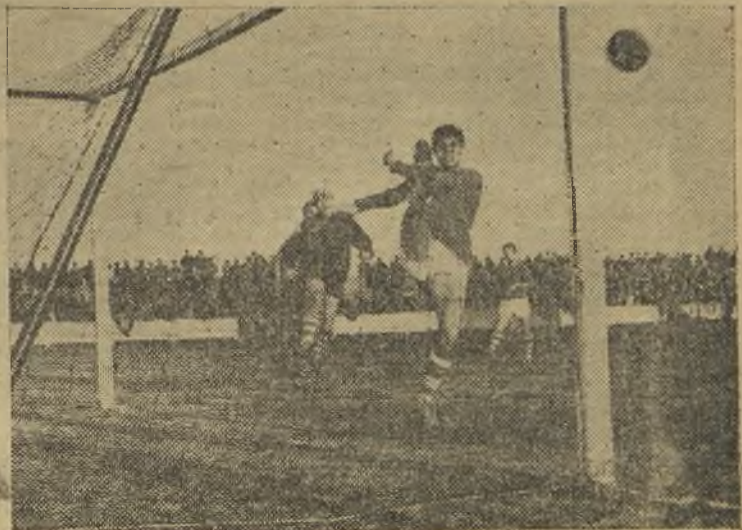
Un "vicegol": Batido el portero cacereño, un defensa salva en la misma raya.