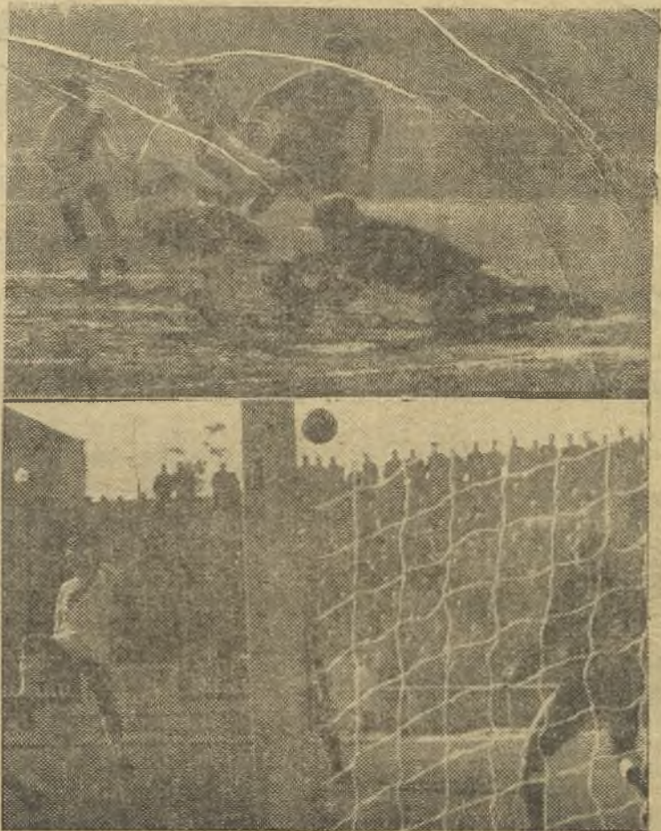
Dos jugadas que pudieron ser el empate: El portero ovetense evita un gol tirándose a los pies de Iznata; abajo, un remate de Moya, que no hizo "diana" por poco. (Foto Balaguer). El Oviedo ganó 0-1 en Vallecas. (Información en tercera página).