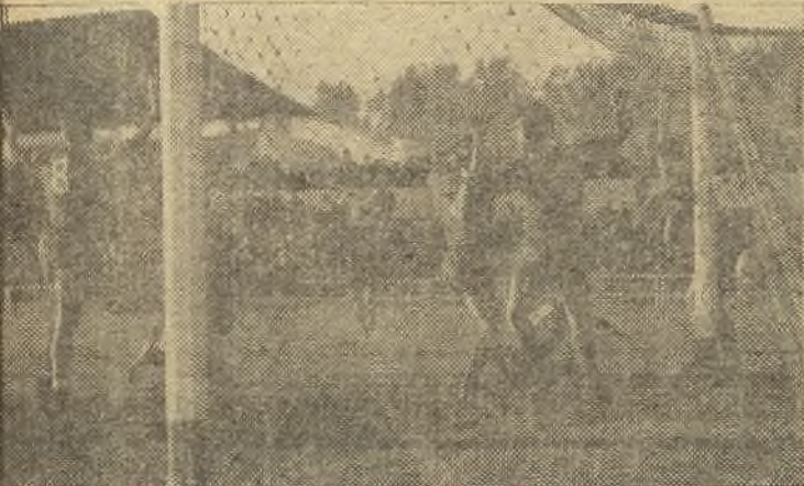
El único gol del partido, pero no valió. Unos y otros hacen señas al árbitro; los de casa para decir que no había offside y, los de fuera, para decir que sí. El Calvo Sotelo-Indauchu terminó con empate a cero. (Información en tercera página)