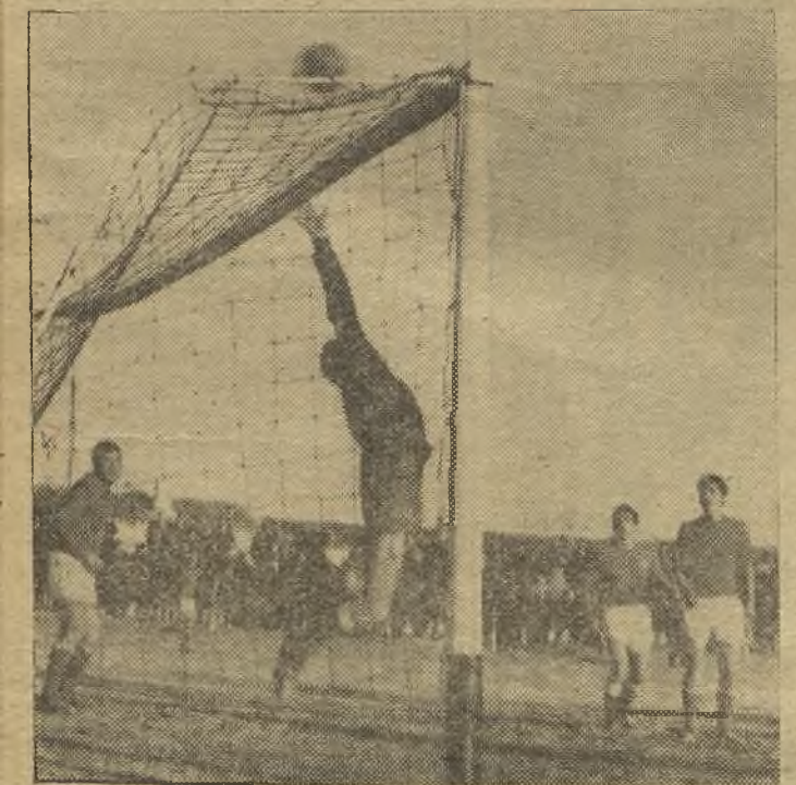
Faltó poco para que este tiro de Alias fuese gol, pero el Alcalá consiguió empatar en Socuellamos. (Foto Carrión). (Información en página trece)