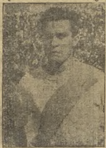
Felines, siempre en buena línea

El encuentro fue dirigido por el señor Saiz, realizando un perfecto arbitraje, con buena visión; igualmente cumplieron