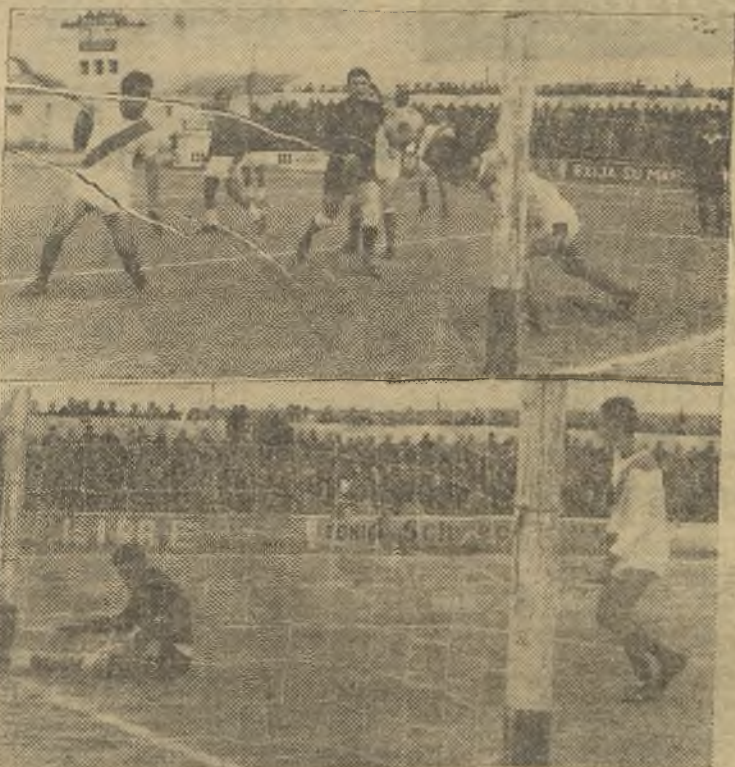
El Manchego anduvo flojote, el domingo. No obstante, el Quintanar pasó algunos apuros, como vemos en las fotos de H. Piña. Arriba, un defensa visitante salva un gol seguro, con la cabeza. Abajo, un balón que dió en el poste y salió fuera. (Información página séptima)