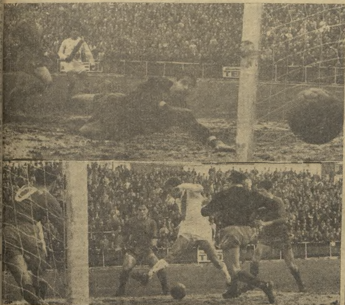
N. acaba de acertar el Ray, en su casa. En las fotos de Balaguer, arriba, vemos un balón que sale lamiento el poste, mientras Chomín, en el suelo, parece que sopla. Abajo, Sánchez Cabezuño, con el portero fuera de su meta, no consigue marcar. (Información en tercera página).