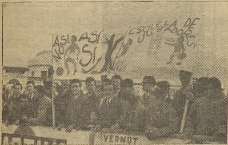
La afición no estaba contenta con su equipo y exhibió pancartas alusivas, como ésta que captó Herrera Piña, en la que se manda, a los locales, a la "escuela" para que "aprendan".

GOLES: El único del partido, lo consiguió Quesada, a los 28 minutos del primer tiempo. Una falta sacada por Amarilla, fue rematada de cabeza y en plancha por el medio mancheguista, llevando el balón a las mallas.