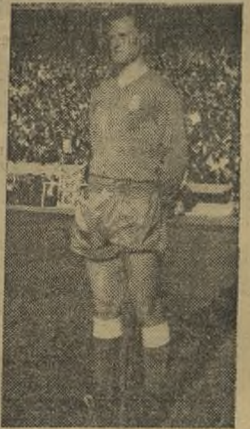
Camargo II, firme en el Pedro Muñoz

El Moscardó ha demostrado ser un equipo de tantos; no hizo mucho honor a la clasificación que ocupa; no es tan fiero el león como lo pintan; abusó de la dureza y, su de-