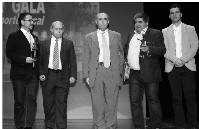
Los hermanos G a Cervigón con su premio Afán de Superación.