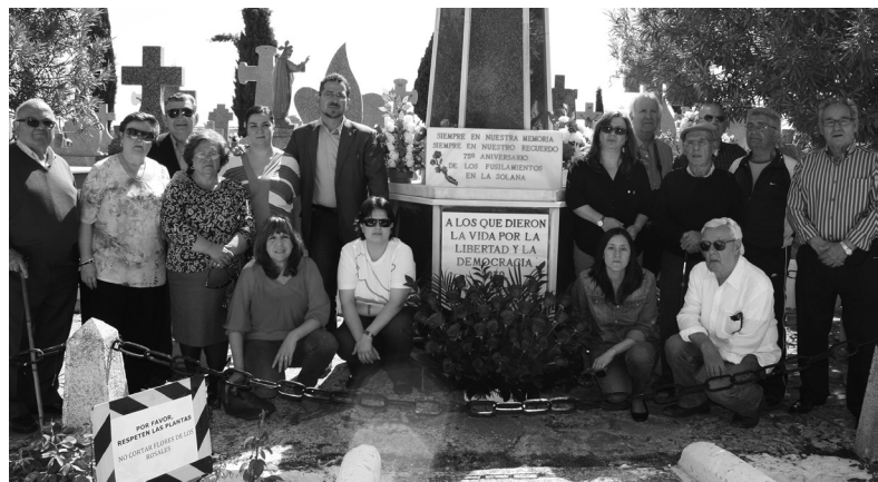
Familiares de fusilados y militantes socialistas.

Los socialistas solaneros también celebraron un concierto-homenaje el 11 de abril en la Casa de Cultura. Actuó el cantautor Paco Damas, junto a