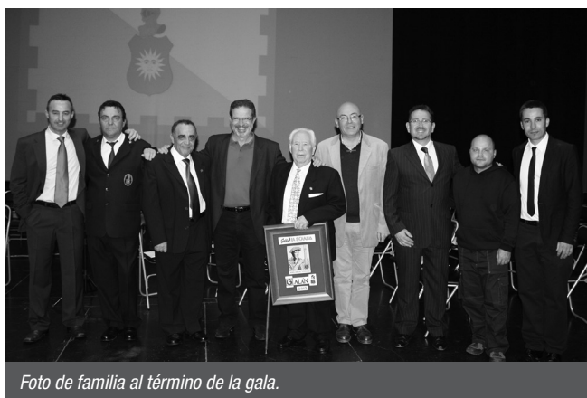
Foto de familia al término de la gala.