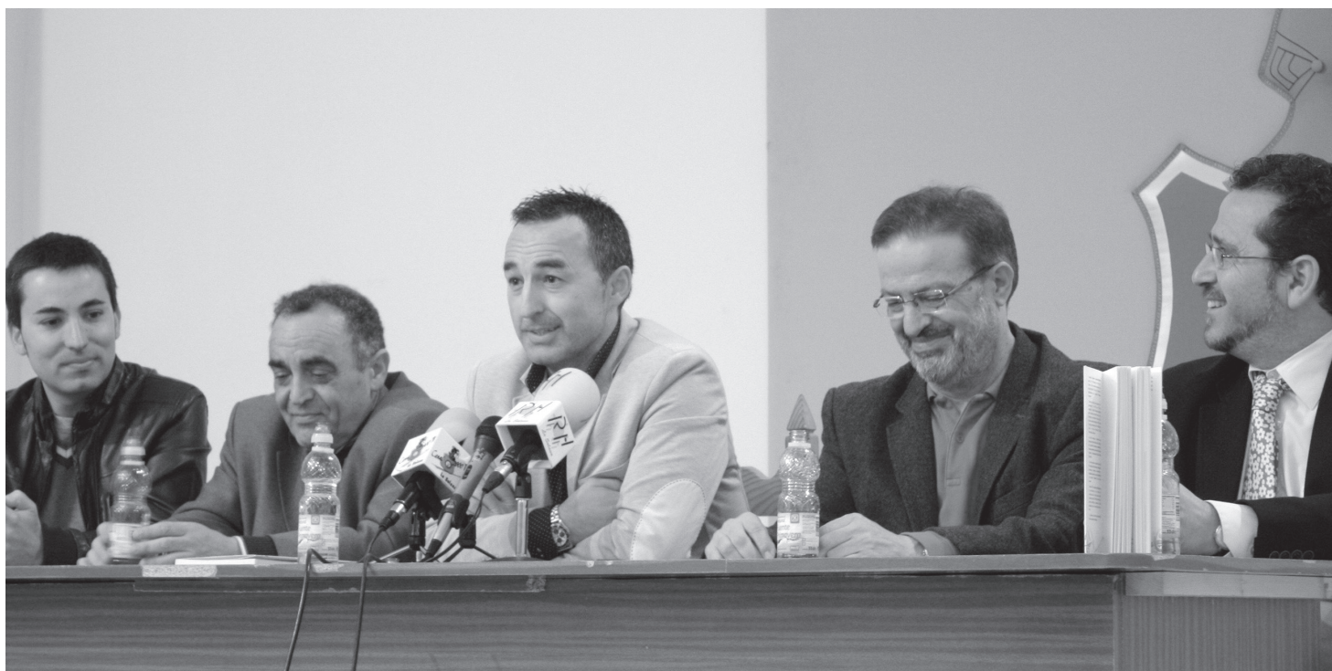
Momento de la presentación del libro La Solana y las hoces .