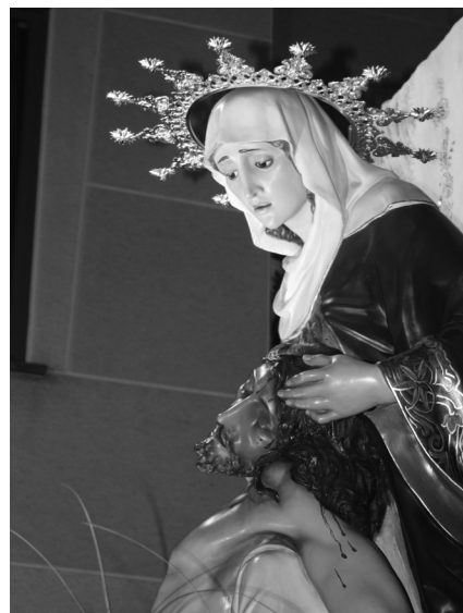
La Virgen de las Angustias con su nueva corona.