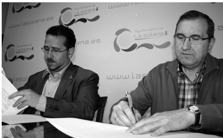
Firma del convenio con Cáritas.