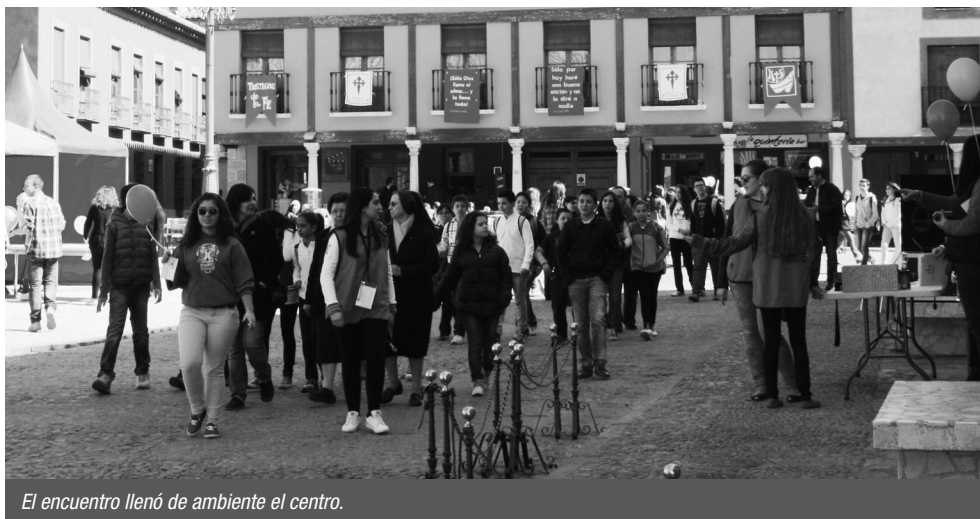
El encuentro llenó de ambiente el centro.