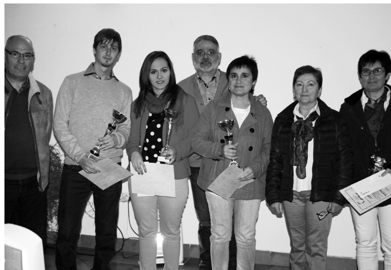
Ganadores del maratón fotográfico de la OMIC.