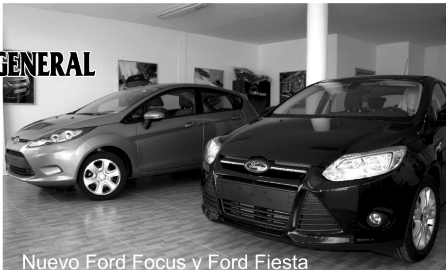
Nuevo Ford Focus y Ford Fiesta

C/ Ebanistas s/n - Nave 3 Pol. Ind. La Serna 13240 LA SOLANA (C. Real) Tel.: 926 63 18 26 Móviles JOSE 630 172 720 DOMINGO 628 267 648