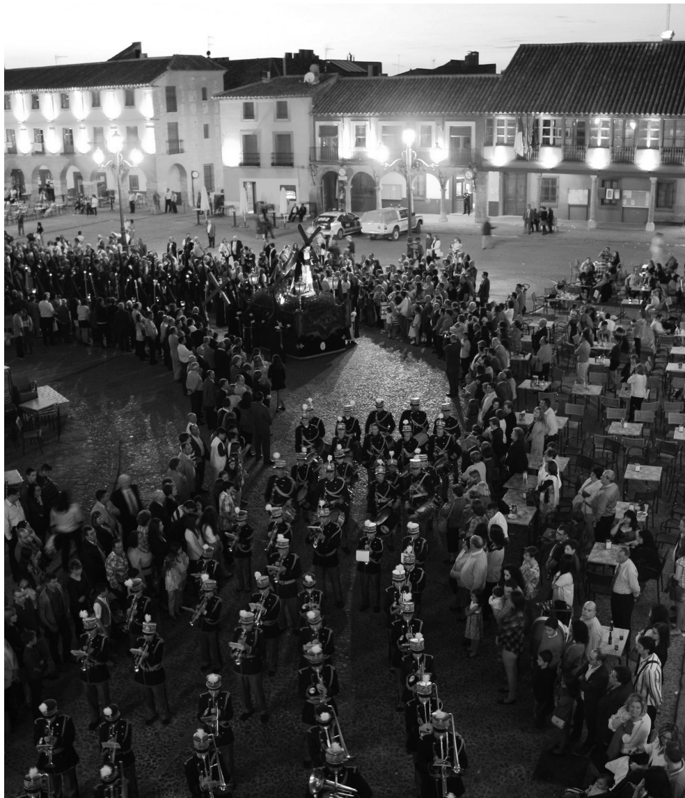
Imagen inédita de la procesión de la Vera Cruz con las terrazas llenas.

L a gente en manga corta, las terrazas de la plaza a tope, los nazarenos sudando... En efecto, la última Semana Santa pasará a la historia como la más calurosa que se recuerda. No exageramos si decimos que en pleno verano hay noches y días bastante más frescos. La realidad es que la imagen que abre esta página, con la procesión de la Vera Cruz en marcha y las terrazas fuera, no es nada habitual. El calor fue, de largo, la noticia destacada de la Pasión-2014.*