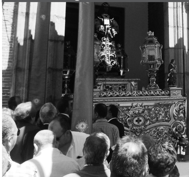
Jesús Rescatado durante el Ofrecimiento.

El tradicional ofrecimiento a Jesús Rescatado, celebrado el domingo 4 de mayo, alcanzó los 13.244 euros, aumentando en 1.218 con relación a lo recaudado en el año anterior. La puja, que se celebró con un tiempo espléndido, concluyó a la una menos veinte de la ma-