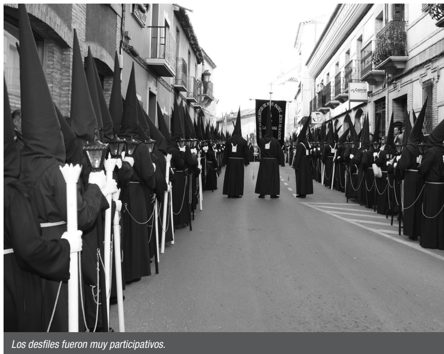
Los desfiles fueron muy participativos.