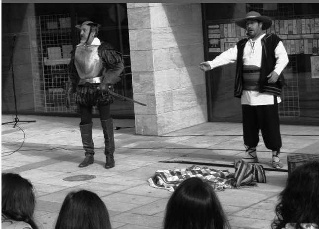
Quijote y Sancho en la biblioteca.