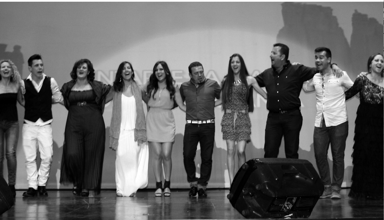
La huella de tu voz todos.