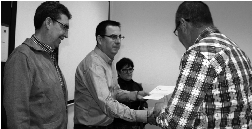
Entrega de diplomas en el curso de programador.