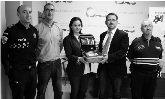
Presentación del proyecto Salvavidas.