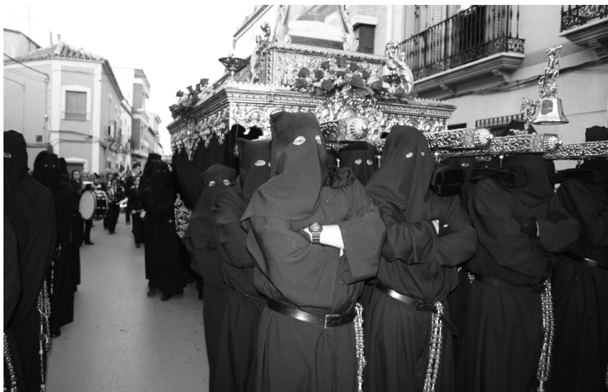
El Sepulcro estrenó faldas.