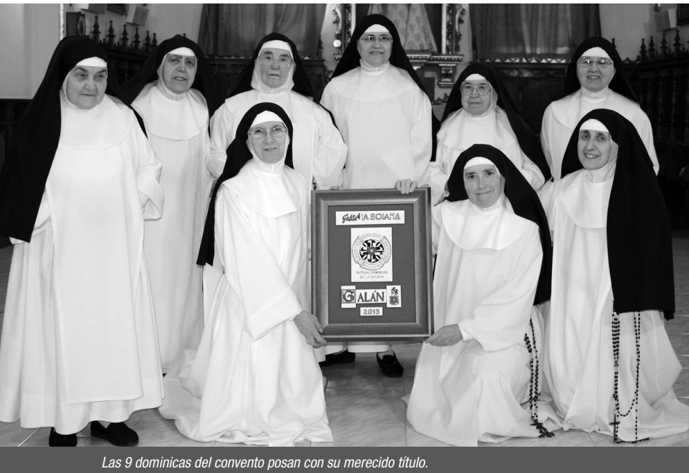
Las 9 dominicas del convento posan con su merecido título.

E l convento de San José de La Solana fue fundado en el año 1593 por el solanero Juan Díaz de Sabina. Las monjas contemplativas de la Orden de Predicadores (popularmente