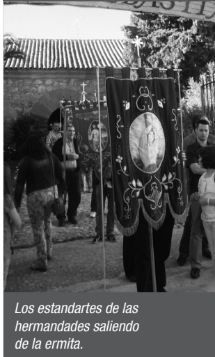
Los estandartes de las hermandades saliendo de la ermita.