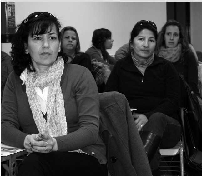
Promueve V alumnos.

ditación profesional para trabajar con discapacitados o dependientes. Tal es el gran objetivo del programa Promueve V, cofinanciado por la institución provincial junto al Fondo Social Europeo.*