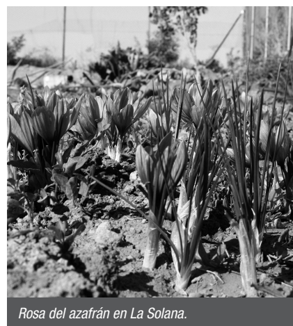
Rosa del azafrán en La Solana.