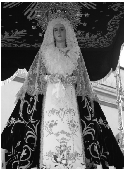
La Soledad del convento con su nuevo mandilillo.

Las hermandades de Pasión terminaron plenamente satisfechas por el resultado general de esta Semana Santa, y ya piensan en la próxima. GACETA adelanta cuáles son los objetivos para el año que viene, si se puede, o para los siguientes.