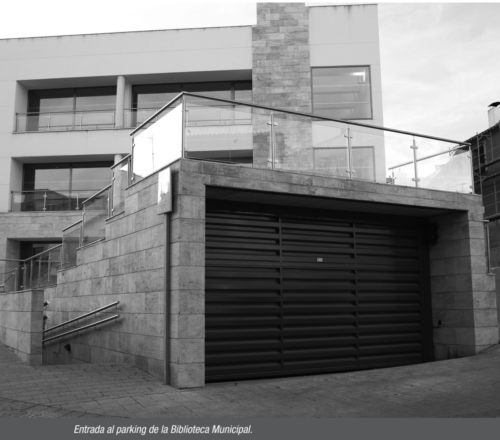
Entrada al parking de la Biblioteca Municipal.