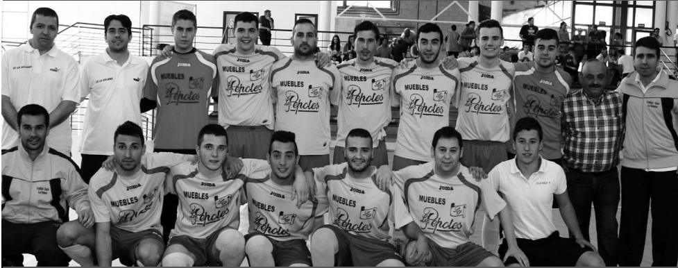
FS La Solana 2013-2014.