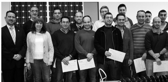
Alumnos del curso de instalaciones solares.