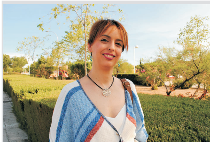
Fernández pide más apoyo político y social a la investigación científica.

asegura. Este año impartió un taller para los de infantil de cuatro y cinco años en el colegio Jaime de Foxá, donde “estaba mi hijo, sonríe, y todos disfrutamos mucho”.