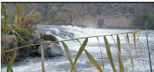
El río Tajo a su paso por Toledo.