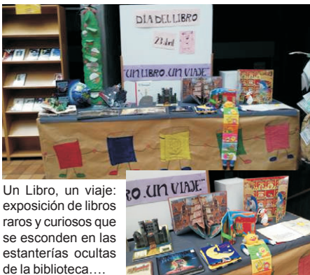
Un Libro, un viaje: exposición de libros raros y curiosos que se esconden en las estanterías ocultas de la biblioteca....