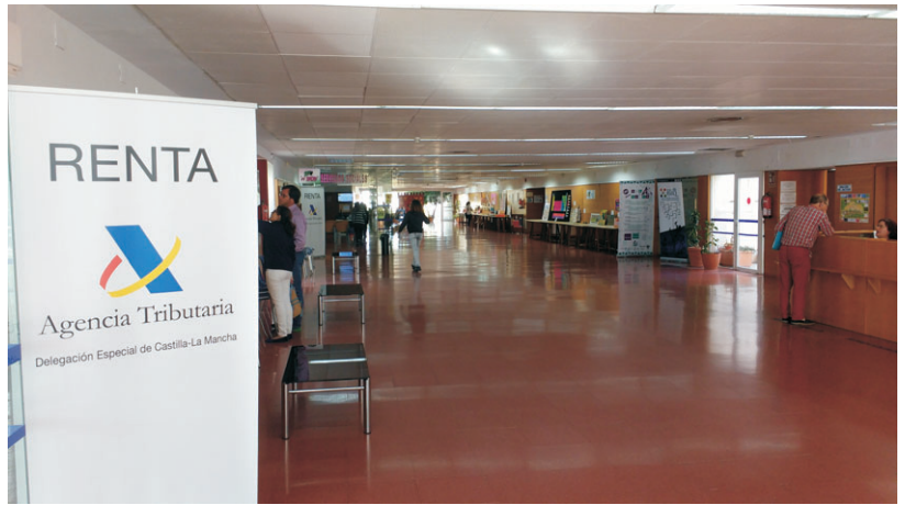
Hall del Centro Social.

Para terminar, debemos aclarar que de forma cotidiana, las diferentes estancias del Centro Social están saturadas de so-