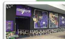
REBAJADO LOCAL/PUB-100 M2 CALLE RÍO FUENTEBRADA 129.900 €