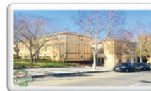
3DORMITORIOS-70 M2 CALLE RÍO VENTALOMAR 69.900 €