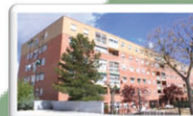
3DORMITORIOS-110 M2 CALLE RÍO FRESNEDOSO 128.900 €