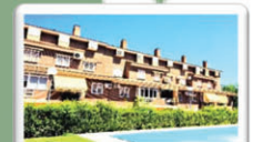
REBAJADO 4DORMITORIOS-285 M2 CALLE RÍO YEDRA 209.900 €