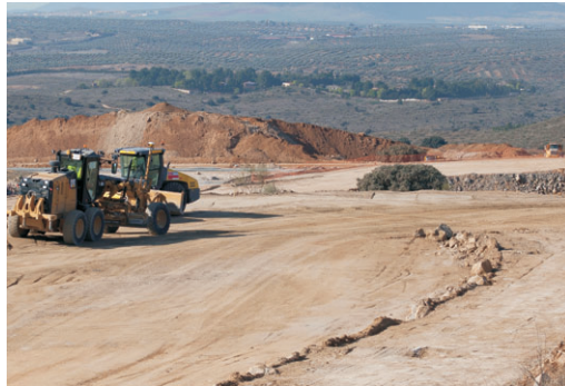
Obras de Puy du Fou.

La batalla judicial contra los desmanes de la Junta y del PSI Puy du Fou sigue adelante. Puede ocurrir como con la aprobación del Plan de Ordenación Municipal de 2007, que diez años más tarde de su aprobación el Tribunal Constitucional declaró nulo el proceso por haberse incumplido la