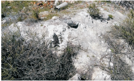
Uno de los focos de vertidos de amianto en el barrio, foto archivo.

Puede parecer un atrevimiento, pero no resisto a plasmarlo en este escrito “me gustaría ver a muchos de los políticos en nuestra situación”. Todos los ve-