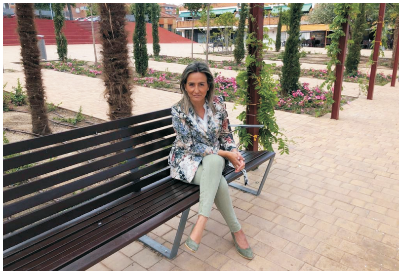
Milagros Tolón, alcaldesa y candidata socialista.

Nota de redacción: Al contrario que el resto, la entrevista con Milagros Tolón no se ha realizado de forma presencial, porque su equipo ha alegado falta de tiempo. Por lo tanto, se trata de un cuestionario respondido por escrito, sin posibilidad de repreguntar a la candidata, como nos hubiera gustado. Hemos aceptado su publicación en beneficio del derecho a la información de nuestras lectoras y lectores, aunque no es la mejor fórmula para asegurar ese derecho.