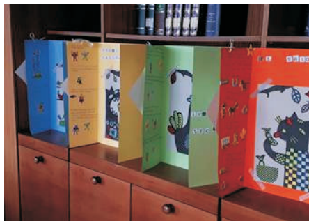
Murales realizados por los niños que participaron en el taller creativo de lectoescritura Sonando Cuentos .