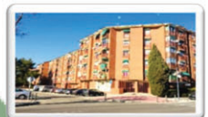
3DORMITORIOS-90 M2 PLAZA POETA MIGUEL HERNÁNDEZ 69.900 €