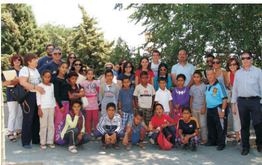
Niños saharauis en Toledo en años anteriores.

Difundir y sensibilizar a la población civil española del conflicto del Sáhara Occidental, antigua colonia española invadida ilegalmente en 1975 por Marruecos. En un proceso de descolonización inconcluso en el que España, sigue siendo la potencia administradora del territorio, a pesar de las resoluciones de la ONU y la legalidad internacional reconociendo el derecho del pueblo saharauí a la celebración de un referéndum de autodeterminación. A día de hoy, después de más de cuarenta años, este pueblo sigue