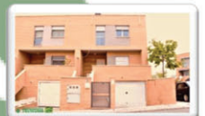
4DORMITORIOS- 160 M2 VÍA TARPEYA 152.900 €