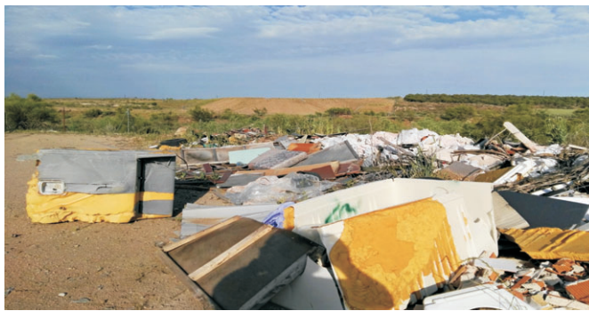
Escombrera junto al Ramabujas, aún sin limpiar.