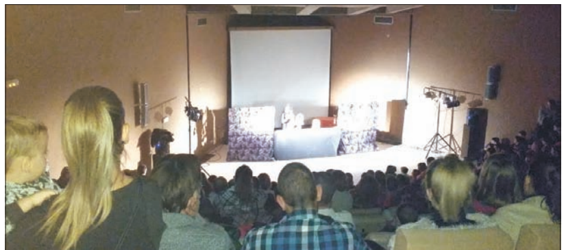
El salón de la biblioteca se quedó pequeño para acoger a todo el público.