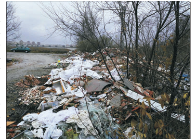
La basura se acumula junto al barrio.

competentes en esta materia, Ayuntamiento y Junta —con sus agentes medioambientales—, que se pongan manos a la obra y trabajen conjuntamente en dos frentes: limpieza de todos los focos de basura y control para que no vuelva a producirse esta imagen.