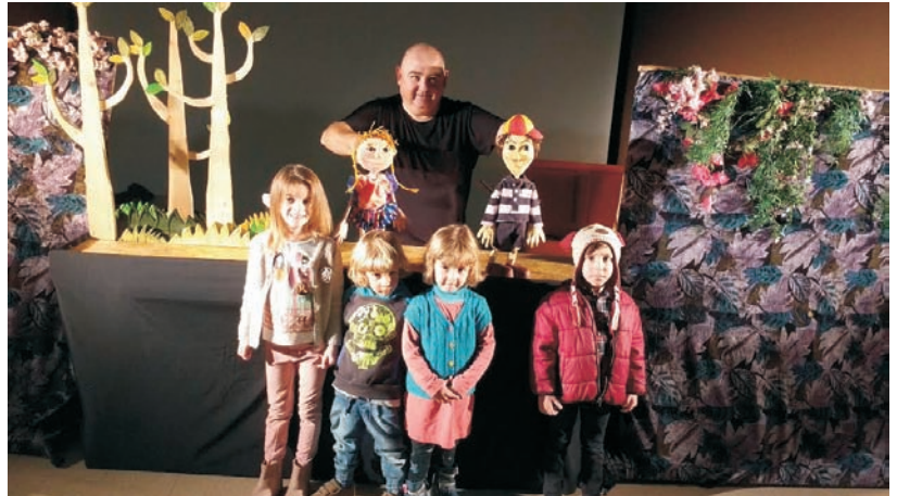
Los niños y niñas disfrutaron al final de la sesión posando con las marionetas.

Foto de uno de los 4 talleres infantiles impartido por el centro multidisciplinar «Más que palabras»