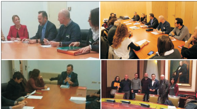
Reunión con los grupos parlamentarios del PP, PSOE, Unidos-Podemos y Ciudadanos.

La coordinadora nacional de plataformas en defensa del derecho a renovar las ayudas de vivienda protegida, de la que forma parte nuestra asociación de vecinos, ha vuelto a reunirse con los responsables de estos grupos parlamentarios una vez constituidas las nuevas Cortes y el nuevo gobierno. Su intención es seguir con más entrevistas en busca de una solución definitiva. Asimismo, se dirigirá a todas las direcciones generales de vivienda de las respectivas Comunidades Autónomas, entre ellas la de Castilla-La Mancha.