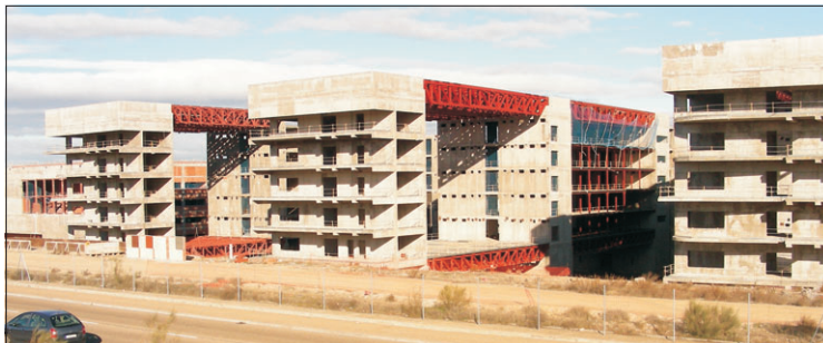
Estado actual de las obras del hospital desde Vía Tarpeya.

cuando en realidad no podían comenzar porque carecían de la necesaria licencia municipal. Ahora tendremos que esperar varios meses más hasta que realmente se reanuden las obras del hospital, que tendrá difícil estar funcionando a mediados de 2018.