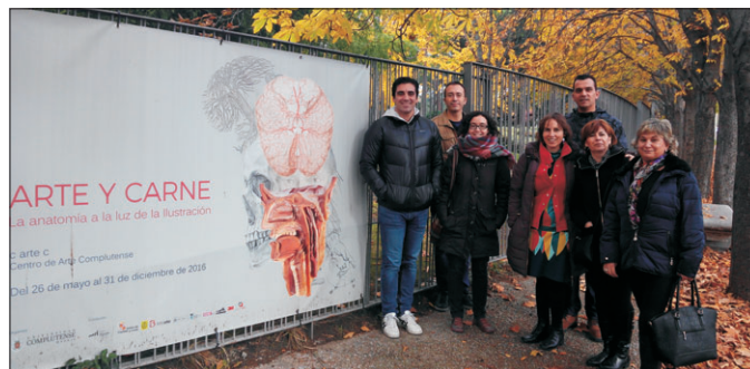
Alumnos y profesores de CEPA Polígono en exposición "Arte y Carne"

Más información: http://cepa-poligono.centros.castillalamancha.es http://arteycarne.ucm.es/