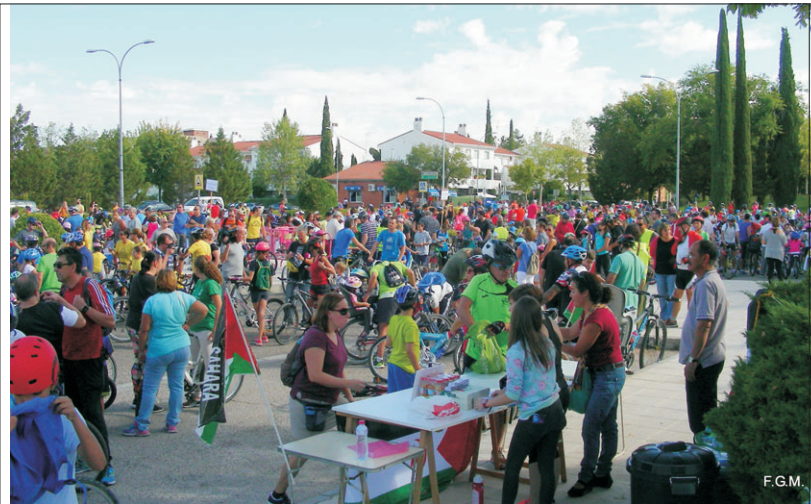
Día de la Bicicleta, Carnaval Infantil y Pedestre Popular, eventos populares del barrio.

A la vuelta del verano nos enteramos de que una calle de nuestro barrio, Alberche, ostentaba el fatídico récord de ser la vía con más accidentes de la