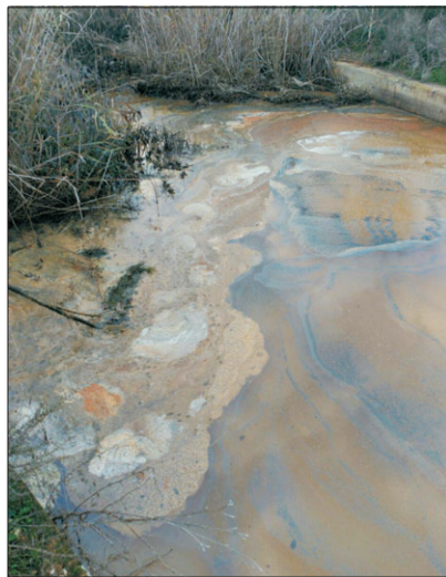
Uno de los muchos vertidos incontrolados.

¿Y qué son las espumas del río? Son un reflejo de la grave contaminación que acumula el Tajo a lo largo de su curso, en el que va sufriendo numerosas agresiones en forma de vertidos que, todas juntas, están "matando" al río. Y las hay de todos los colores políticos, porque no se salva ninguna administración. Sirvan estas fotos cedidas por la Plataforma de Toledo en defensa del Tajo como denuncia de algunos vertidos junto a nuestro barrio. ¡Basta ya!