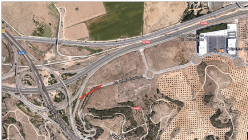
Acceso directo de la bajada de las Nieves a centro comercial, una de las propuestas.