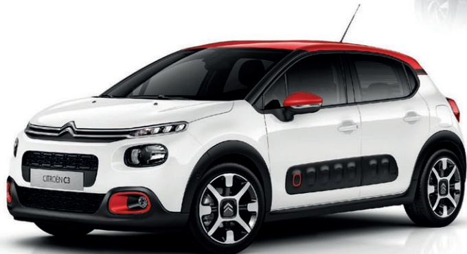
NUEVO CITROËN C3