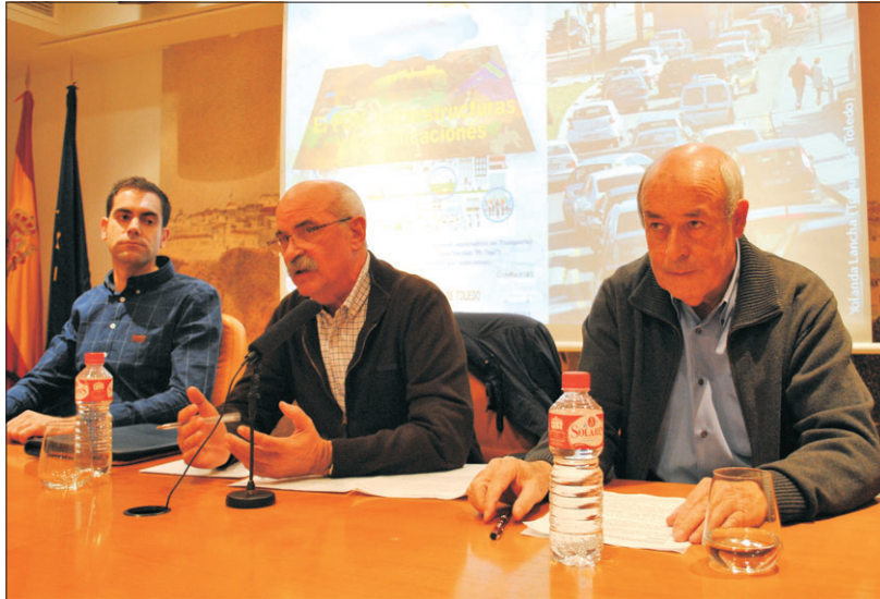
Mesa para el debate sobre el POM y accesibilidad al nuevo hospital.

El segundo error fue la construcción de los centros comerciales junto al hospital, sumando los flujos de tráfico rodado de ambas instalaciones. A esto hay que añadir la circulación generada por la zona residencial e industrial y los centros públicos y tecnológicos, lo que puede convertir el acceso al barrio en un grave problema si no se toman antes las medidas imprescindibles para conseguir la fluidez de todo el tráfico que deberá absorber el barrio tras la inauguración del centro hospitalario.