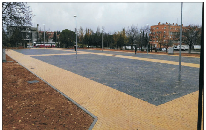
El convenio Junta de Comunidades - Ayuntamiento nos trajo la glorieta de Valdeyernos con Estenilla y la remodelación de la plaza de las fiestas.