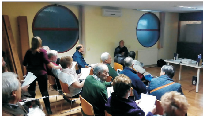
Encuentro en el Centro de Mayores.

El miércoles 30 de noviembre la asociación celebró una reunión en el Centro de Mayores del barrio, dentro de los encuentros que estamos llevando a cabo con las diferentes asociaciones y entidades del barrio para informarles del problema de salud derivados de los vertidos de amianto. Nuestro objetivo es dar a conocer y concienciar del problema, tan importante, que tenemos en el barrio, en particular, y en la ciudad, en general, con los vertidos contaminantes de amianto, que a día de hoy suponen un total de 90.000 toneladas.