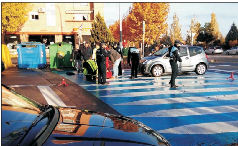
En días pasados se produjo un nuevo accidente en la calle Alberche junto a río Uso.

Nos parece bien las diferentes obras de mejora en el barrio, pero nos desconcierta que después de anunciar tanta apertura y transparencia no podamos debatir e intercambiar ideas y propuestas en un área municipal tan sensible como éste. Nuestra intención es estudiar qué medidas podrían aplicarse e incluirse en los presupuestos municipales, para que después no puedan decirnos que no se pueden ejecutar por