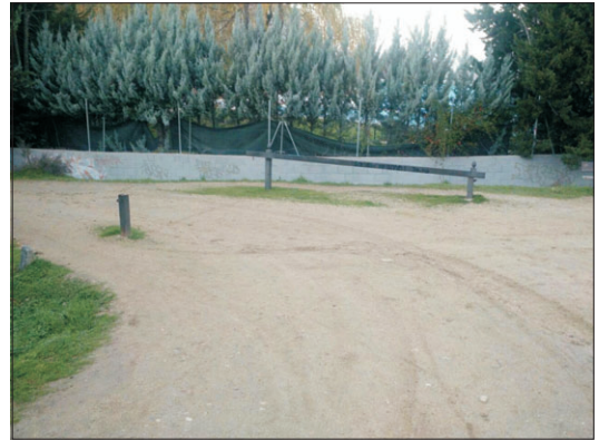
Nada impide que se cuele los vehículos a motor.

También hemos recibido quejas relacionadas con la caza, ya que en ocasiones ésta se produce demasia-