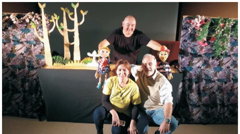
También algunos mayores les gustó posar.