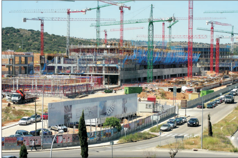
Esperamos que muy pronto vuelva la actividad al futuro hospital.

Pero ni por esas. También hablamos de viviendas sociales, seguridad vial, Plan de Ordenación Municipal, Participación o pobreza energética.