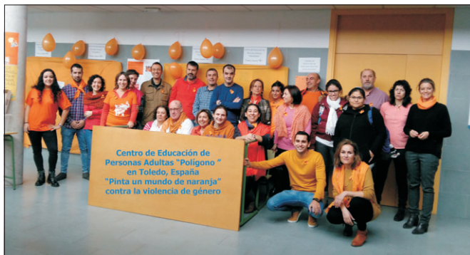
Alumnos y profesores de CEPA "Polígono" de naranja en apoyo contra la violencia de género.

Durante el pasado 2 de diciembre de 2016, "Pintamos el mundo de naranja" en el CEPA Polígono, en apoyo a una iniciativa de la Organización de Naciones Unidas para lograr un cambio contra la violencia de género.