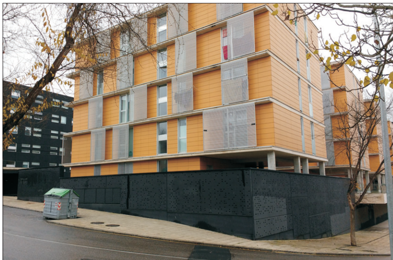
La asociación defiende un convenio entre Junta y Ayuntamiento para las viviendas de alquiler propiedad de la administración.

El periódico de este mes celebró un entrañable cumpleaños: Llegábamos a las 300 portadas de Vecinos , tras 34 años de cita con nuestros lectores y siendo testigos directos del progreso del