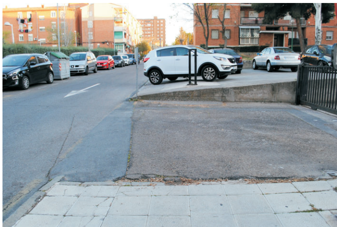
La Asociación de Vecinos pide que se construyan aceras en las calles Cascajoso y Espinarejo, en el entorno del colegio Jaime de Foxá.

neal; acondicionamiento de la entrada al Centro Social; creación de una plaza para minusválidos y arreglos de los accesos al recinto ferial; mejora de la zona ajardinada en la calle Estenilla y la creación de accesos a la zona de rodadura en los aparcamientos de las tiendas G.