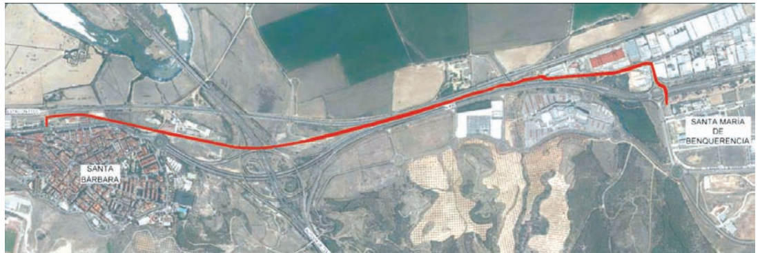
Trazado del carril bici propuesto por el ayuntamiento.

Pero con todo, consideramos que esa zona del carril bici debe complementarse con un paso elevado por encima de la N-400 como publicamos en nuestro periódico de febrero. Además, ya se está convirtiendo en "una demanda histórica", si bien debe ser más funcional y mucho más económico que el ya construido.