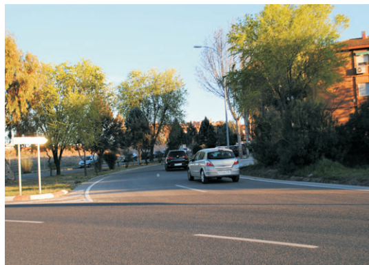
En esta entrada al barrio falta señalización.

Este pasotismo es un insulto a nuestros derechos adquiridos por pagar los recibos del ayuntamiento que llegan todos los