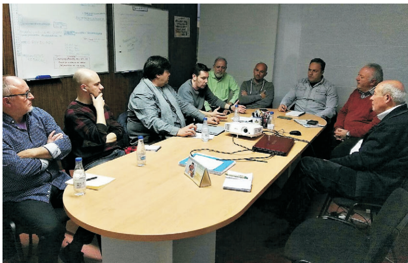
La Asociación se reunió con los sindicatos.

Por ello, los sindicatos y la asociación consideran urgente que se aborde un nuevo diseño de movilidad de la ciudad con la máxima participación posible, que contemple tanto nuevas