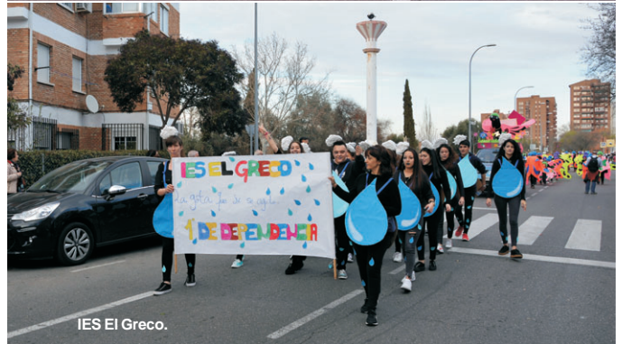
IES El Greco.