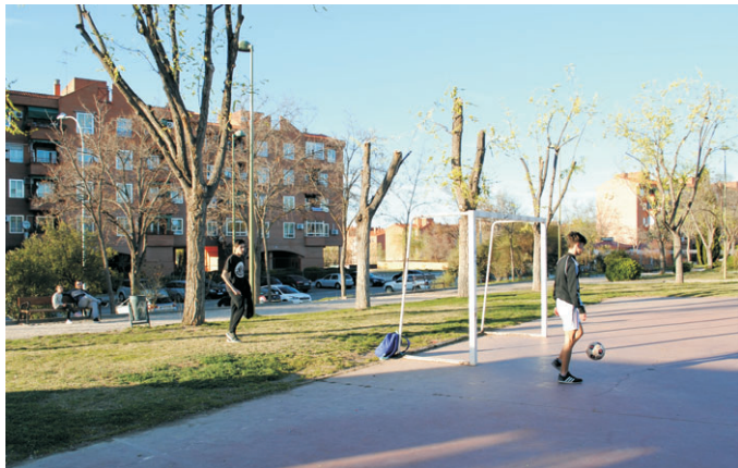
Es necesario reponer la valla para que los balones no caigan al aparcamiento.