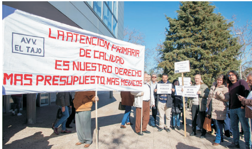
Profesionales y usuarios volvieron a protestar delante del Centro de Salud.

Igualmente, comentamos que la asociación se niega dar como