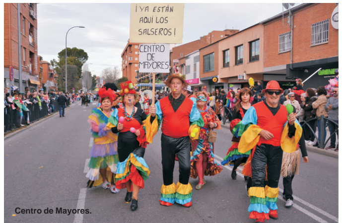
Centro de Mayores.