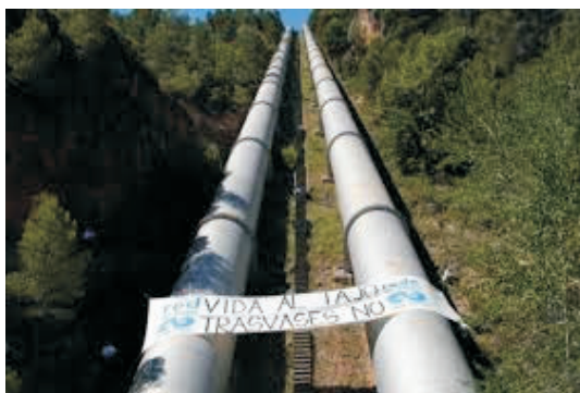
Los trasvases al Levante siguen sangrando al Tajo.