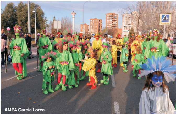
AMPA García Lorca.