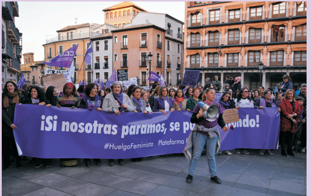
Cerca de 10.000 personas salieron a la calle en Toledo.

► Hoy en día, el 8 de marzo es un día señalado que está tomando más fuerza que nunca. La sociedad española está empezando a ser consciente de la necesidad de conseguir la igualdad. La manifestación de 2018 batió todos los récords de años anteriores. Era un día que llegaba con muchas expectativas. La voz del feminismo el año pasado se escuchó en todo el planeta, pero existían algunos miedos. ¿Sería igual que el año anterior? ¿Las personas ya no saldrían a la calle? ¿Aumentaría el número de manifestantes?