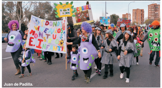
Juan de Padilla.