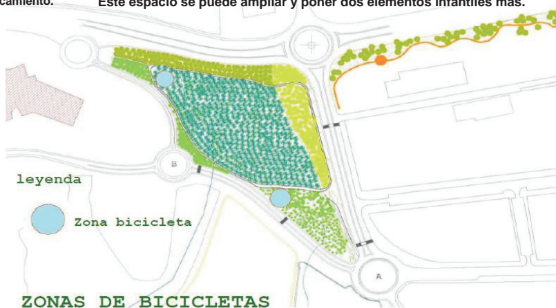
El triángulo de la M 1-1, debe adaptarse para uso vecinal.

Entre las propuestas están la mejora de un parque infantil y poner una valla de retención de balones para evitar un peligro la-