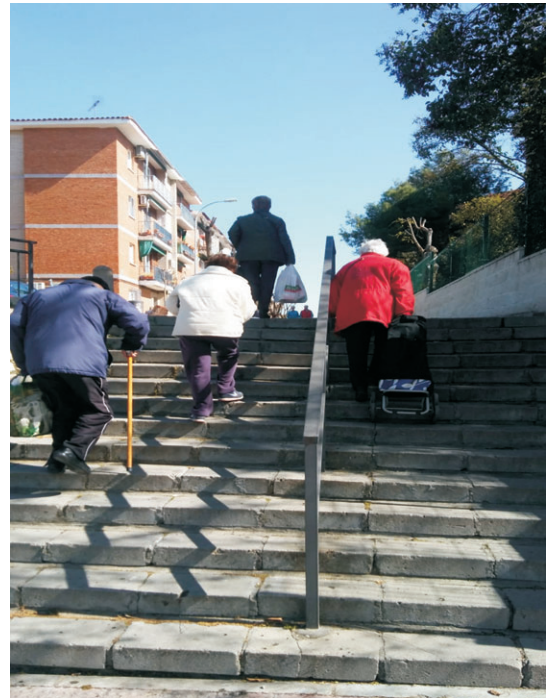
La rampa sigue sin ejecutarse.