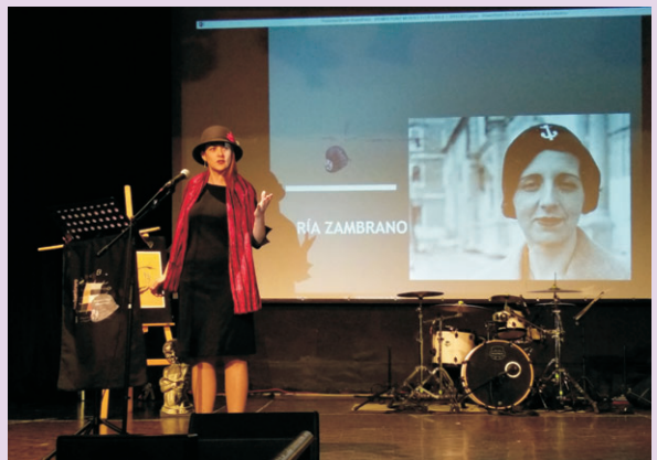
María Zambrano estuvo presente en el 8M del Polígono.

Se trata de un Proyecto de Centro cuyo objetivo no es otro que visibilizar a personas de diferentes ámbitos del saber, del arte y de la ciencia que, por diferentes circunstancias, han estado ocultas. Se pretende que tengan esa voz que no tuvieron a través de monólogos originales.