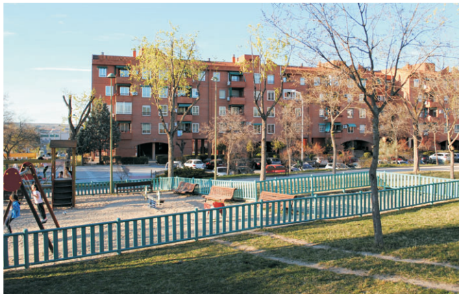
Este espacio se puede ampliar y poner dos elementos infantiles más.

La Concejalía de Participación puso en marcha los Presupuestos Participativos con cargo a los presupuestos municipales de 2019, que contemplan una dotación de 800.000 euros para los cinco distritos de la ciudad y 160.000 para cada uno de ellos. En este sentido, se trata de un importante retroceso, ya que el año pasado el montante total de los Presupuestos Participativos fue de 1 millón de euros.