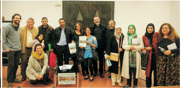
El barrio acogió un encuentro de diferentes cultos religiosos, convocados por IntermediAcción.