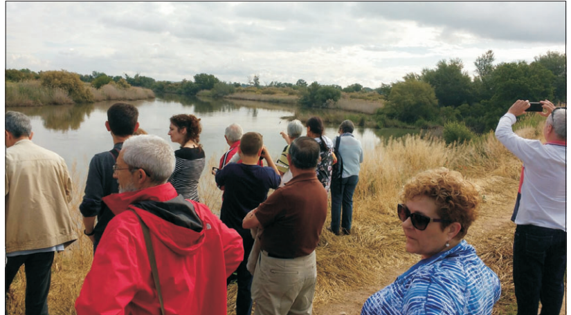
La contaminación invade el río Tajo por debajo de Aranjuez.