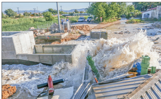
Rotura en el canal del trasvase.

No es la primera vez que se produce una rotura en los tubos del trasvase. De hecho las fugas de agua, en alguno de los tramos como el que ayer vertió miles de litros, suelen ser más o menos constantes. El agua se pierde por algunas de las juntas y los regantes acusan al gobierno central del escaso mantenimiento que tiene esta infraestructura vital para el riego de la huerta alicantina y murciana. El trasvase también abastece a la provincia de Almería. En total son entre 40.000 y 50.000 las hectáreas que riega el agua proveniente del río Tajo en todo el Levante español.