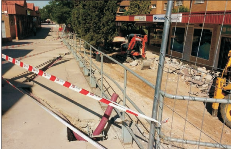
Imagen tomada el 7 de junio.

Además, el proyecto de 2009 registró cambios continuos en la calidad y los materiales elegidos