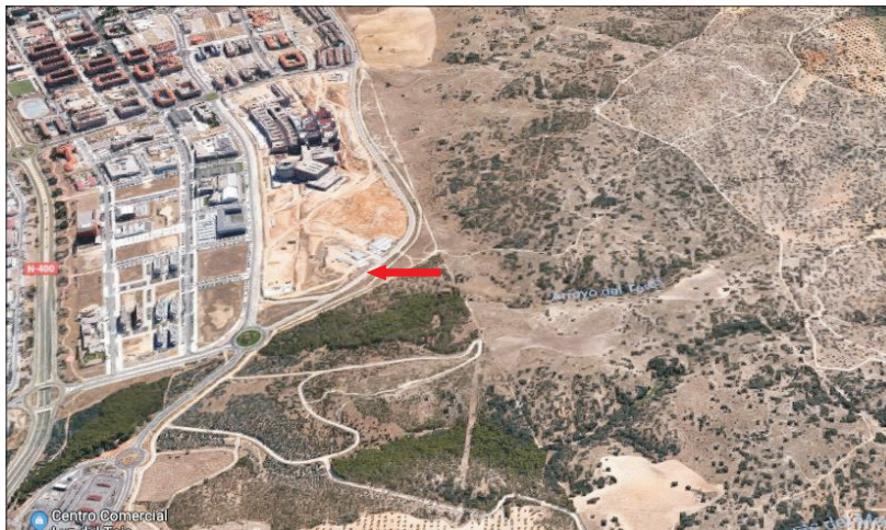
Zona aproximada donde se proyecta la llegada del nuevo trazado.

Merino ha asegurado que se trata de una "empresa de ingeniería importante en España", que hacía tiempo que no trabajaba con la Junta, pero que tiene presencia en la región, como es el caso del contrato del Ministe-