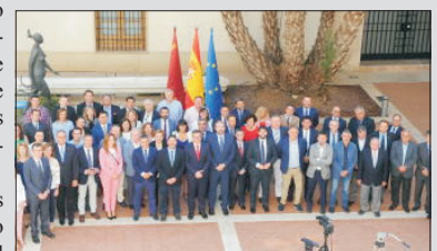
Pacto Murcia.

El documento defiende como irrenunciable el Trasvase Tajo-Segura; apoya nuevas conexiones dentro de las propias cuencas y entre ellas; el freno a los nuevos regadíos, y el aumento de la desalación, como complemento a los trasvases, entre otras cuestiones.