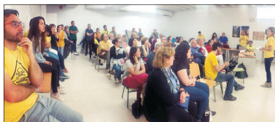
Niños y jóvenes siguieron con atención las exposiciones.

institutos nos abrieron sus aulas para informar y concienciar a l@s alumn@/s sobre alguno de los "delitos medioambientales" que sufre el barrio y la ciudad de Toledo.