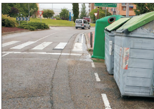
Siguen sin corregirse obstáculos en los pasos de peatones.

para reforzar la seguridad en Cascajos, en el paso que usan muchos escolares más abajo de la entrada al colegio de educación infantil.