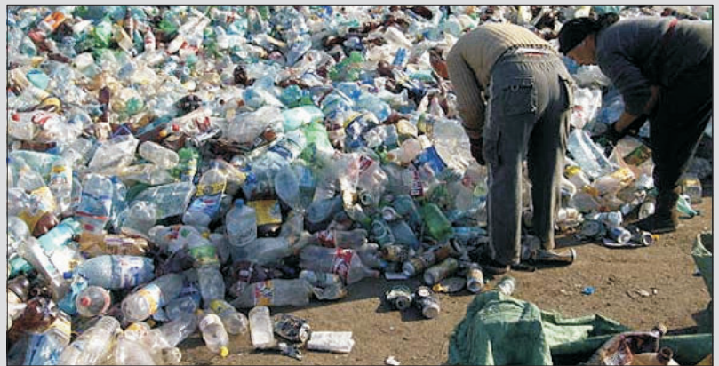
Es urgente cambiar los hábitos de consumo.

La valorización: aprovechar energéticamente los residuos que