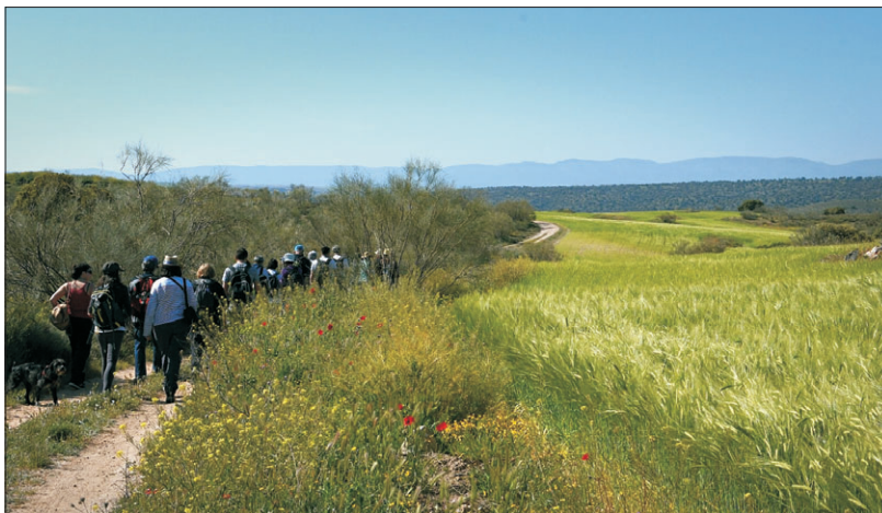
Visita a la finca de Zurraquín.