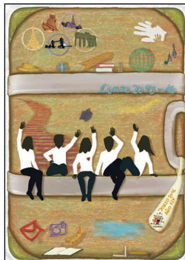
Carmen Bueno Iglesias. BC2

Esperamos ilusionados por seguir ayudando a los más necesitados e indefensos de nuestro entorno más cercano o de otras lejanas latitudes con nuestra amplia oferta de actividades solidarias ( este curso hemos aportado 1.000 euros a Ayuda en Acción apadrinando cuatro niños y a otras ONG's en colaboración puntual, 1.100 euros