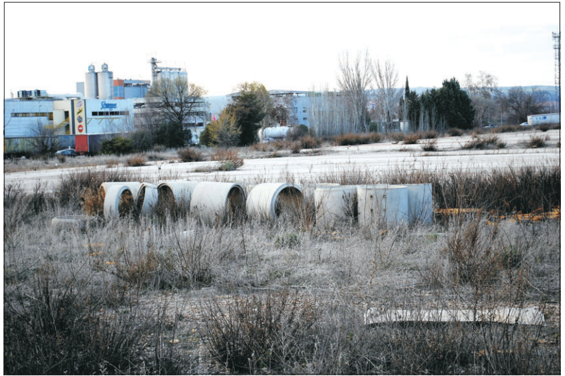
Tubos de fibrocemento con amianto en la parcela de Ibertubo.