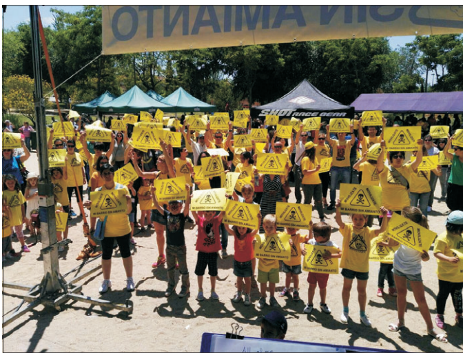
El amarillo de rechazo al amianto lució durante todo el día.