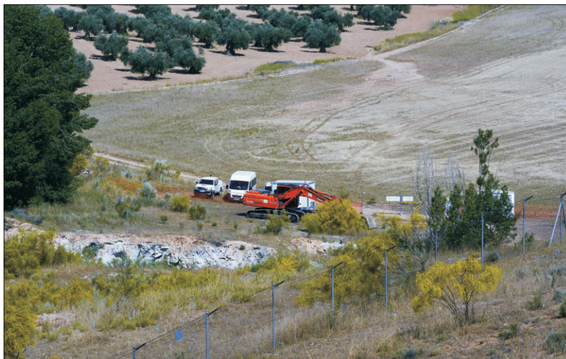
La CHT trabaja en la zona del Ramabujas.

Por otra parte, la Confederación Hidrográfica no está diciendo la verdad, y oculta deliberadamente qué empresas está desarrollando estas labores, tanto de descontaminación, como de transporte. Tampoco ha informado dónde va a depositar los res-