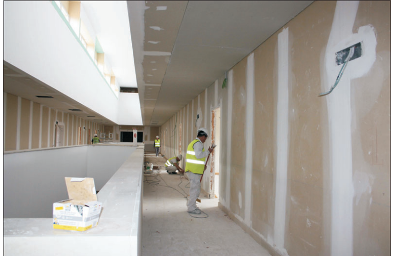
Foto de la Junta en la que aparece un operario trabajando en el hospital.

Aún no se ha pintado el paso de peatones de la peatonal Manuel Machado sobre la calle Valdeyernos, sigue el peligro latente, así desde hace dos años, entendemos que los pequeños y no tan pequeños detalles deben cuidarse, y en conjunto es lo que hace agradable el barrio, y el conjunto de la ciudad.