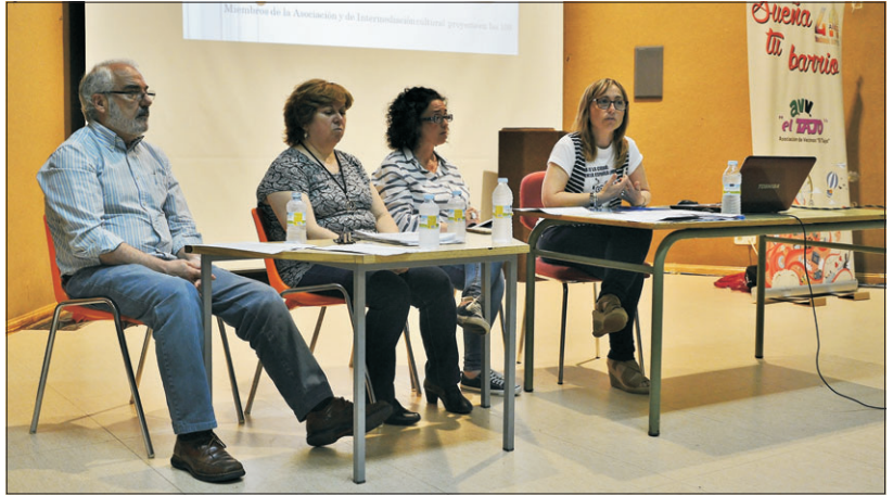
La asamblea se celebró en la biblioteca del barrio.

Nuestra asociación nació para reivindicar los servicios públicos cuando el barrio acababa de nacer y carecía de ellos, y con el esfuerzo de muchas personas, se alcanzó un nivel muy aceptable en diferentes servicios: sanitarios, educativos, deportivos y sociales. Con la actual crisis todo ha sufrido un parón e, incluso, un retroceso con motivo de las diferentes políticas de recortes a las que estamos asistiendo en estos últimos años. En la primavera del 2013, la asociación comenzó una profunda renovación y reactivó su compromiso permanente con el barrio, consiguiendo la incorporación de gente joven con ganas de involucrarse en los problemas de su barrio y de su ciudad, de forma voluntaria y convencida de que el bien comunitario repercute en el bien personal.