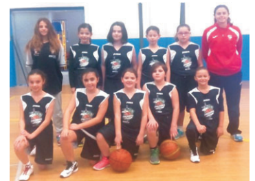
ALEVÍN FEMENINO "B".