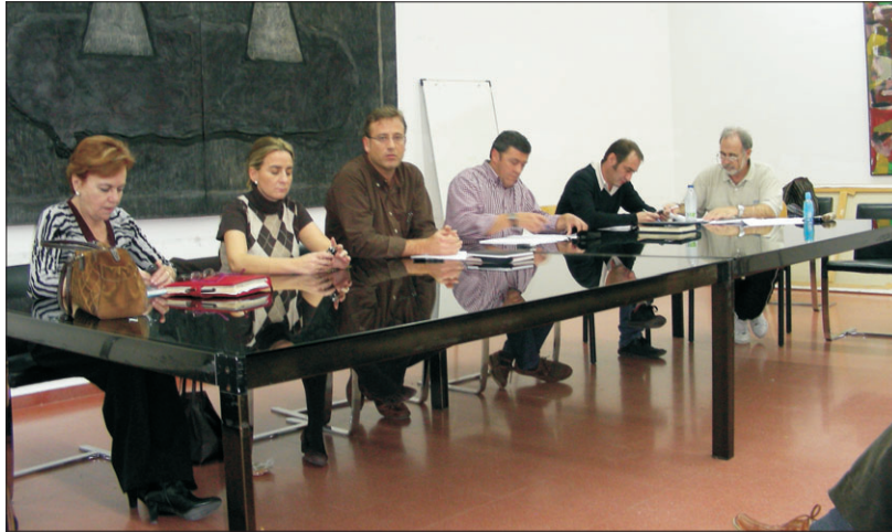
Foto archivo de un pleno de la Junta Municipal de Distrito.

Este nuevo reglamento contiene algunos avances, como la participación de un vocal por