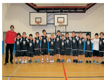
ALEVÍN MACULINO "B".