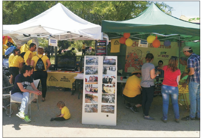
Numerosas personas acudieron a las carpas informativas.