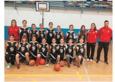
ALEVÍN FEMENINO "A".