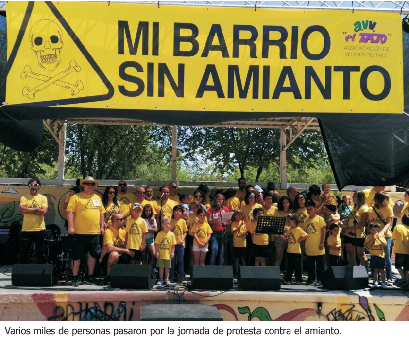
Varios miles de personas pasaron por la jornada de protesta contra el amianto.

El vecindario del Polígono respondió con fuerza e ilusión a la jornada de protesta contra el amianto organizada por la plataforma ciudadana Mi barrio sin amianto y nuestra asociación, que se celebró el 4 de junio en el parque de los Alcázares. Varios miles de personas, portando las ya emblemáticas camisetas amarillas de la plataforma, hicieron patente su indignación por el riesgo contra su salud que suponen los vertidos de amianto a la puerta de su casa. Queremos agradecer su compromiso a todas las personas que se implicaron en que fuera un éxito, especialmente a la participación desinteresada de los grupos Álvaro Gómez, Trifolka, Niteflite, Lujamen Brother y Humo Sapiens. Por otra parte, la Confederación Hidrográfica del Tajo está limpiando una parte mínima de amianto vertido en el arroyo de Ramabujas, sin explicar dónde y cómo va a trasladar los restos. La presencia de operarios con trajes especiales de seguridad nos refuerza en nuestros argumentos de que el amianto es muy peligroso para la salud y puede producir cáncer y otras dolencias graves. En el editorial, enviamos una carta desesperada e indignada al presidente regional, Emiliano García-Page, al que lanzamos un SOS para que nos ayude. Páginas 12 y 13. Editorial en página 3.