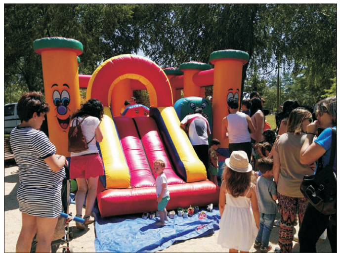
Juegos infantiles para la infancia.