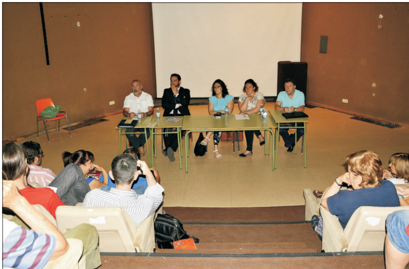
Asesores jurídicos, peritos judiciales y miembros de la asociación informaron.

Les adelantamos que la conclusión final fue tajante: ahora más que nunca hay que informarse primero y reclamar después a las entidades financieras que impusieron dicha cláusula en nuestras hipotecas. Pero, además, ahora que sabemos que las entidades ofrecen pactos y acuerdos a sus clientes, resulta imprescindible estar suficientemente asesorado, ya que, en la mayoría de los casos, los pactos que ofrecen a los perjudicados por la cláusula suelo, esconden nuevas trampas que resultan imperceptibles para un usuario confiado.