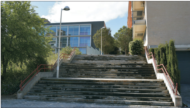
Un lugar sin rampa en una obra relativamente reciente.

“Quiero decir con esto, agrega, que todo lo que se haga en pro de la accesibilidad vaya bien dirigido por las personas adecuadas, que las hay y que ahí las tenemos. Estamos a años luz en estas cuestiones. Leyes nos sobran en documentos firmados, andamos sobrados. Y concluye poniendo de manifiesto que “necesitamos tan sólo hacer uso del personal adecuado, y, os puedo asegurar, que hay grandes profesionales deseando ejecutar estudios”.