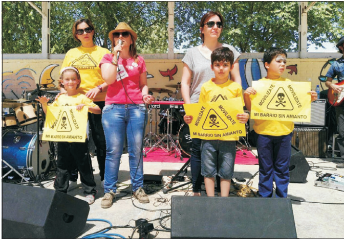
La asociación y la plataforma trabajaron juntas durante la jornada.

al vecindario a secundar las movilizaciones y eventos que seguirán organizando hasta que se cumpla el objetivo, que no es otro que vivir en un barrio con tolerancia cero al amianto. En esta lucha no sobra nadie, porque unidos somos más fuertes.