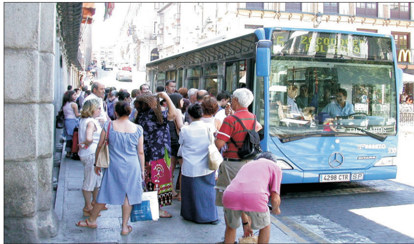
La ciudadanía se juega mucho con el nuevo pliego del servicio de autobuses.

Es verdad que el nuevo pliego rebaja costes, pero únicamente reduciendo autobuses en la