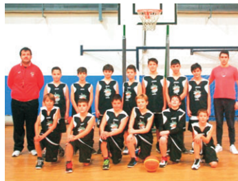
ALEVÍN MASCULINO "A".