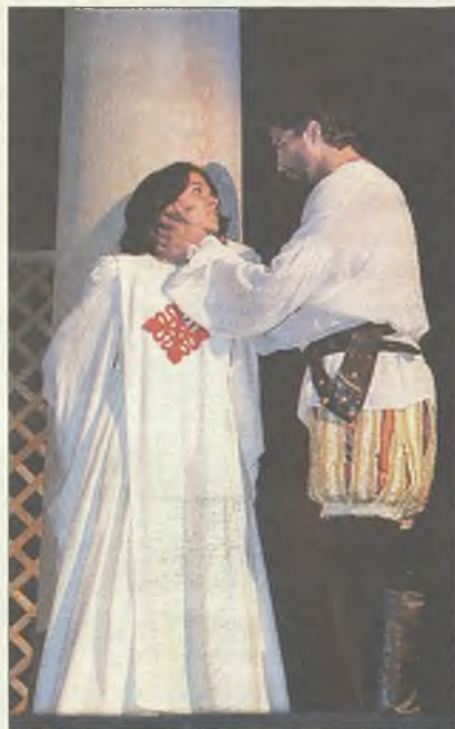
Imagen de archivo del Tenorio

Y eso que este año no ha contado con la subvención por parte de la Junta de Comunidades (de hecho, la asociación