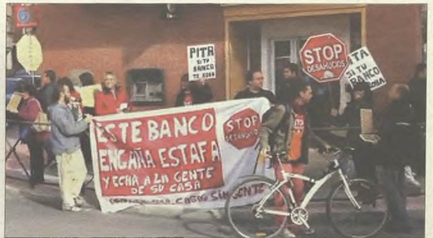
Momento del encierro protagonizado por la PAH en Azuqueca

reunión con la dirección de Bankia duró tres horas. "Para negociar con una pobre personita como yo acudieron el director de la sucursal, la subdirectora, el