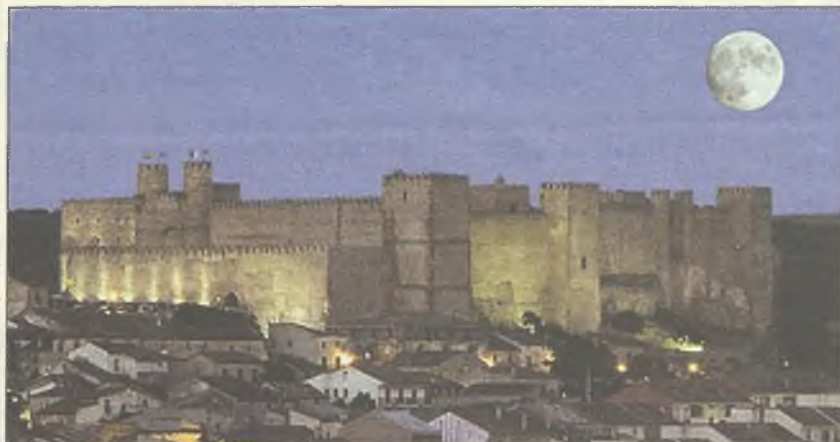
Una imagen del Parador de Sigüenza