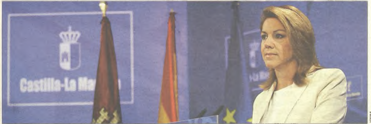
Cospedal espera ahorrar 1,2 millones de euros con la eliminación de los sueldos de los diputados regionales

Fue el pasado 30 de octubre cuando la presidenta de Castilla-La Mancha, María Dolores de Cospedal, se mostró segura en un 99 por ciento de que Castilla-La Mancha cumplirá el ob-