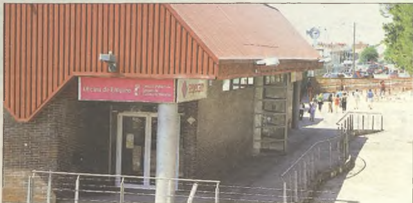
Imagen de las instalaciones del Sepecam en Guadalajara