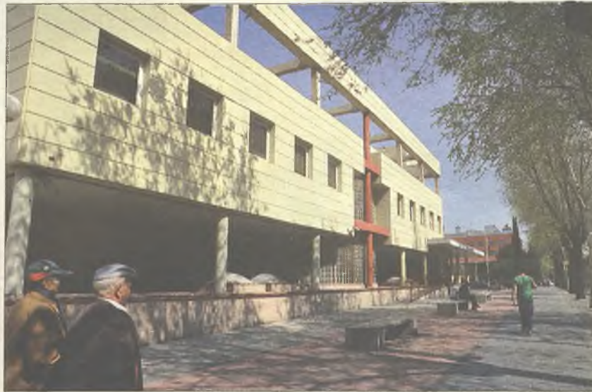
Imagen de la comisaría de Policía Nacional de Guadalajara