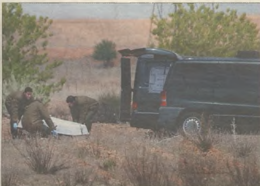
FALLECIERON EN EL ACTO. Las víctimas son un instructor y un alumno en prácticas

"Me paró el autobús en esta misma parada, en la carretera de Meco, venía a