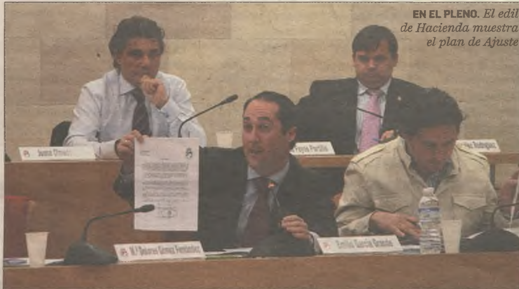
EN EL PLENO. El edil de Hacienda muestra el plan de Ajuste

"La situación me parece patética, patética por la actitud de la oposición. Nosotros no habríamos vuelto a traer este plan al pleno de no ser porque