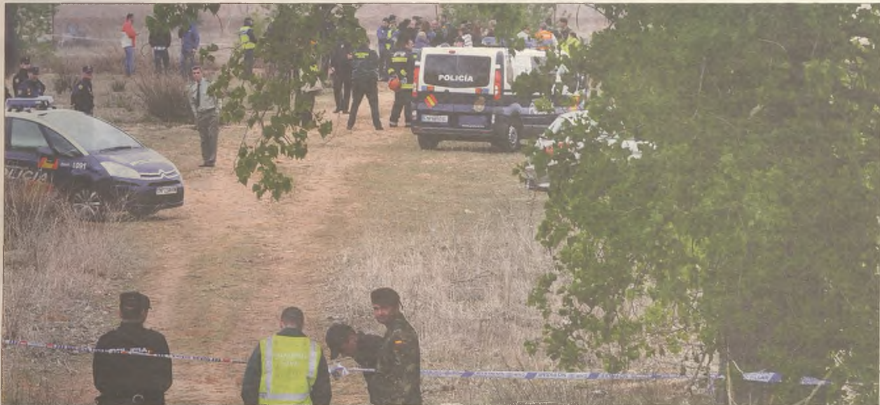
ACCIDENTE AÉREO. La aeronave, un avión biplaza utilizado para la instrucción, se estrelló en la mañana del jueves junto a la entrada a las cárceles de la M-121

DEL 27 DE ABRIL AL 3 DE MAYO DE 2012 www.dhenares.es