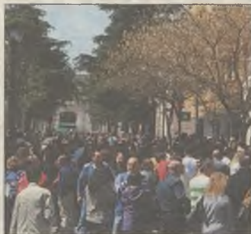
AYTO. SAN FERNANDO