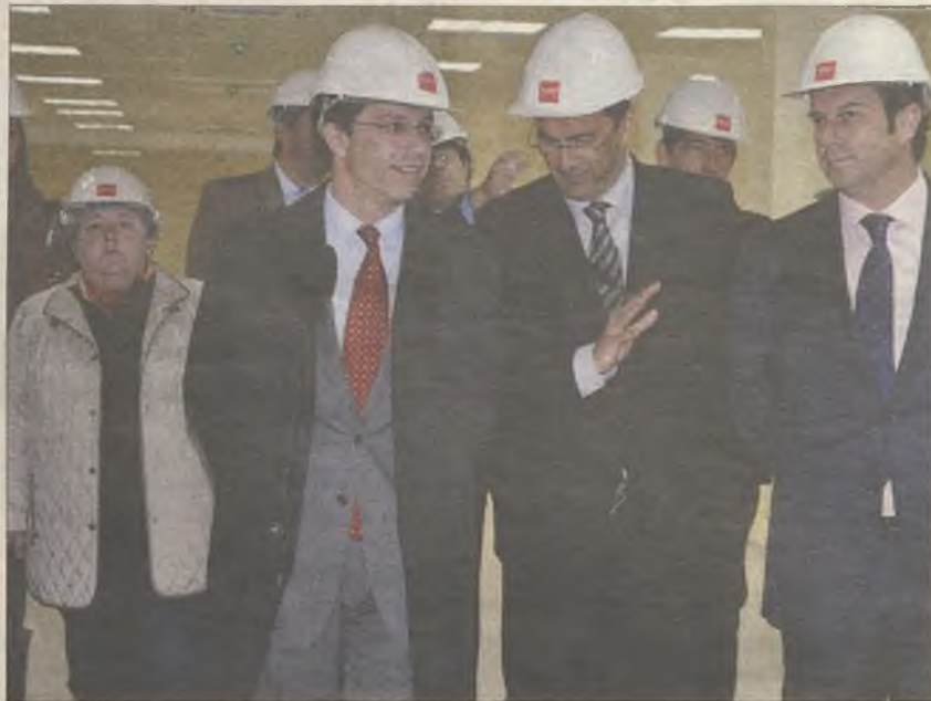
OBRAS. El consejero junto con el alcalde de Torrejón durante la visita al centro

Otra de las incorporaciones importantes es la Unidad de Salud mental y el Hospital de Día Psiquiátrico que se ubicará "en la tercera planta de