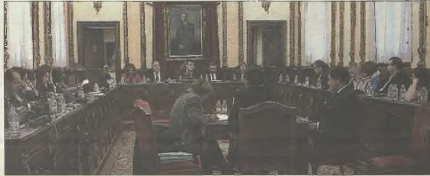
Imagen de archivo de uno de los plenos del Ayuntamiento de Guadalajara