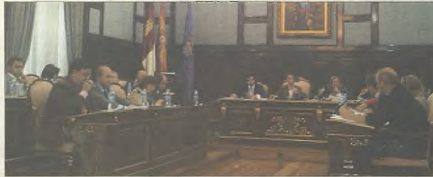
Imagen de archivo de uno de los plenos de la Diputación de Guadalajara

La hegemonía popular también dio al traste con las mociones presentadas