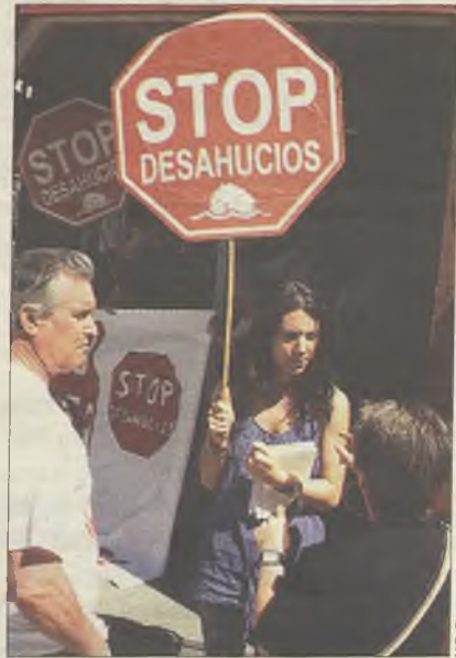
Una de las protestas de la PAH