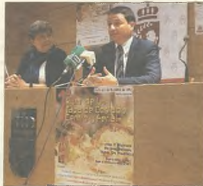
TAPAS. La presentación de la ruta

Sólo le hace falta dos euros para degustar una caña (el patrocinador en este caso es Cruzcampo) y una tapa, o