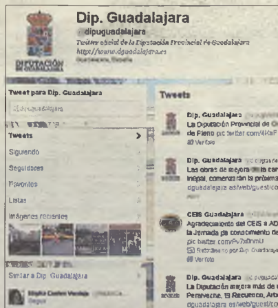
Perfil de la antigua cuenta de Twitter