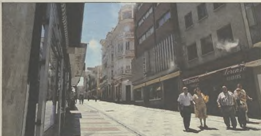
IBI. PP y PSOE ofrecen un baile de cifras sobre el incremento del IBI en 2013

PP y PSOE no se ponen de acuerdo sobre la subida que experimentará el Impuesto de Bienes Inmuebles (IBI) de cara al próximo año. Mientras el PSOE cifra esta subida en un 8% de media, el PP lo sitúa entre un 2,5 y un 3%, aproximadamente el IPC. ¿Te ha llegado ya la contribución? Déjanos tus mensajes a través del Facebook o www.dhenares.es