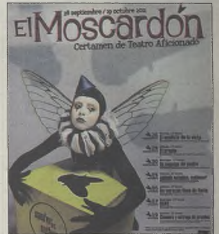
TEATRO. El cartel de la muestra

Los ganadores se conocerán el 19 de octubre en una gala marcada por la actuación de los jóvenes discapacitados del grupo de teatro Astor de Torrejón que pondrán en escena Sonríe .