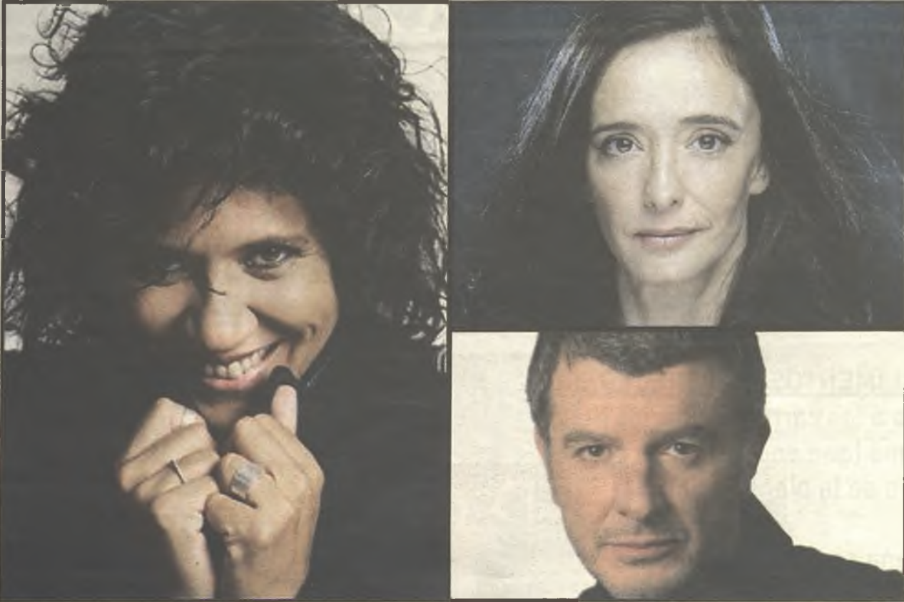
PROGRAMACIÓN CULTURAL. Más de una veintena de actuaciones culturales tendrán lugar en el Buero Vallejo

Danza, ópera, teatro para niños... El Teatro Auditorio Buero Vallejo ya tiene lista toda la programación cultural de cara a este otoño. Entre los platos fuertes, la cantante Rosana, los actores Ana Torrent, Jesús Cisneros o Yolanda Arístegui. ¿Qué te parece el plantel de los próximos meses? ¿Qué te parece la nueva política de precios? Entra y participa en www.dhenares.es .