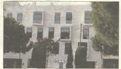
Edificio Marlasca en Guadalajara

cisco Javier Ortega agradeció la acogida recibida. La multinacional McDonald's se encuentra inmersa en un proceso de expansión en España. En los dos próximos años tiene previsto abrir 66 restaurantes.