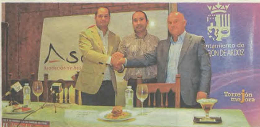
LA IV MUESTRA DE COCINA SE CELEBRA DEL 1 AL 7 DE OCTUBRE