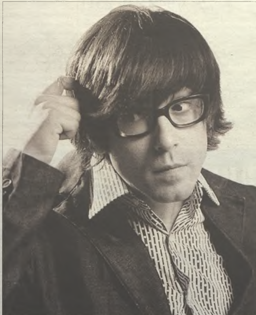
Luis Piedrahita triunfó el pasado sábado en el Teatro Buero Vallejo

Humorista, guionista, ilusionista... Piedrahita vale su peso en oro. Por E.P.