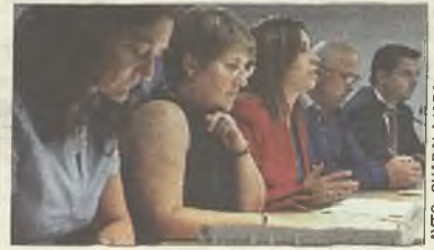
Presentación de las ferias

Opina sobre la noticia en... www.dhenares.es