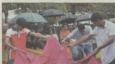
Exhibición de la Escuela Taurina

Los alumnos de la Escuela Taurina de Guadalajara realizaron una exhibición de toreo de salón, el pasado domingo por la tarde, en la madrileña Plaza de Santa Ana. Un acto enmarcado dentro de la programación del Día de la Casa de Guadalajara en Madrid que, sin duda alguna, supone un paso más para la promoción de nuestra tierra y la divulgación de la tauromaquia. La jornada sirvió para dar a conocer la labor que realiza dicha Escuela en la capital española y decenas de personas disfrutaron de una jornada amena y cargada de maestría.