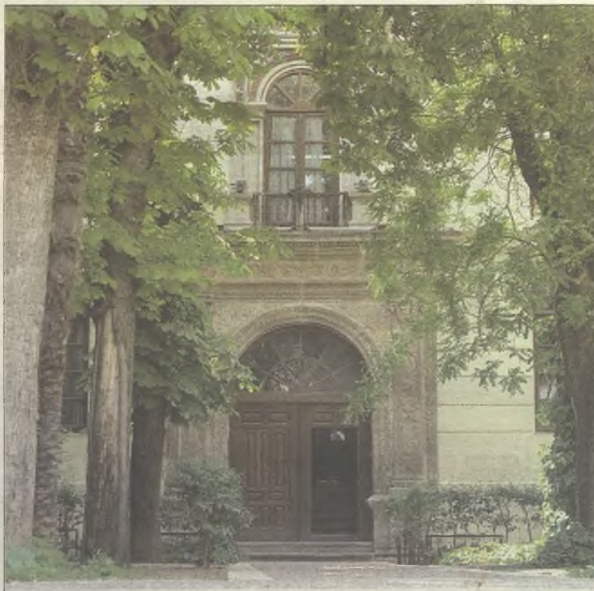
Convento de La Piedad de Guadalajara

Y ya fuera del casco histórico, no se puede perder El Velero en la plaza del Capitán Boixareu Rivera, 122, teléfono 949 22 00 15 y el Bar El Otero , en la calle de Zaragoza, 23 teléfono 949-23-00-42. Y en todos ellos, les deseo buen provecho.