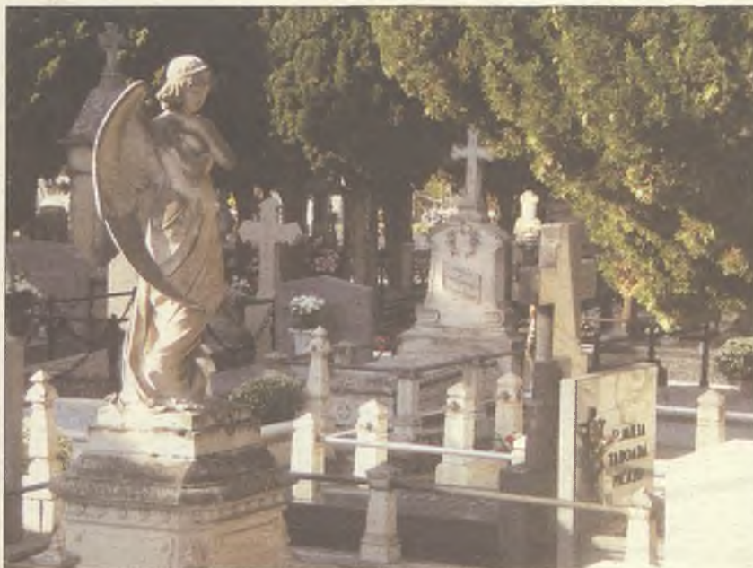
172AÑOS DE HISTORIA. El cementerio de Guadalajara se construyó en 1840

"No hemos notado un incremento en el índice de morosidad. Si transcurrido el periodo de concesión no se paga, entonces se pierde", explica del Castillo. En la actualidad, el camposanto de Guadalajara contiene 52.510 enterramientos, de los cuales, 3.815 corresponden a sepulturas temporales (diez años), algo