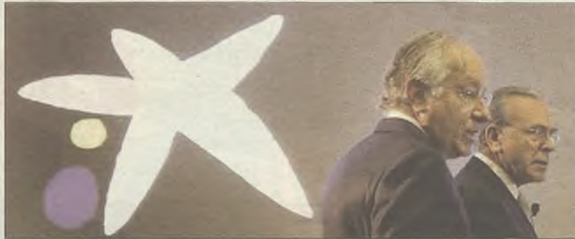
En la imagen, Isidro Fainé, presidente de CaixaBank

La entidad financiera logra este resultado tras dotar 8.374 millones