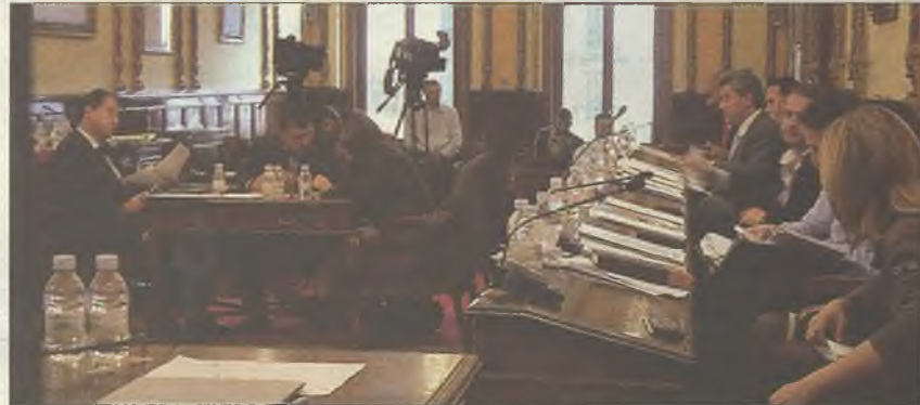
Momento del Pleno celebrado el pasado viernes

PSOE e IU fueron rechazadas por entender el equipo de Gobierno que van en contra del equilibrio presupuestario que se quiere para el Ayuntamiento. "Por mucho que quieran, no nos vamos a salir un ápice del camino del rigor, el equilibrio económico y del sanea-