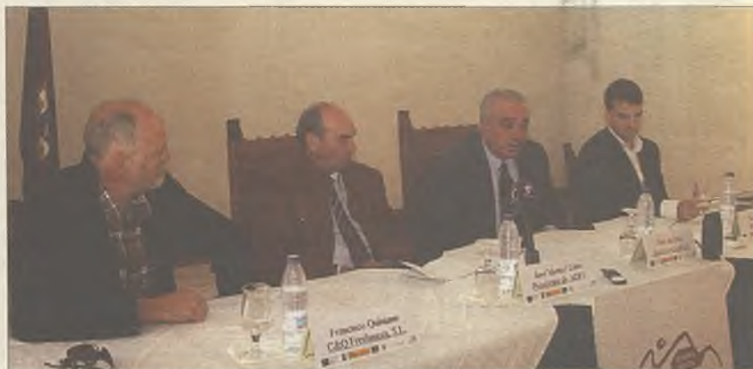
Momento de la presentación de la aplicación para smartphones

Nace la aplicación Sierra Norte para móviles con toda la información útil para el turista