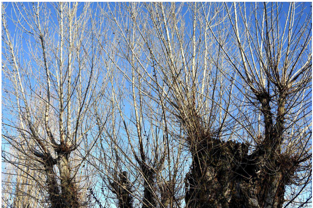
Las finas ramas superiores producto de sucesivas podas