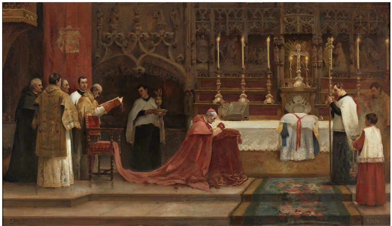
MARCELIANO SANTAMARÍA SEDANO: Misa Pontifical. 1890. Museo del Prado.