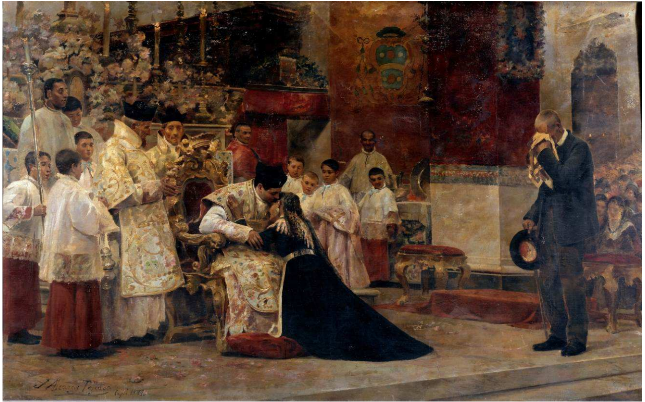
JOSÉ ALCÁZAR TEJEDOR: Los padres del celebrante después de la misa nueva, 1887. Museo del Prado