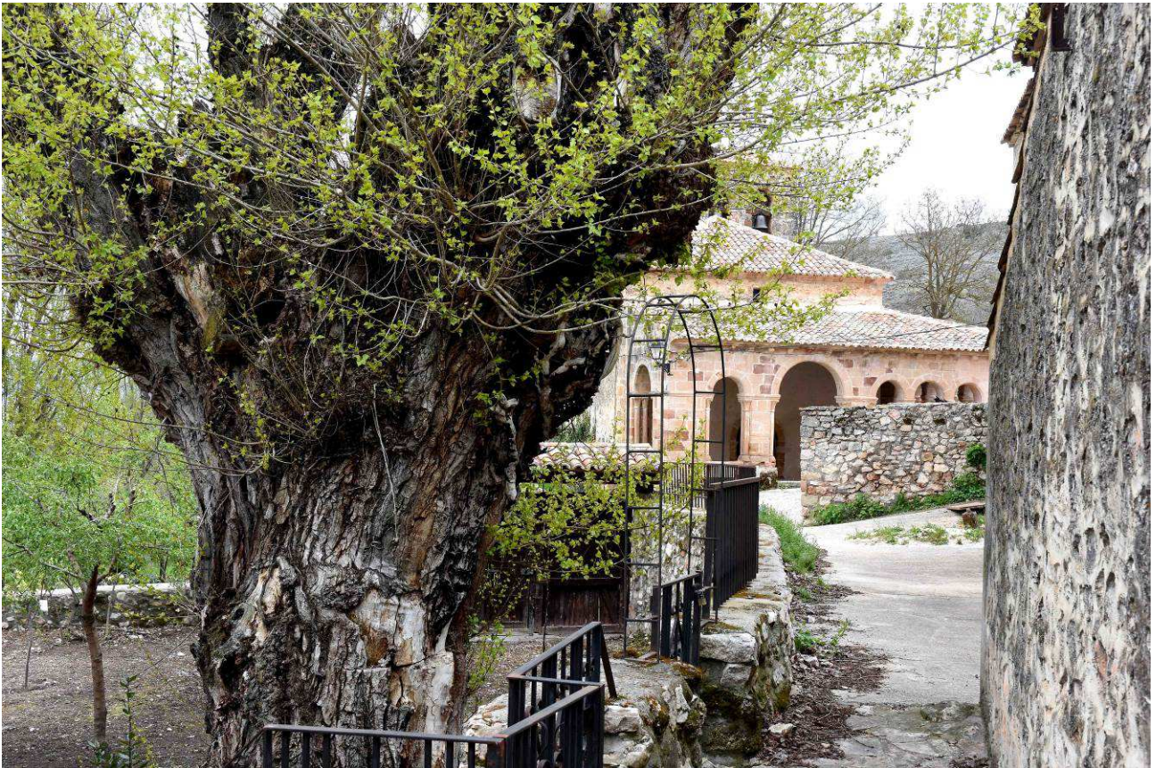
El árbol en el interior del recinto donde se encuentra