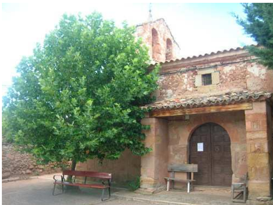
Iglesia de Ujados

En posesión de un pequeño sueldo se dedicó con todo entusiasmo a la escultura, haciendo obras para varias exposiciones, siendo premiado en el salón de otoño de 1924 con el premio de Socio de Honor de la Asociación de Pintores y Escultores; en la Nacional de 1925 obtuvo tercera medalla con una estatua tallada en madera que se conserva en el museo de Arte Moderno.