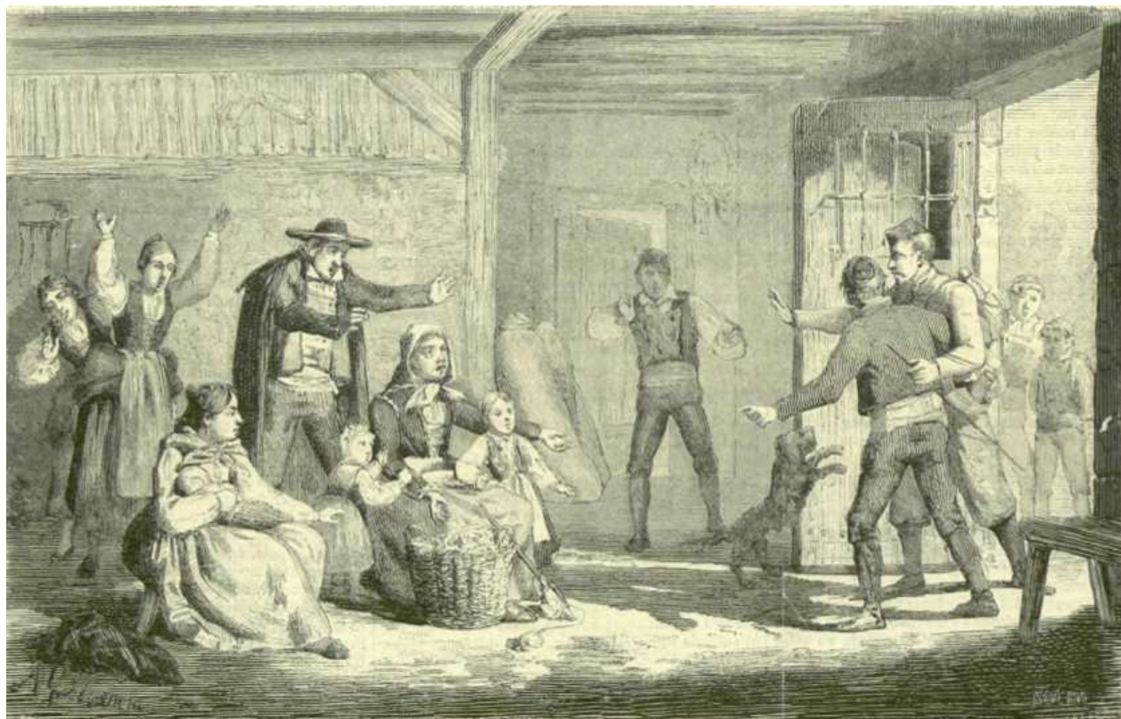
REGRESO DEL MOZO AL SENO DE SU FAMILIA

Se tallaron este año de 1903, 23 mozos, de los que 5 resultaron inútiles definitivos (cortos de talla, padre sexagenario, hijo de viuda pobre). El mozo más alto midió 1'74 y el más bajo 1'32.