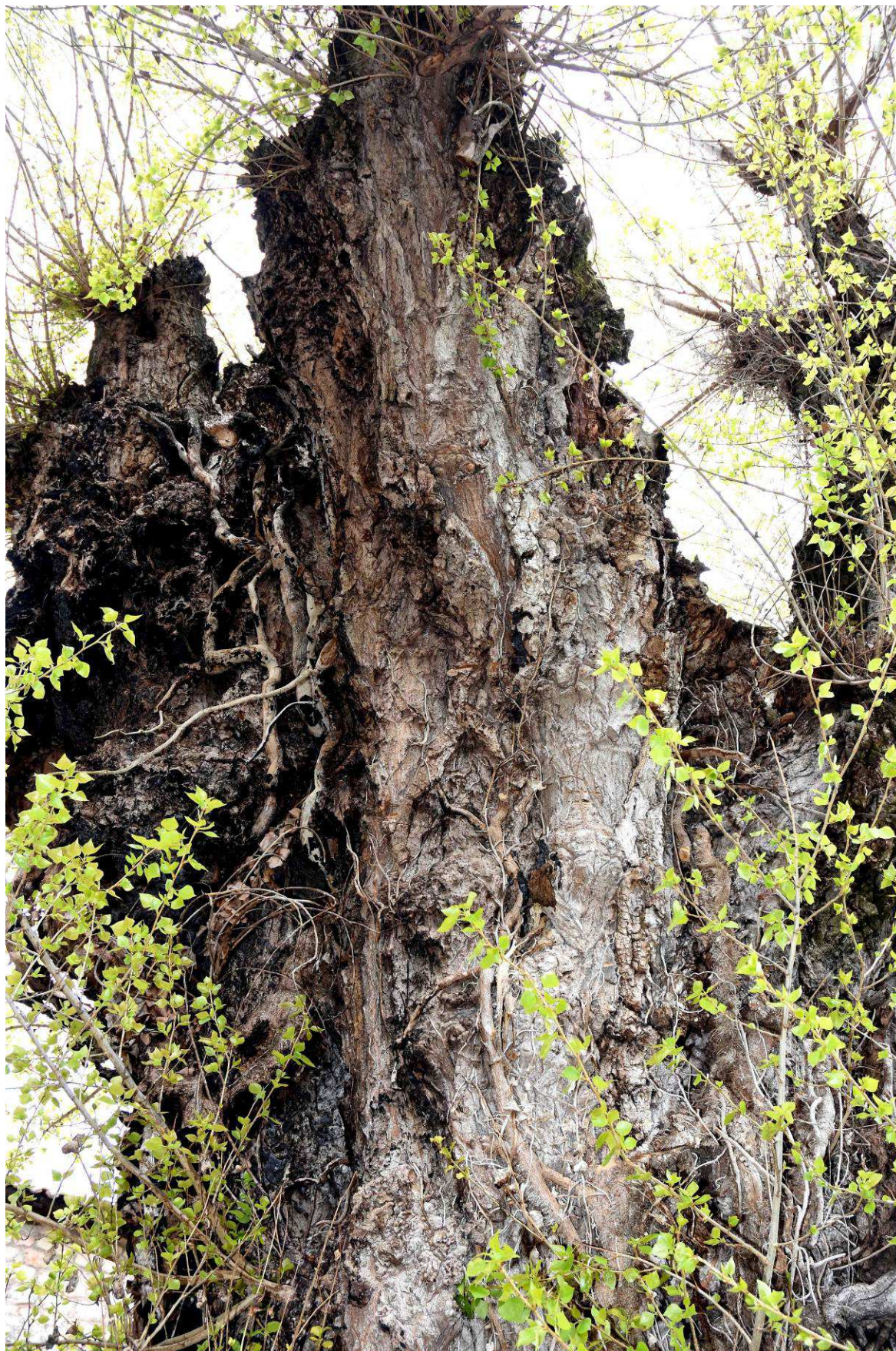
Otro aspecto del tronco, cuajado de rugosidades