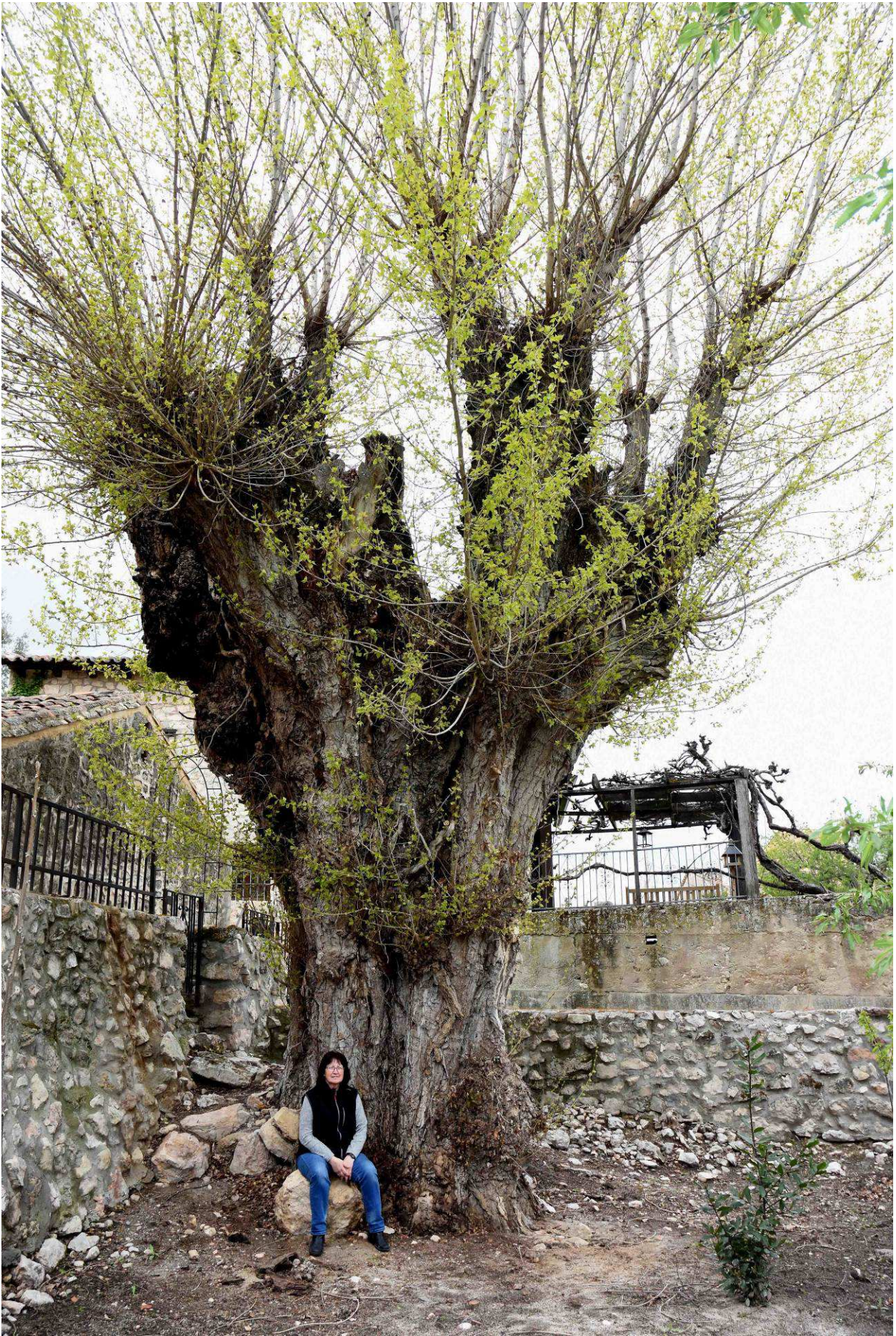
Aspecto del ejemplar donde se hace visible la parte oscura del tronco