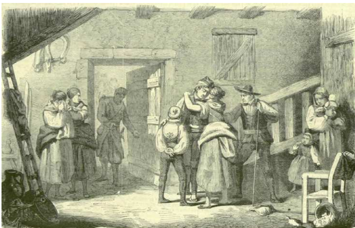
DESPEDIDA DE UN MOZO AL QUE LE HA TOCADO LA SUERTE DE SOLDADO

Se tallaron este año de 1902, 13 mozos, de los que 3 resultaron inútiles definitivos (cortos de talla). El mozo más alto midió 1'64, y en este caso, son dos los mozos más bajos con 1'49.