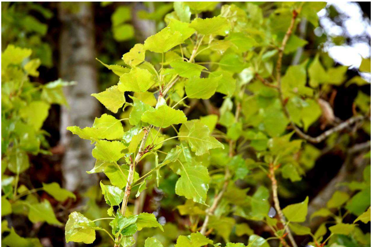
Sus hojas en primavera