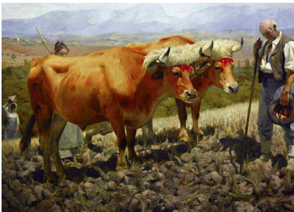
EL REZO DEL ANGELUS EN EL CAMPO. Ignacio Díaz Olano , 1899 (Museo de Bellas Artes de Álava)