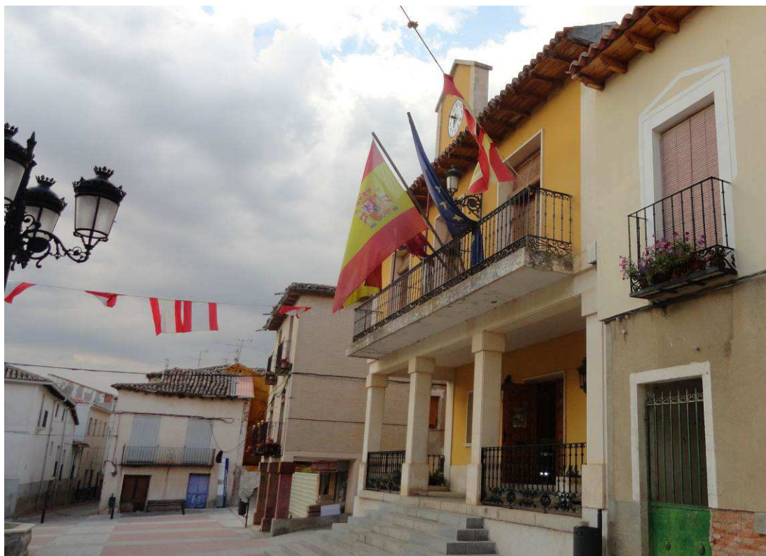
El 27 de mayo de 1903, del Ayuntamiento de Jadraque colgaron banderas de fiesta.

Bueno, a los actos faltó una representación. Al municipio de Miralrío no le quedó otra que la de aceptar las decisiones judiciales, pero como no las compartió, no acudió. Todavía conserva, en el centro del municipio, la calle que recuerda que, muy cerca de allí, hubo un pueblo llamado Salaices.