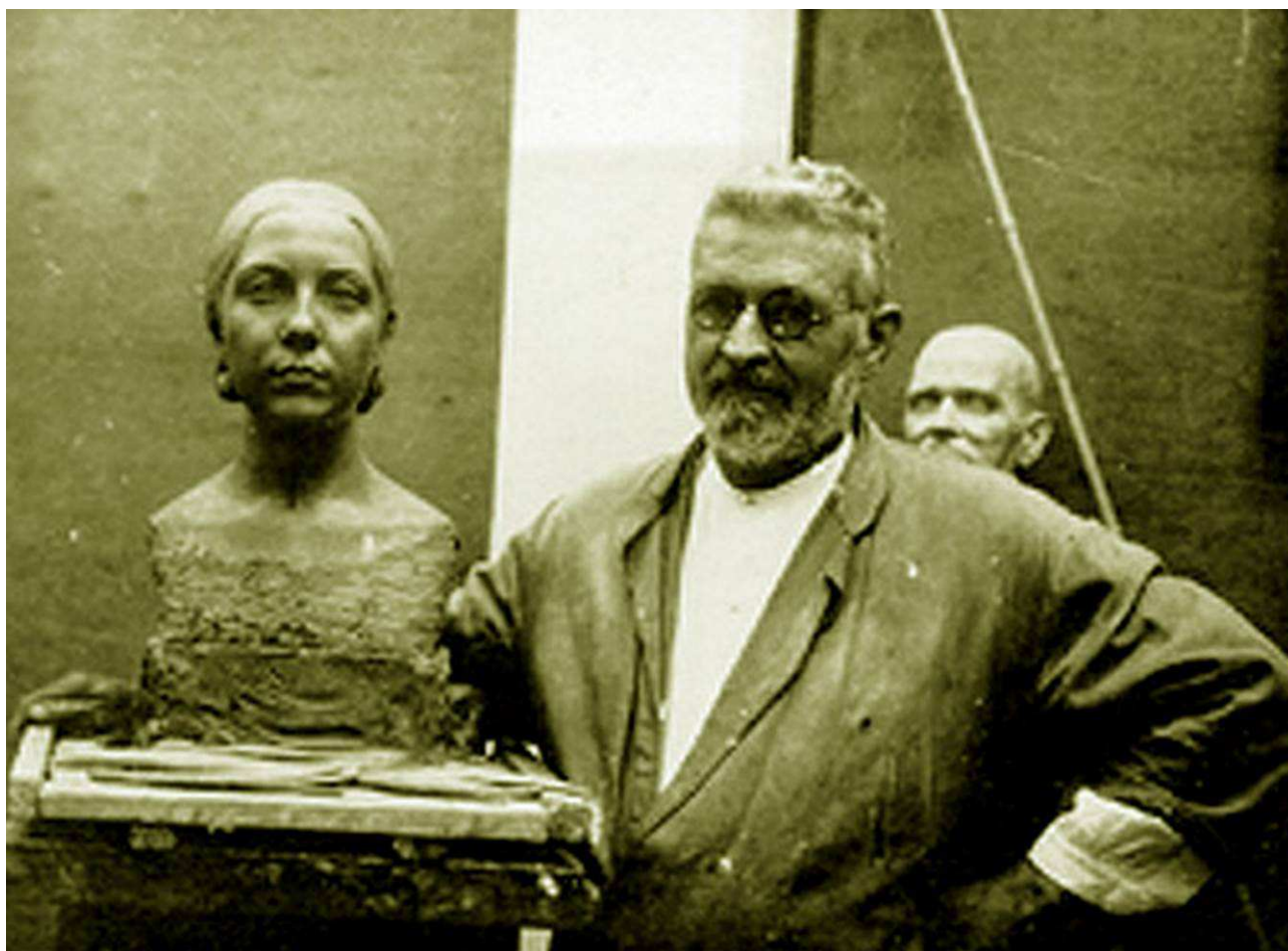
Miguel de la Cruz Martín, fallecido el 8 de junio de 1917

Miguel continuó la técnica de su hermano, presentando a la exposición Nacional de bellas Artes de 1924 una talla de mujer en madera que fue considerada como de lo mejor de la muestra, aunque no obtuviese mención alguna.