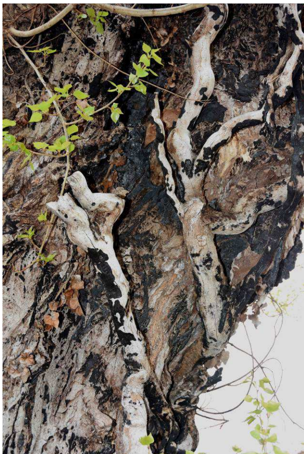
Restos de la hiedra que crecía sobre él

Se trata de un álamo negro ( Populus nigra ). Los pópulus eran llamados antiguamente los árboles del pueblo porque la población se sentía muy identificada con ellos por los múltiples usos que tenían. En verano, sus jugosas hojas eran aprovechadas por un buen número de especies domésticas, así como sus ramas y corteza. Igualmente de forma tradicional, su madera ha sido aprovechada para la construcción de establos y lugares para animales, o por los imagineros para confeccionar figuras y elementos propios de la etnografía, pese a que su madera no puede competir en calidad por su falta de dureza con otras especies mucho más aptas.