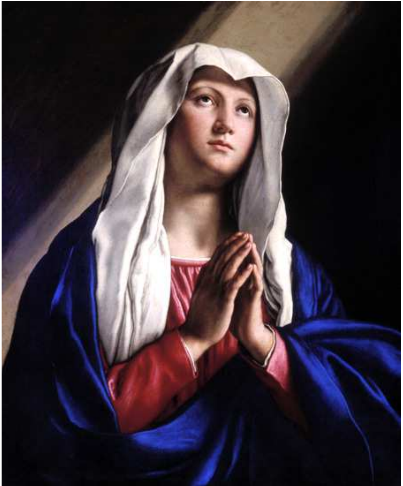
VIRGEN REZANDO. Giovanni Battista Salvi , conocido como El Sassoferrato (1609 – 1685)