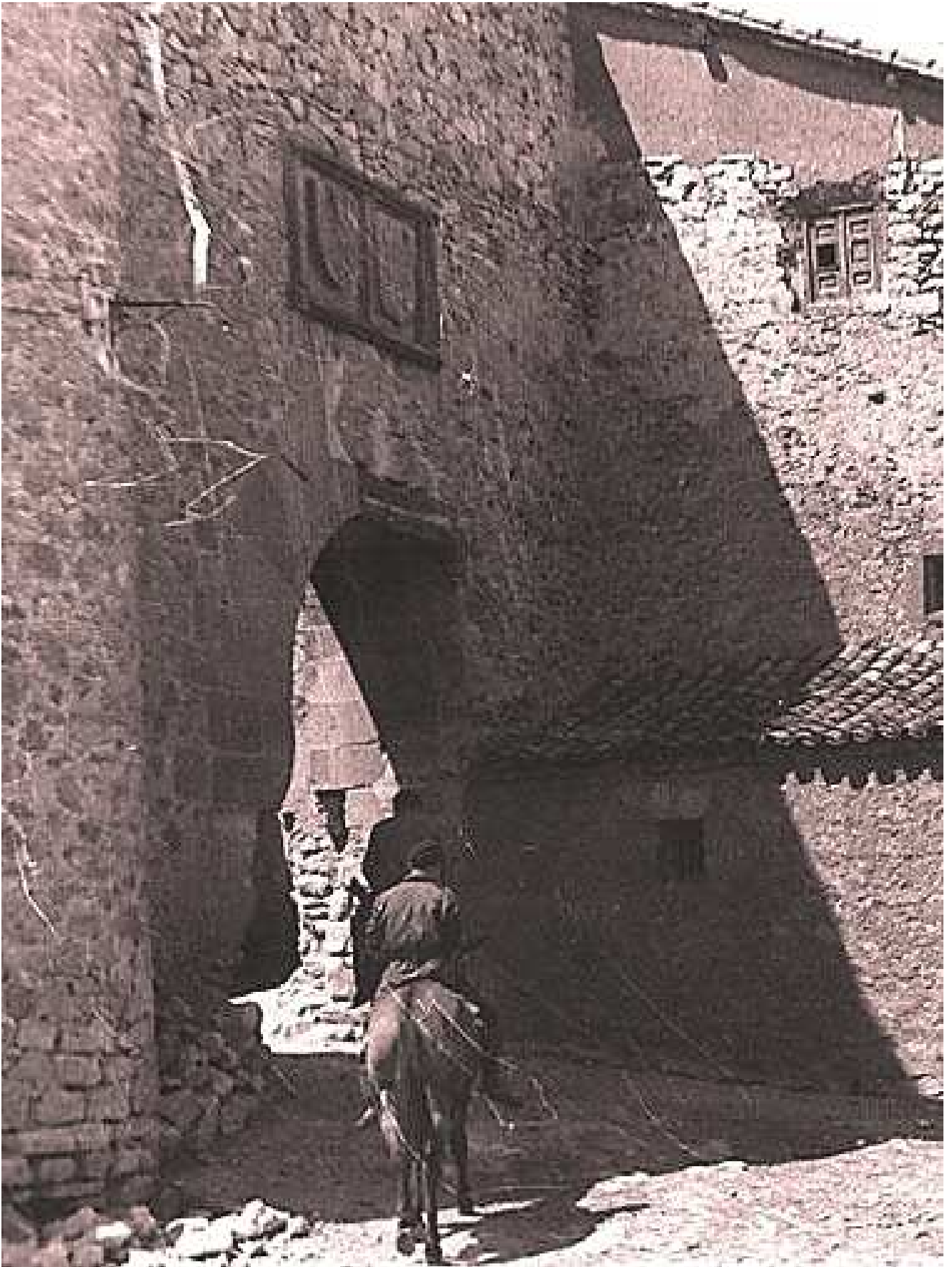
Palazuelos, puerta de la villa