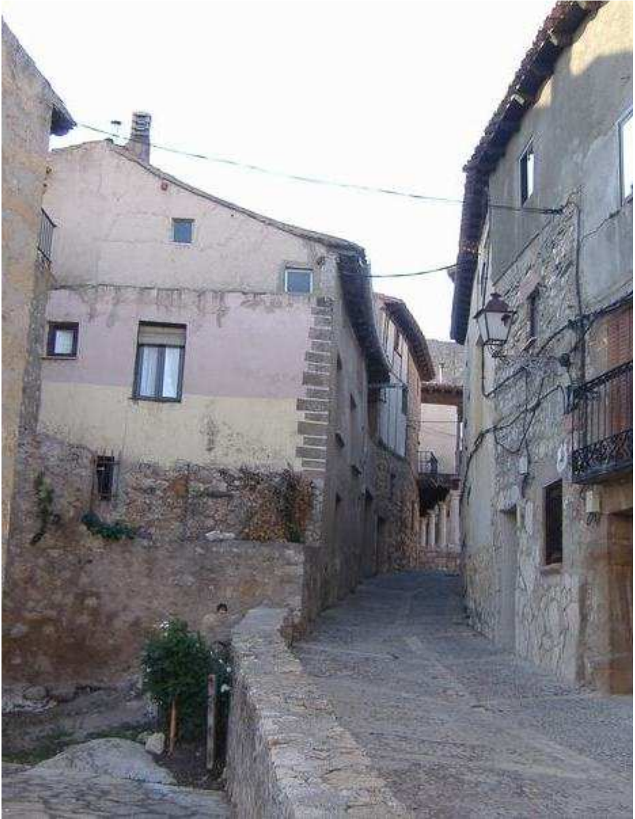
Atienza: Calle de Francisco Layna Serrano, antes del Águila