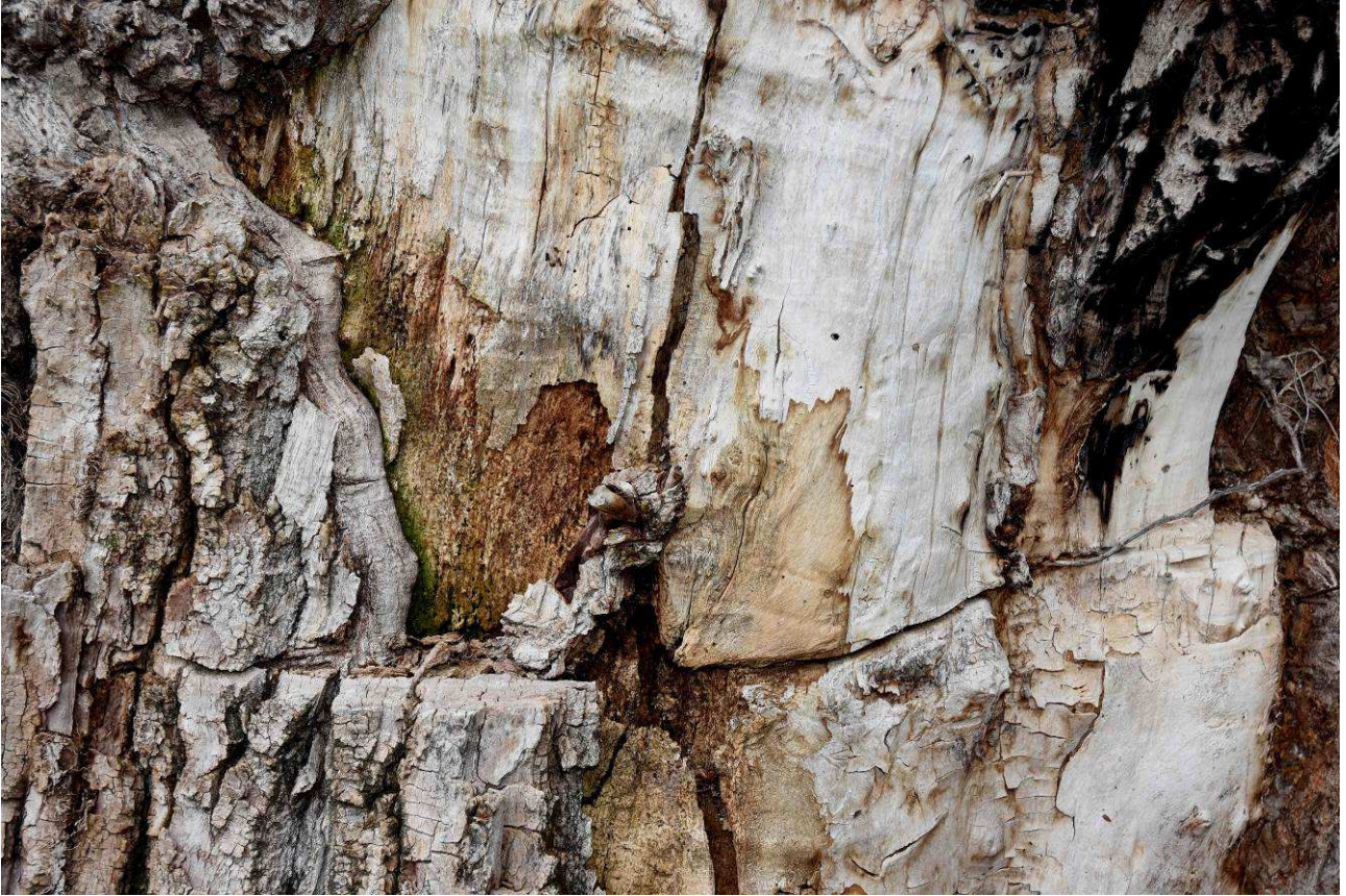
Cortes y huellas de los tratamientos en el tronco