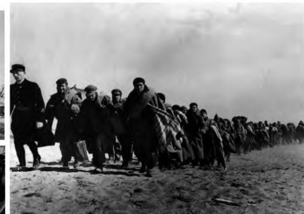
foto1.- Campo de bram 1939 ©Agustí Centelles. foto2.- 15 enero 1939. En el camino de Tarragona a Barcelona. (Algunos refugiados fueron asesinados o alcanzados por las bombas fascistas mientras huían).©Robert Capa. foto3.- 25 enero 1939 Frontera Barcelona-Francia. ©Robert Capa. foto4.- Refugiados españoles en Francia, 1939. ©Robert Capa.