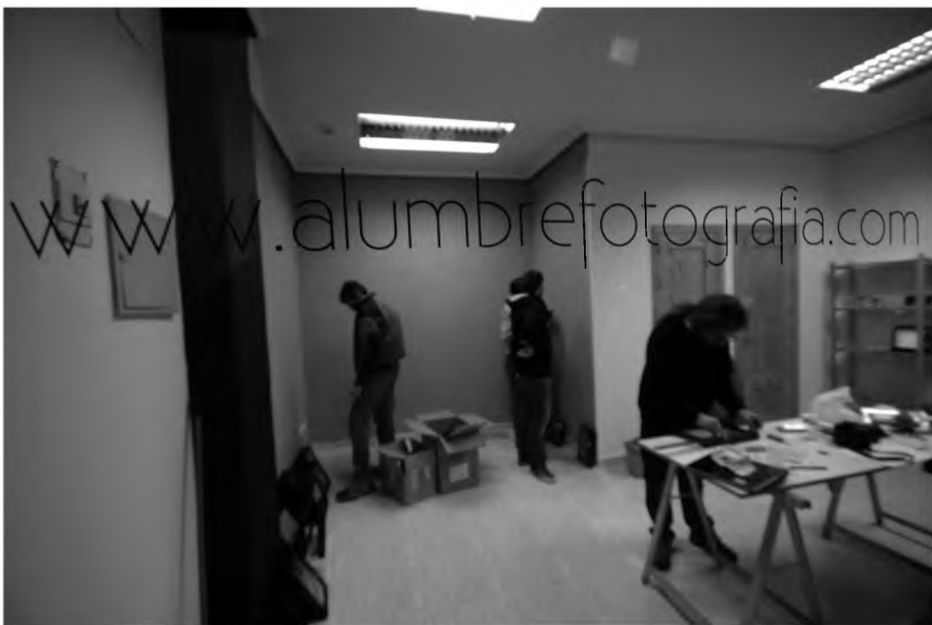
Montaje de la primera exposición. Diciembre de 2012

#4aniversarioALUMBREsiteDiciembre2012016