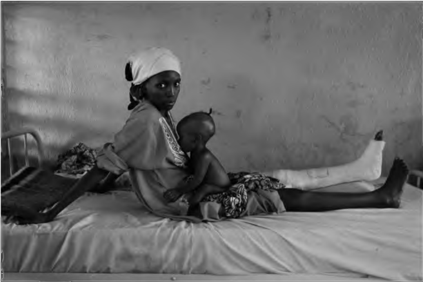
Amigos que colaboran con nosotros:

Durante 2015 se produjo una de las campañas de mayor violencia por parte del grupo, que perpetró ataques a pueblos, mercados, estaciones de autobús, mezquitas, iglesias... con el resultado de cientos de personas asesinadas y un incremento de desplazados y refugiados en toda la región.