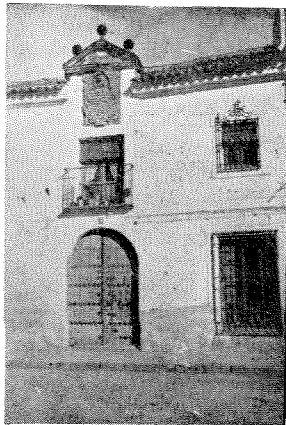
La Casa de la Niña

compararla con la de la Niña en el Boquete —Casa de Saavedra, casado con otra Maraño- na y en poder de la Niña por la misma razón antedicha—, publicada en el fascículo cuar- to y deshacer un equivoco que se produjo entonces.