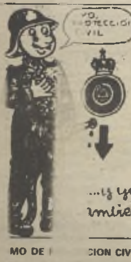
MO DE ... DION CIVIL

CANFALI ... solidaria za neces... ante con s articulo... sus cola oradores... puntos de vista... eta. a opinión... NFALI siempre qu... conste lo contrar... edará reflejada en... columnas EDITORALES