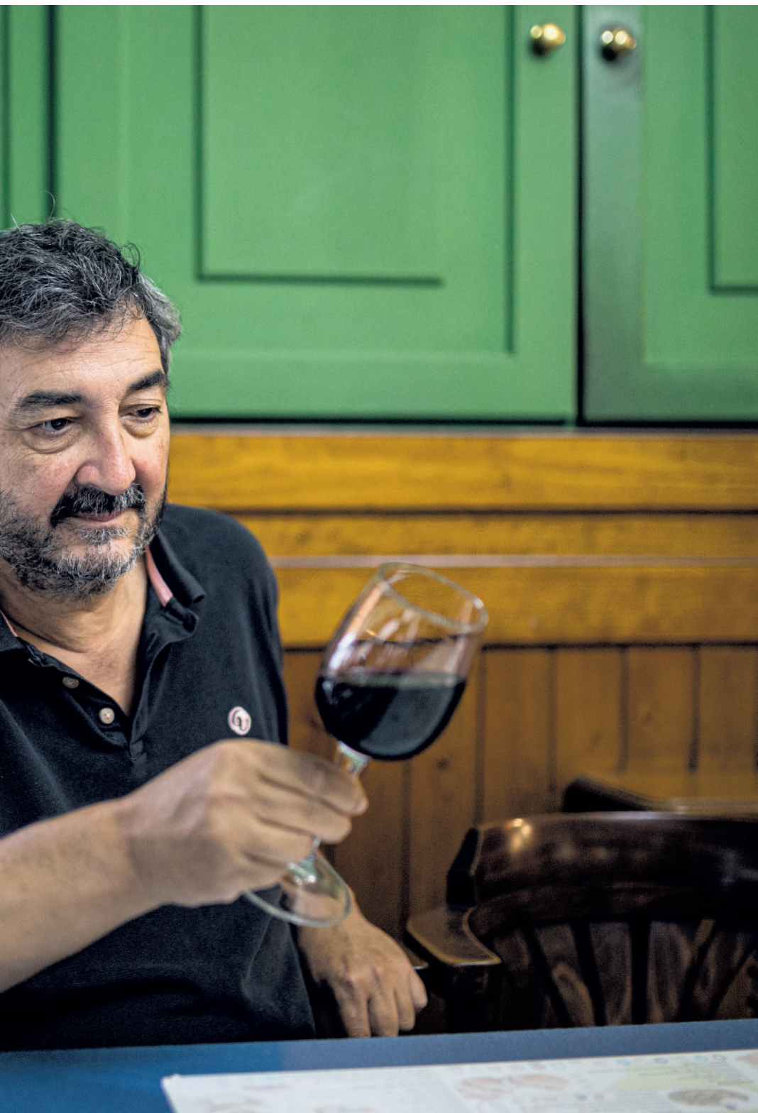
‘OTRAS MIRADAS SOBRE EL VINO: ETNOGRAFÍAS Y REPRESENTACIONES’ / CARLOS DÍAZ

que tensa la cadena de solidaridad y tiene una conducta “antisocial”.