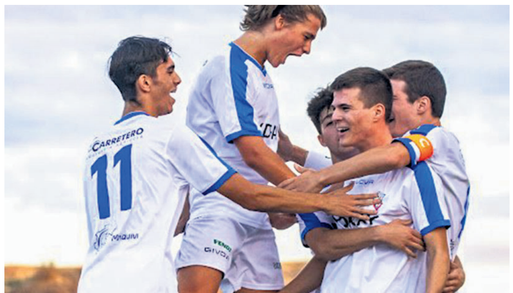
JUGADORES DEL VALDEPEÑAS JUVENIL CELEBRAN UN GOL

Por otro lado, el Valdepeñas sénior de Primera Preferente perdió en la segunda jornada en Herencia por 3-2. Y eso que los vinateros se pusieron con un 0-2 a favor, tantos de Miguel Herenas y de Gustavo, pero el rival remontó a partir del minuto 61. Los de Ángel Luis Morales son octavos con tres puntos y este domingo recibirán la visita del Almagro (19 horas).