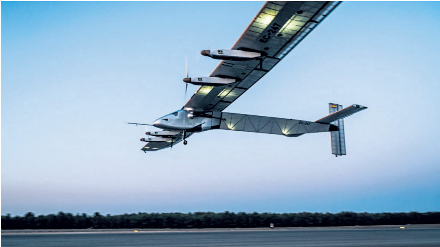
AERÓDROMO DE VALDEPEÑAS, ADQUIRIDO POR SKYDWELLER