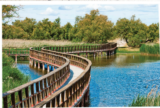
Parque Nacional de las TABLAS DE DAIMIEL