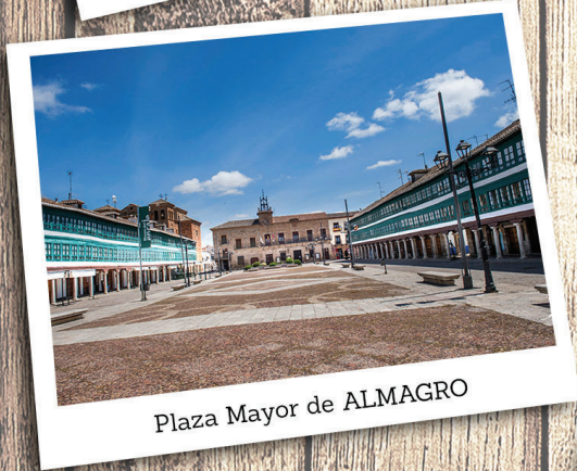
Plaza Mayor de ALMAGRO