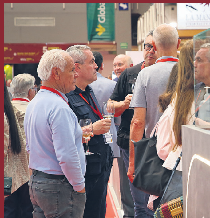
En Fenavin han coincidido 1.874 expositoras