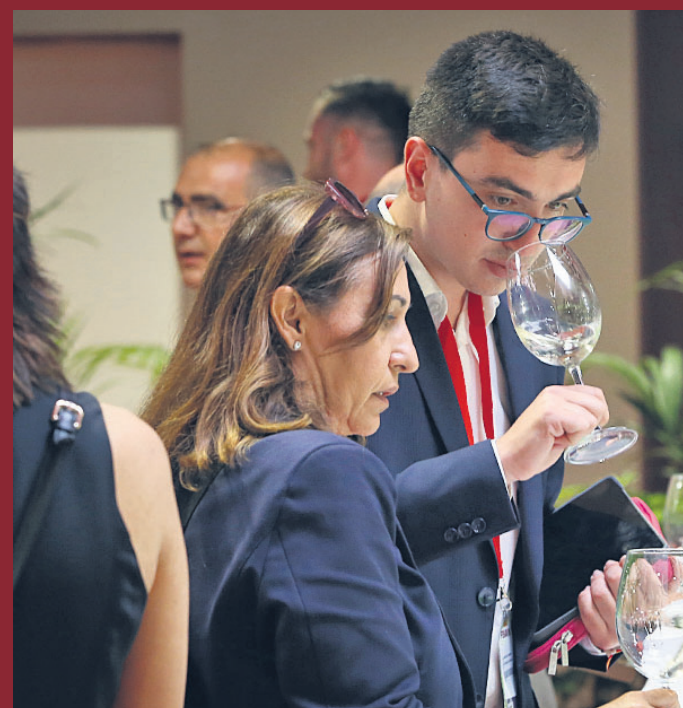
Compradores y profesionales del sector prueban los vinos en