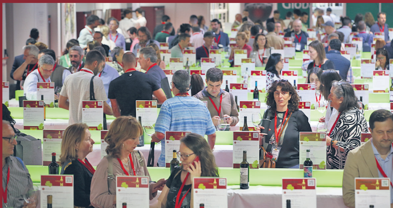
Fenavin ha atraído a 18.805 compradores de todo el mundo