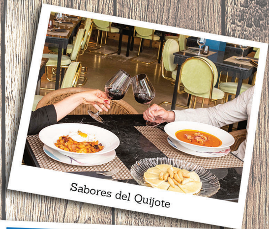
Sabores del Quijote