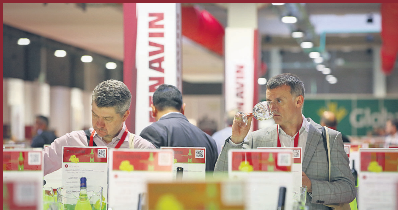
El almacén de la Galería del Vino ha reunido 15.000 botellas y 5.000 copas