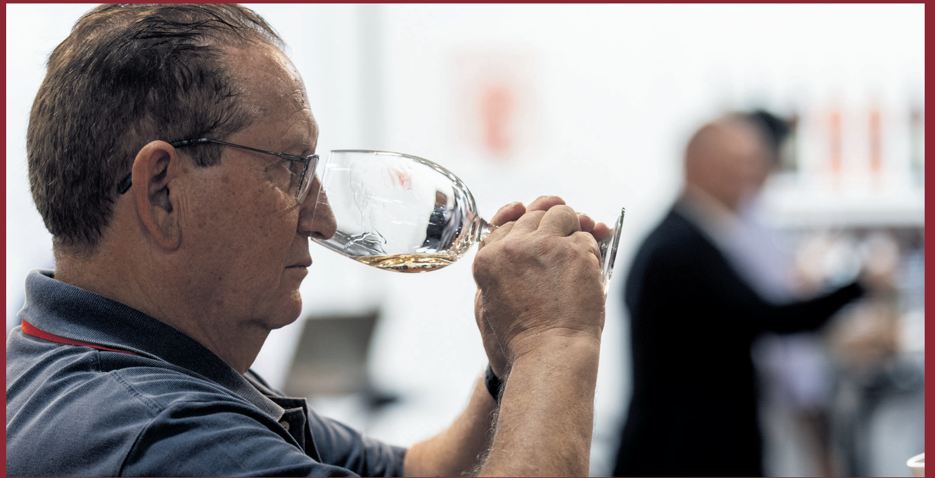
Catadores en Fenavin