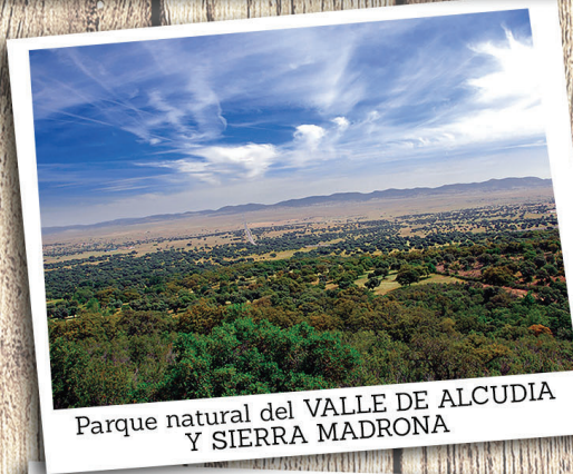
Parque natural del VALLE DE ALCUDIA Y SIERRA MADRONA