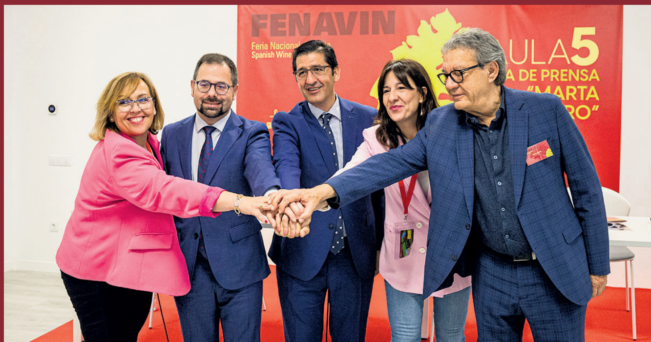
Imagen de la rueda de prensa de balance de Fenavin