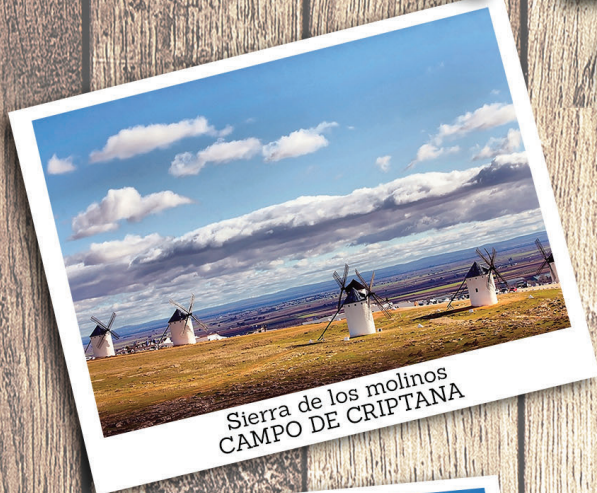
Sierra de los molinos CAMPO DE CRIPTANA