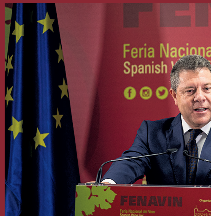
Emiliano García-Page en la apertura de la feria