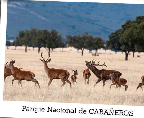
Parque Nacional de CABAÑEROS