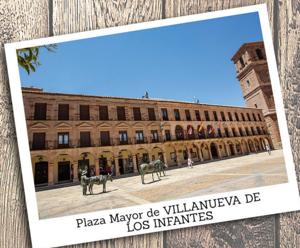
Plaza Mayor de VILLANUEVA DE LOS INFANTES