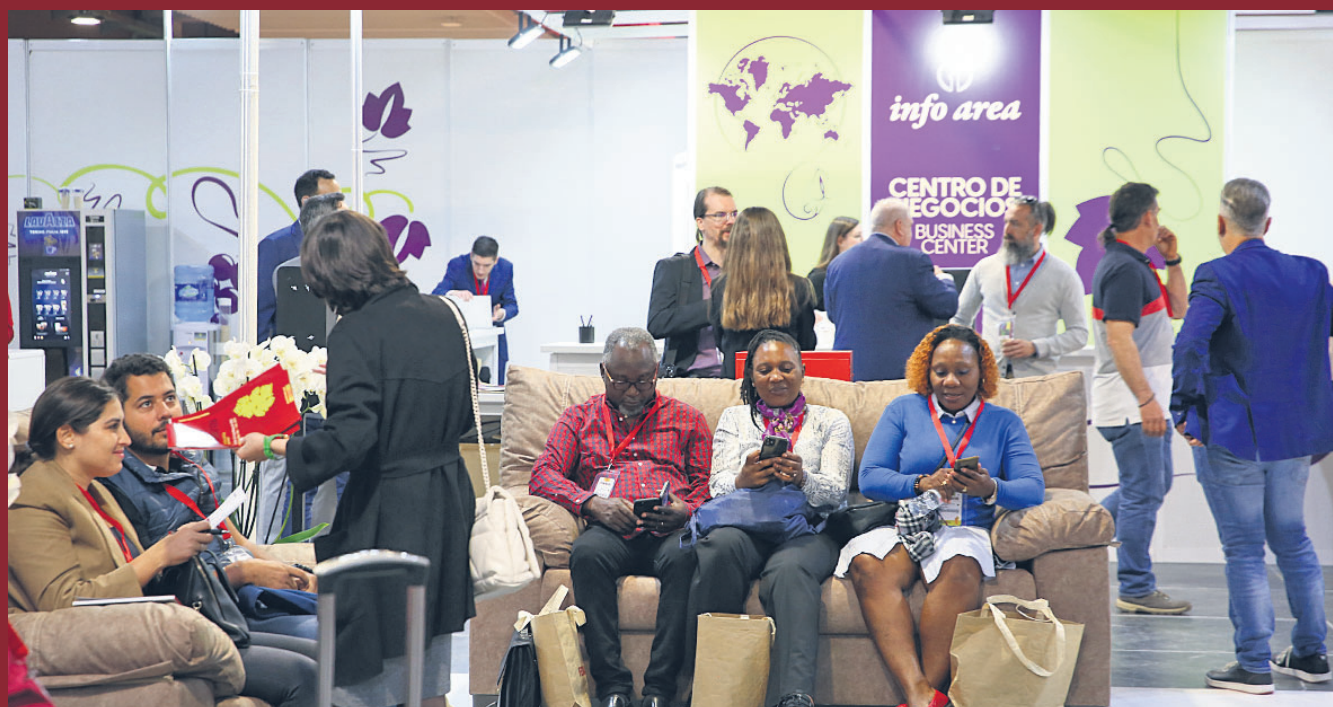
Importadores de Ghana y Camerún han pasado por el Centro de Negocios de Fenavin