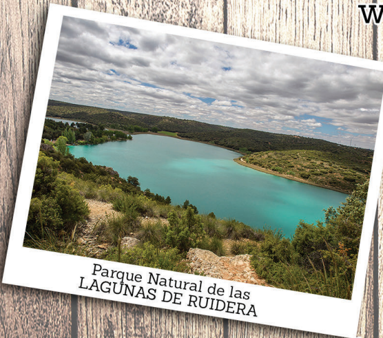
Parque Natural de las LAGUNAS DE RUIDERA