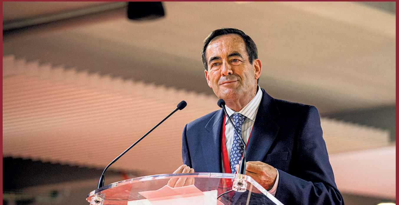
José Bono, expresidente de Castilla-La Mancha, en el nombramiento de 'Maestros Fenavin'