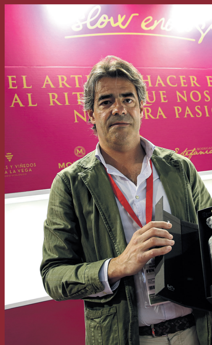
El vino más caro de Fenavin ha sido un fondillón de Alicante