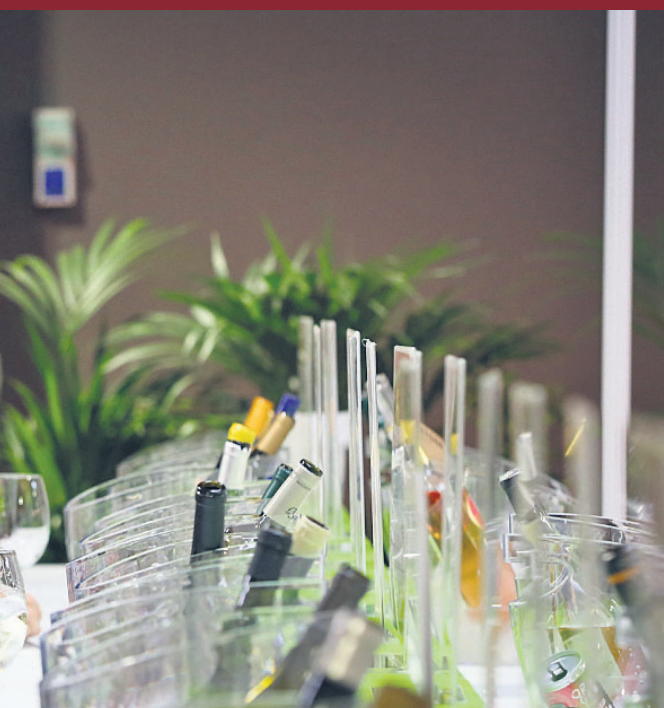
la sala de catas