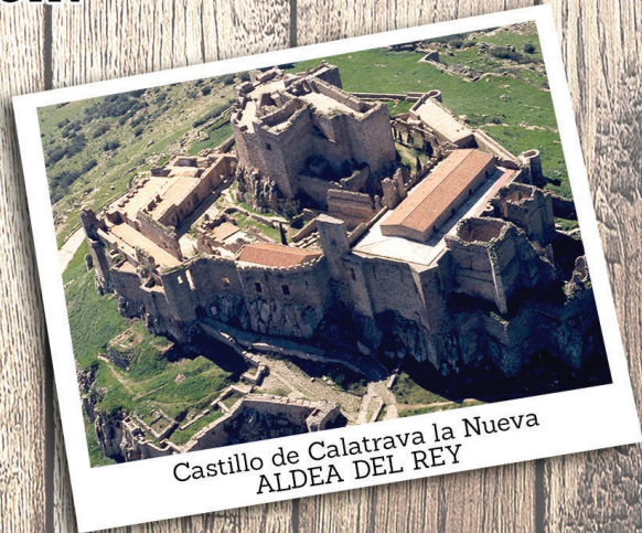
Castillo de Calatrava la Nueva ALDEA DEL REY