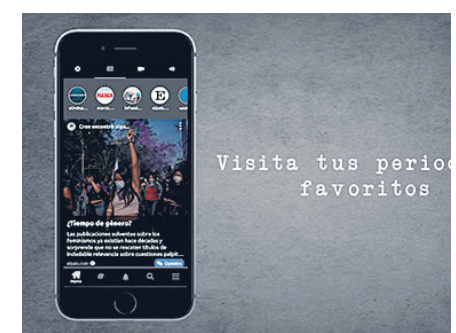
CARTEL DE UCRONIC / LANZA

Uchronic ha sido creada para ofrecer la mejor experiencia informativa. Gracias a un navegador integrado y a las herramientas para medios de comunicación puede ofrecer algo muy interesante: Una plataforma de suscripciones exclusiva para ellos, donde el usuario podrá disfrutar de una experiencia única.