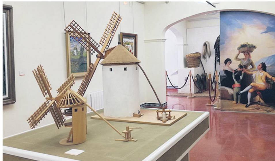
EL MUSEO DE LOS MOLINOS Y DE LA CIUDAD, DE VALDEPEÑAS