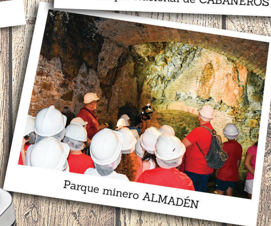
Parque minero ALMADÉN