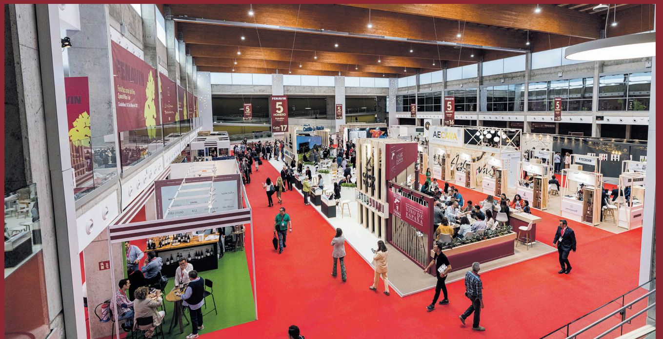
La feria ha ocupado 28.000 metros de superficie expositiva