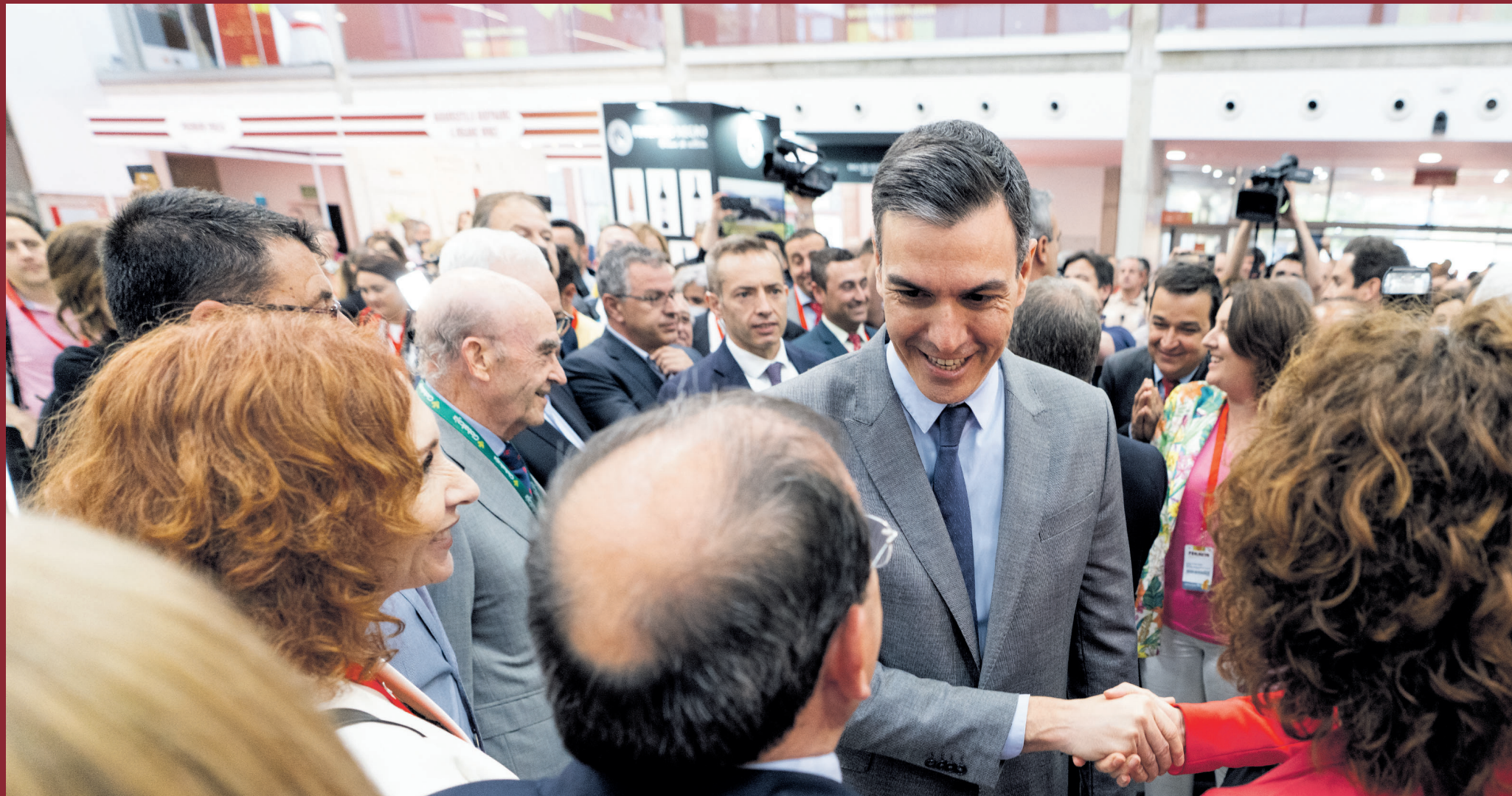
El presidente del Gobierno de España, Pedro Sánchez, llega a Fenavin