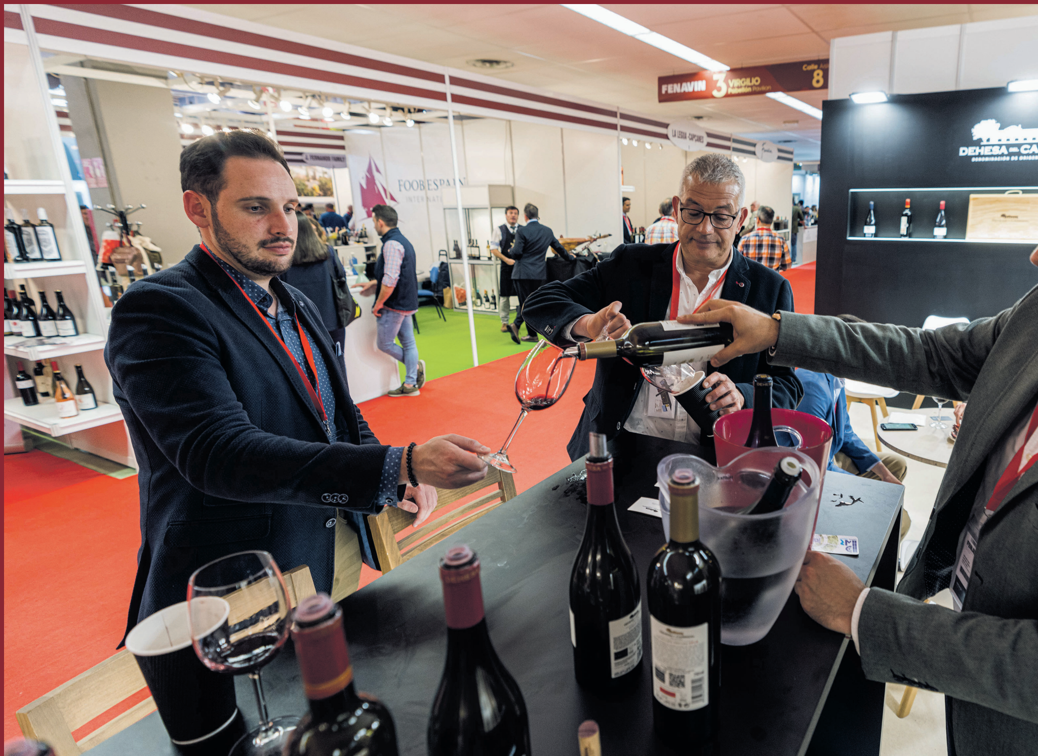
4.277 compradores han hecho ventas por valor de 15.000 euros de media