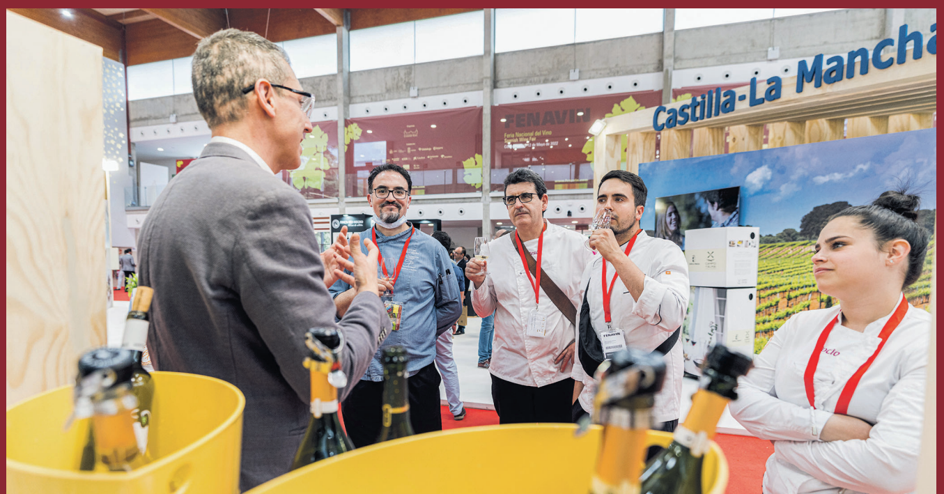
Compradores prueban los vinos en Fenavin