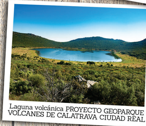
Laguna volcánica PROYECTO GEOPARQUE VOLCANES DE CALATRAVA CIUDAD REAL