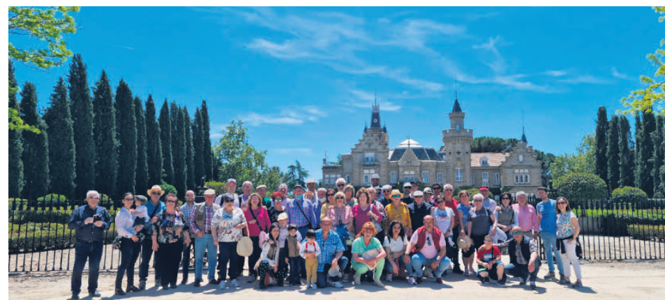
LA PEÑA TAURINA "EL BURLADERO" VISITA LA FINCA "EL CASTAÑAR"

Dos de las alumnas manifestaron que les gusta plantar árboles, trasplantarlos y regarlos y mostraron su satisfacción por colaborar con el ayuntamiento y con "Un árbol por Europa" en esta iniciativa.