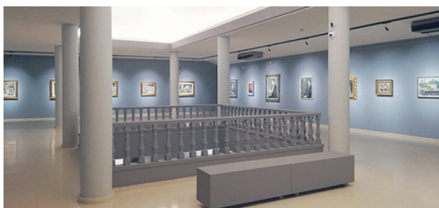
EL MUSEO GREGORIO PRIETO REABRE ESTE VIERNES SUS PUERTAS