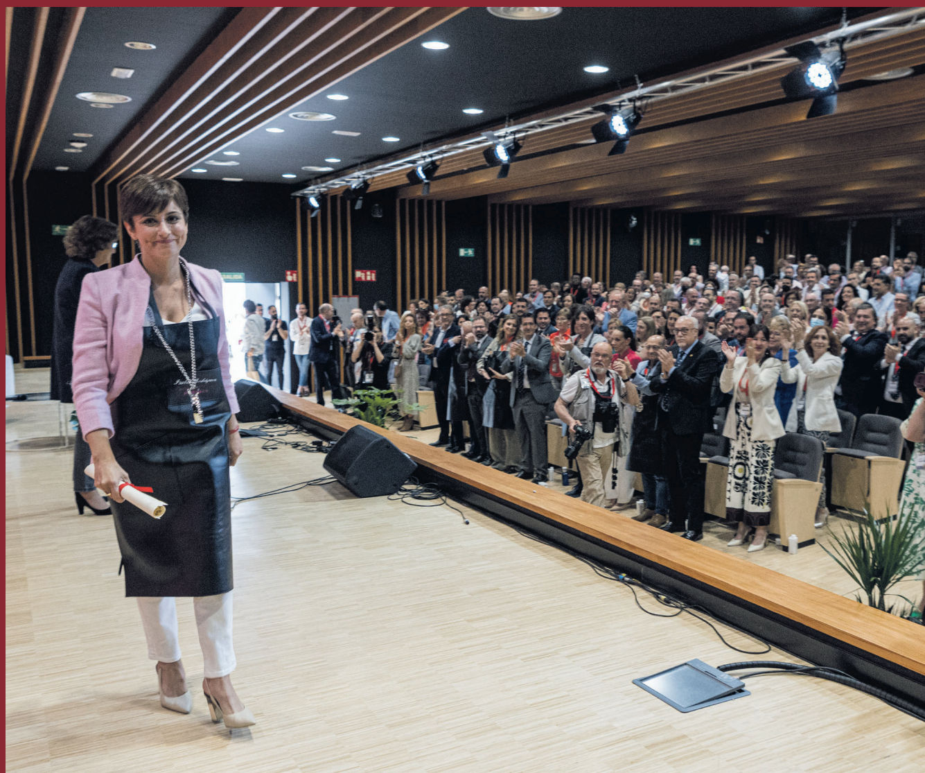
La ministra Isabel Rodríguez es nombrada 'embajadora del vino'