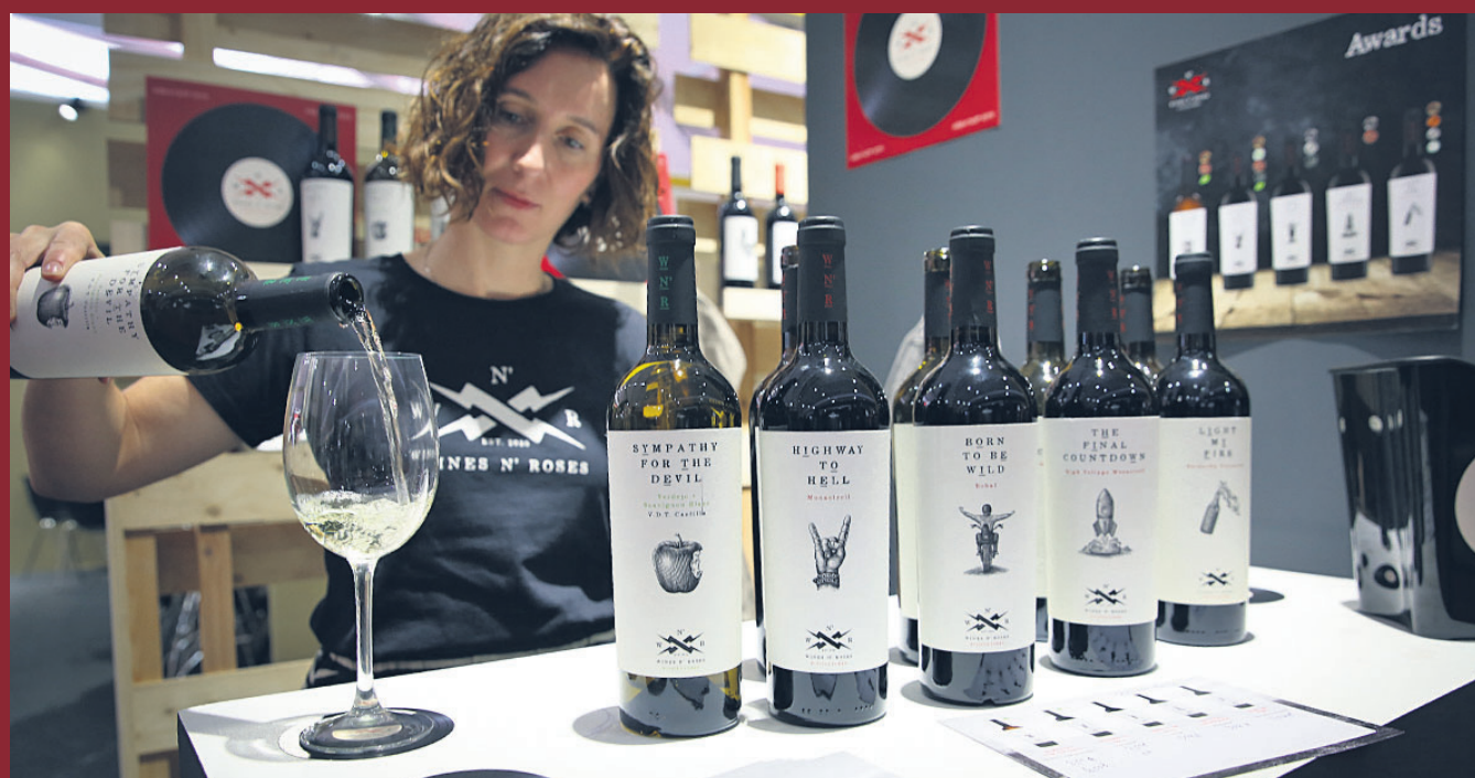
Vinos con nombre de canciones de rock, entre las propuestas más arriesgadas