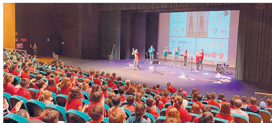
LA ACTIVIDAD DE PERCUSIÓN CORPORAL Y ESPECIALIDADES DE VIENTO / LANZA

Un total aproximado de 500 escolares entre los 8 y los 9 años de edad disfrutaron de una sesión de trabajo auditivo, corporal, psicomotriz y rítmico, tomando como base los instrumentos de viento y percusión que se